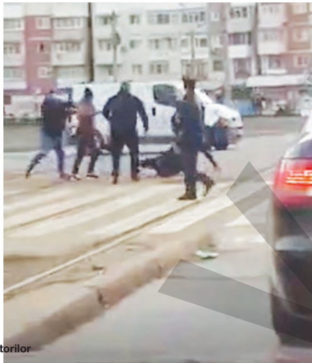
● Cei cinci bărbați și-au împărțit pumni și picioare sub privirile îngrozite ale trecătorilor

DUPĂ CE DOI PIETONI AU TRAVERSAT NEREGULAMENTAR ● SCANDAL