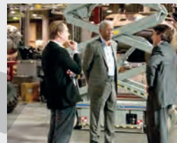
SUA, Acțiune, Crimă, Dramă, Thriller

ANTENA 1 07:00 Observator 08:00 Neatza cu Răzvan și Dani 11:00 Prietenii de la 11 13:00 Observator 14:00 Guess My Age - Ghicește vârsta 16:00 Observator 17:00 Acces direct 19:00 Observator 20:00 Asia Express 21:00 Xtra Night Show 01:00 Cavalerul negru: Legenda renaște (R) 03:30 Acces direct (R) 05:00 Guess My Age - Ghicește vârsta (R) 06:00 Observator