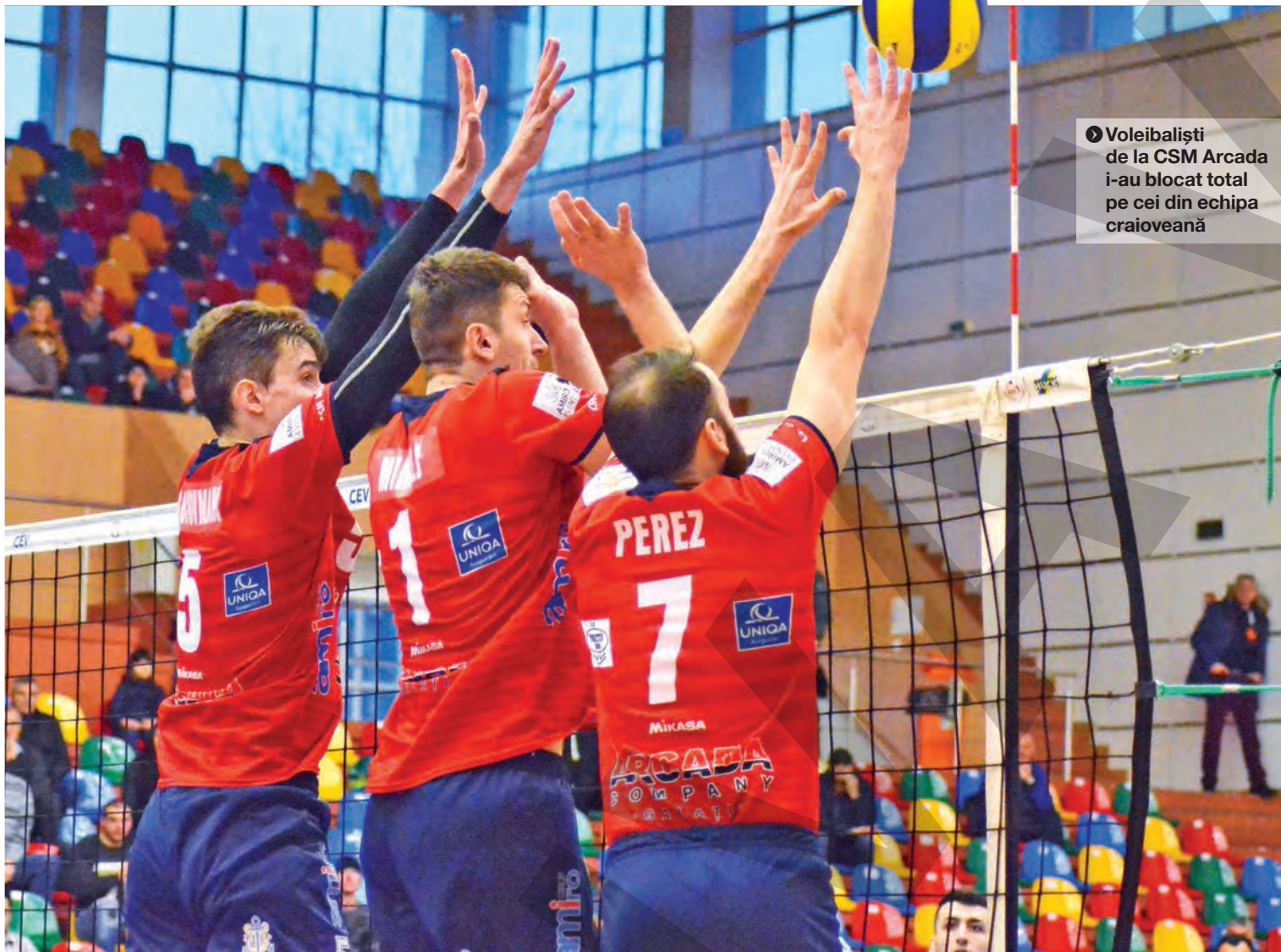
● Voleibaliști de la CSM Arcada i-au blocat total pe cei din echipa craioveană

GHEORGHE ARSENIE gheorghe@viata-libera.ro