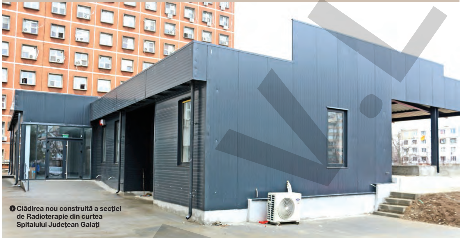
► Clădirea nou construită a secției de Radioterapie din curtea Spitalului Județean Galați

NOUL ACCELERATOR DE PARTICULE, PRIMIT ÎN CASĂ NOUĂ ● EXCLUSIV