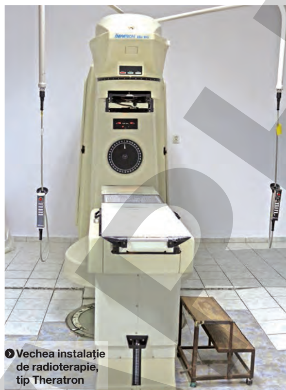
Vechea instalație de radioterapie, tip Theratron

COSTEL FOTEA președintele Consiliului Județean Galați