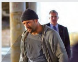
SUA, Acțiune, Crimă Centurion

PRO TV 07:00 Știrile Pro Tv 10:30 Vorbește lumea 13:00 Știrile Pro Tv 14:00 Lecții de viață 15:00 La Maruță 17:00 Știrile Pro Tv 18:00 Ce spun românii 19:00 Știrile Pro Tv 20:30 În siguranță 22:15 SUA, Acțiune, Crimă Centurion Marea Britanie, Acțiune, Aventuri, Dramă, Război 00:00 Știrile Pro Tv 00:30 În siguranță (R) SUA, Acțiune, Crimă, Thriller 02:00 Lecții de viață (R) 03:00 Vorbește lumea (R)