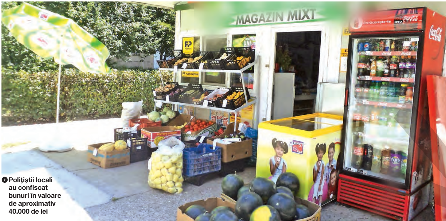
● Polițiștii locali au confiscat bunuri în valoare de aproximativ 40.000 de lei

PENTRU DIFERITE NEREGULI CONSTATATE DE POLIȚIȘTII LOCALI ● CONTROALE