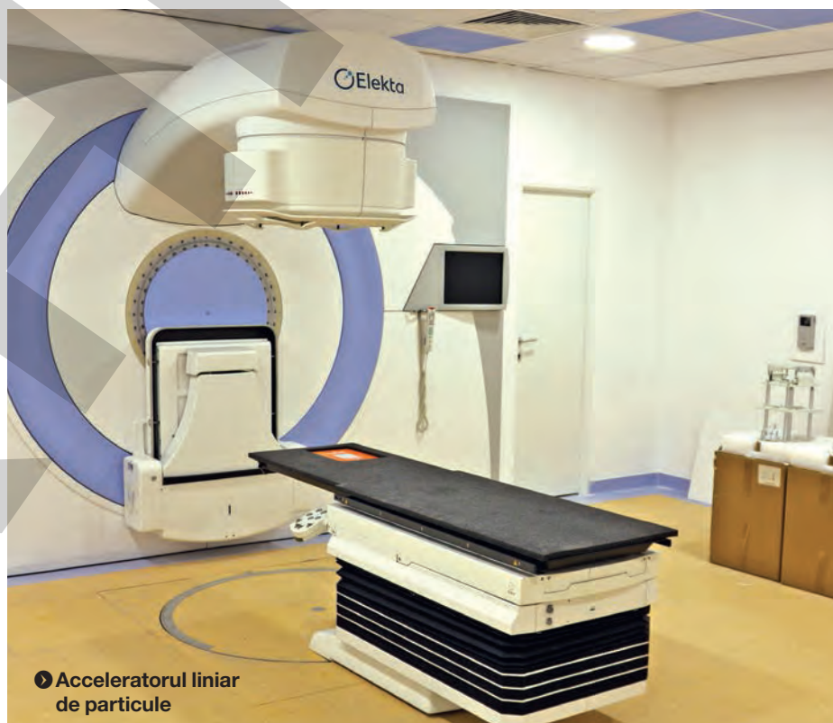
Acceleradorul liniar de particule

"În momentul de față se lucrează la calibrarea aparatului și la efectuarea tuturor măsurărilor necesare pentru siguranță și eficiență. Mai avem nevoie de avizul Agenției Internaționale pentru Energie Atomică de la Viena și de cel al Comisiei Naționale pentru Controlul Activităților