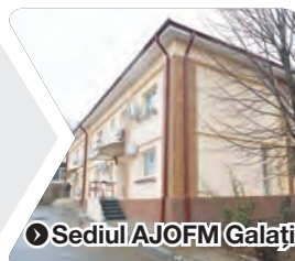
● Sediul AJOFM Galați

cuprinși în cursuri derulate în 2018. Până la data de 31 decembrie 2018, cursurile au fost absolvite de 552 de șomeri, iar alți 56 au abandonat, la 10 dintre aceștia abandonul înregistrându-se din motive imputabile lor, precizează bilanțul realizat de AJOFM Galați. ● C.L.