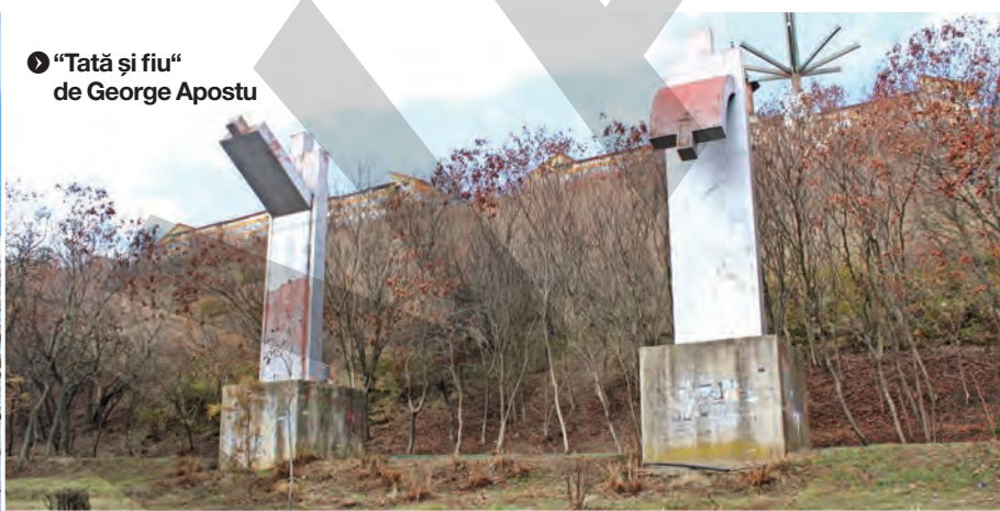
● “Tată și fiu” de George Apostu