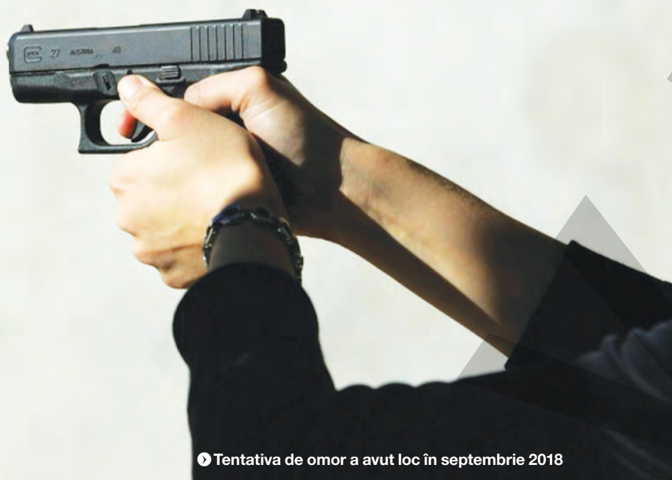
▶ Tentativa de omor a avut loc în septembrie 2018

DUPĂ CE AU ÎMPUȘCAT UN OM ÎN PLINĂ STRADĂ ● ANCHETĂ