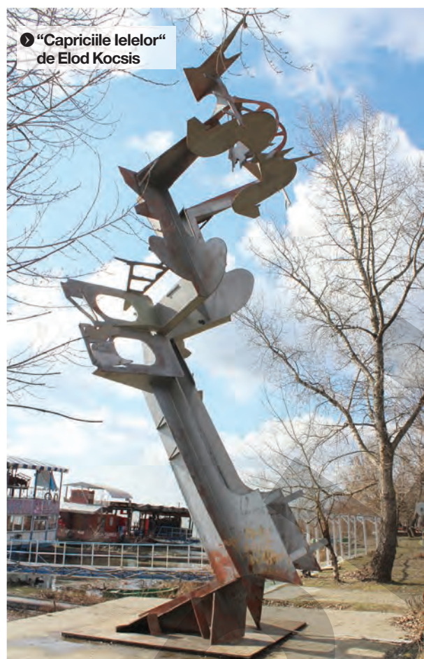
● “Capriciile lelelor” de Elod Kocsis

Din același circuit al vieții, face parte și “Spațiul de joacă vegetal”, realizat de Tiberiu Bențe, ca o continuare a poveștii unui cuplu trainic, ai cărui copii să se poată bucura de mișcare în aer liber și de natură. Din păcate, locul de joacă special amenajat pentru ei, în prezent devastat, reflectă situația