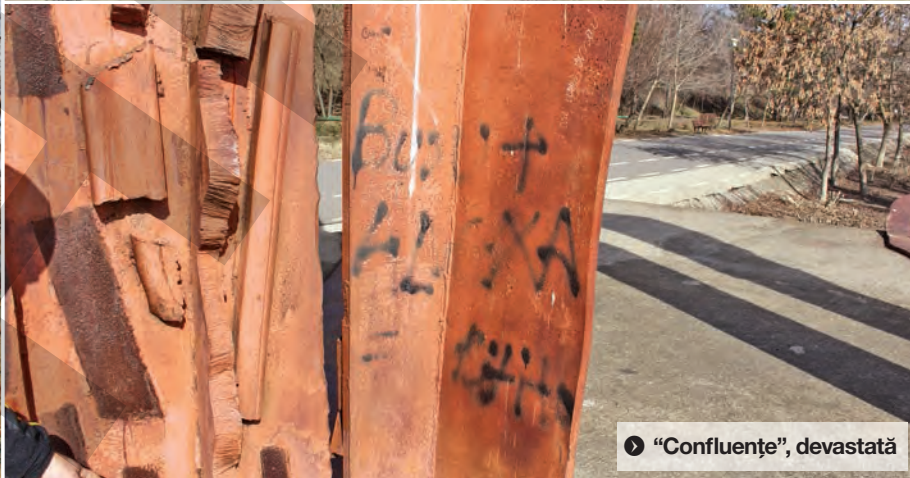
● “Confluente”, devastată

metalice, ce se ascunde dincolo de graffiti, rugină, mușcări și nepăsare. Un vandalism născut din lipsa de respect a cetățeanului și încurajat de înrădăcinarea unor lacune în sistemul de conducere.