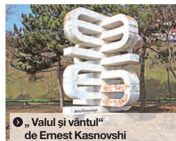
● “Valul și vântul” de Ernest Kasnovaschi

VANDALISM. Situația monumentelor de for public este un subiect care ar trebui să ne intereseze pe toți. Conservarea și punerea lor în valoare este o sarcină care stă și în mâinile cetățeanului de rând, evident, sub coordonarea și supravegherea celor abilitați. Ca să vedem cine este responsabil cu întreținerea și restaurarea lor, ne-am adresat Biroului de Presă al Primăriei Galați. Din răspunsul lor, aflăm că operațiunile sunt făcute de Ecosal, la comanda Primăriei. “Serviciile de întreținere a monumentelor de for public sunt executate de Serviciul Public Ecosal. Comenzile în sensul acesta sunt date de Direcția Generală Servicii Comunitare de Utilități Publice din cadrul Primăriei municipiului Galați. Anul trecut au avut loc o serie de intervenții pentru reabilitarea unor amplasamente - cele din Cimitirul „Eternitatea”, acestea fiind mai expuse având în vedere celebrarea Anului Centenar. Intervenții pentru curățare și întreținere se fac periodic asupra tuturor monumentelor de for public din oraș. O evaluare recentă realizată de specialiștii din cadrul Primăriei arată că numai curățarea suprafețelor (aproximativ 372 mp) de inscripțiile tip graffiti se ridică la un cost de aproape 34.000 de lei. Cu această ocazie lansăm un apel către cetățenii municipiului să ne fie aproape în demersul acesta, sesizând Poliția Locală atunci când sunt martorii unor acte de vandalism.” ● E.G.