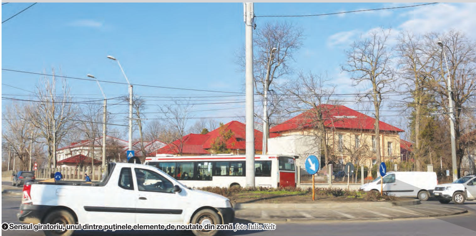
➤ Sensul giratoriu, unul dintre puținele elemente de noutate din zonă, foto Iulia Kelt

INTRAREA ÎN ORAȘ DINSPRE VÂNĂTORI ● REPORTAJ