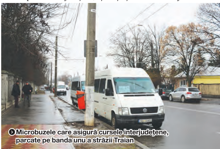
➤ Microbuzele care asigură cursele interjudețene, parcate pe banda unui a străzii Traian

Nici parcare, nici sensul giratoriu amenajat în zonă nu înfrumusețează locul, așa că localnicii așteaptă, cât mai repede, investiții și schimbări majore. ●