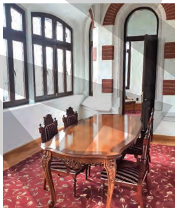
● Balconul din zona regală a Palatului