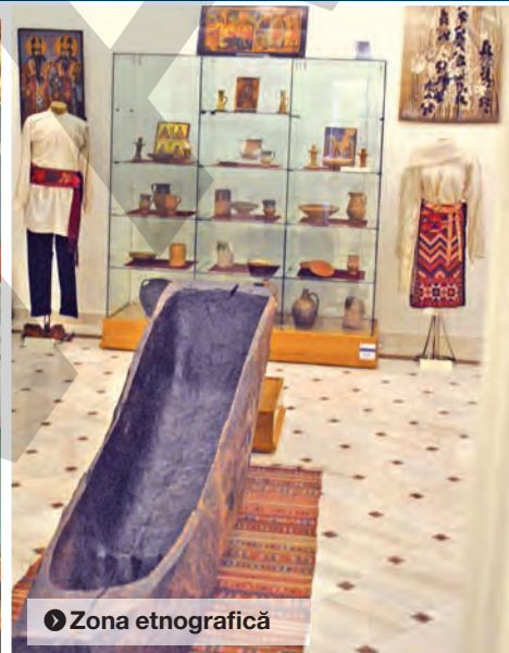
► Zona etnografică

Dovezile bogăției spirituale ale creștinismului și ulterior ale ortodoxiei în spațiul Dunării de Jos sunt concrete, palpabile și bine puse în valoare, în cadrul sălilor ce prezintă istoria creștinismului din cele mai vechi timpuri și până în secolul XX. În primele săli ale expoziției, regăsim ceramică geto-dacică, romană și bizantină descoperită în siturile arheologice din arealul Dunării de Jos, completată de imaginea mormântului primului creștin de pe teritoriul țării noastre - Innocens. Excursia tematică este continuată cu prezentarea Mitropoliei Proilaviei, a obiectelor care au aparținut lăcașului de cult, extrase după Registrul de recensământ al orașului Brăila din anul 1570 și alte obiecte specifice epocii.