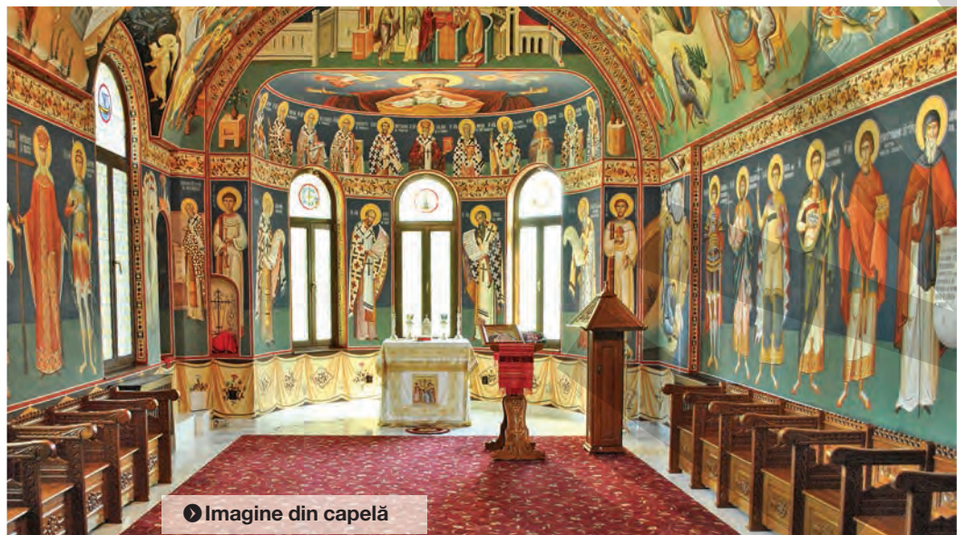
► Imagine din capelă