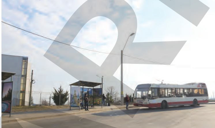
➤ Noua stație de autobuz, floarea care vrea să aducă primăvara