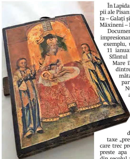
► Icoană în curs de restaurare

În Lapidariu se pot admira copiii ale Pisaniilor Bisericii Precista - Galați și Bisericii Mănăstirii Măxineni - Brăila.