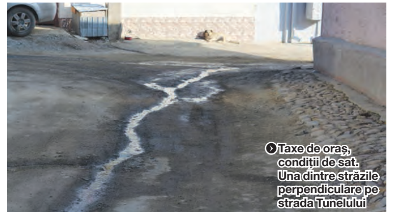
► Taxe de oraș, condiții de sat. Una dintre străzile perpendiculare pe strada Tunelului