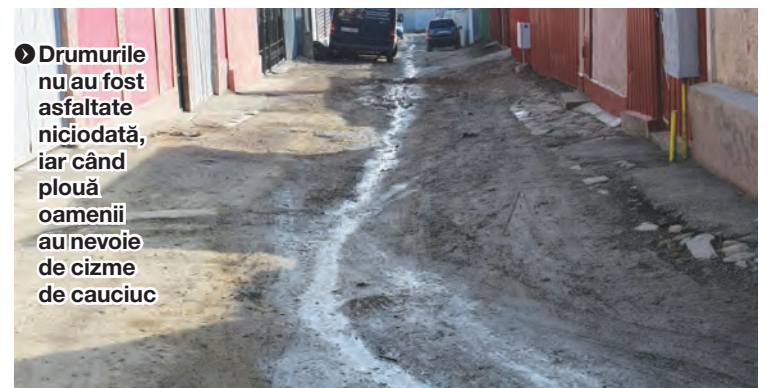
► Drumurile nu au fost asfaltate niciodată, iar când plouă oamenii au nevoie de cizme de cauciuc

fost amenajate drumuri și au și fost asfaltate, circulația se desfășoară cu foarte mare dificultate. Și asta din cauza faptului că strada este extrem de îngustă, având loc doar o mașină mică. De o autoutilitară sau, și mai grav, de o autospecială de pompieri nici nu poate fi vorba, acestea neavând spațiu de manevră. Așadar, în caz de incendiu la vreuna dintre vilele construite pe o astfel de alee, că strada nu poate fi numită, intervenția salvatorilor se