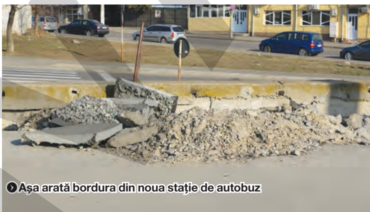
➤ Așa arată bordura din noua stație de autobuz

Zona Bariera Traian a fost cândva în atenția autorităților locale, care au decis să desființeze toate chioșcurile construite pe trotuare și să facă astfel loc unei parcuri noi și frumoase. Chioșcurile au fost puse la pământ, iar parcare a fost amenajată. Parcare a devenit însă stație de autobuz pentru mijloacele de transport ale Transurb și loc de așteptat pentru zeci de taxiuri. Câteva mașini, puține ce-i drept, și-au găsit și ele locul în noua așezare, la umbra noilor chioșcuri care au răsărit ca ciupercile după ploaie. Lucrările au