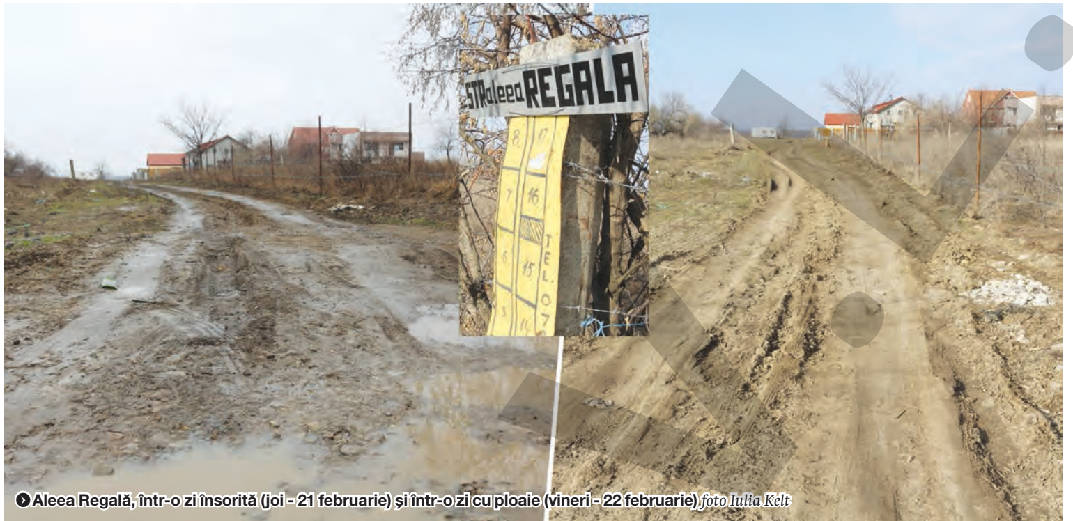
► Aleea Regală, într-o zi însorită (joi - 21 februarie) și într-o zi cu ploaie (vineri - 22 februarie)