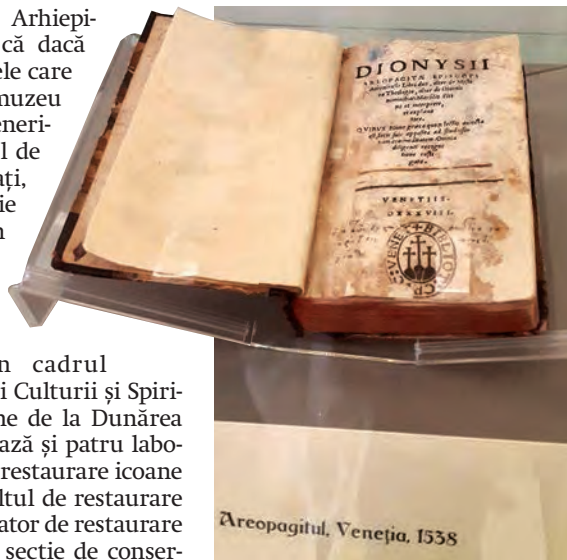
Areopagitul, Veneția, 1538

promotor al unității românești” (un pictor din Transilvania, de la început de secol XIX) și acolo am avut câteva proiecte de-ale lui, niște pânze de dimensiuni impresionante, de 5 metri înălțime cu 3 metri lățime, de 10 metri lățime cu 6 metri înălțime, pânze care ar fi greu de expus într-o sală mică, iar în Galați a fost singura sală care se preta la așa ceva. Ne-a bucurat că, timp de aproape două luni de zile, a fost vizitată de vreo 20.000 de oameni”. ●