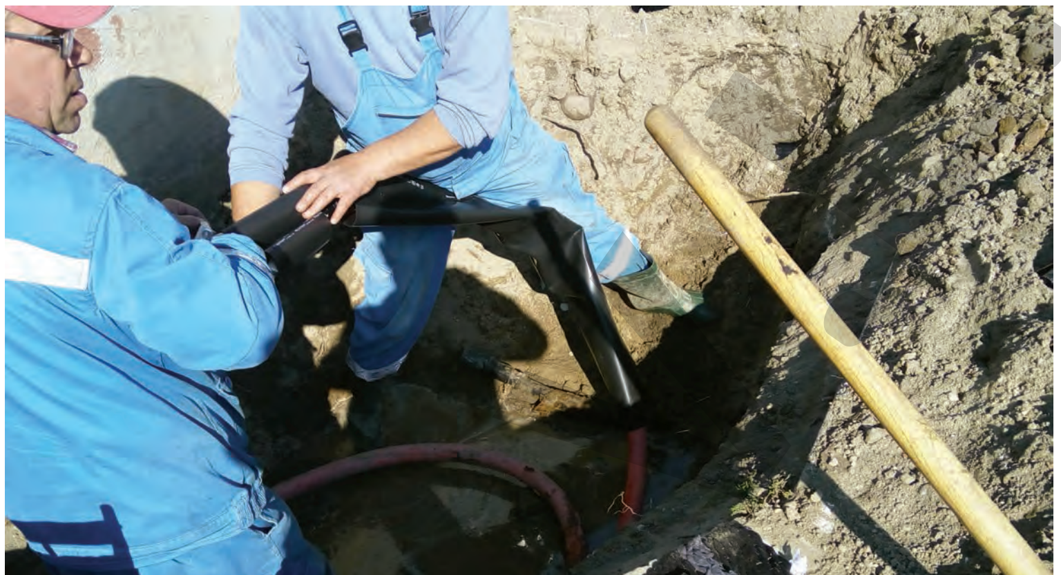
● Imagine de la o intervenție în zona Port

DE CÂTE ORI AM RĂMAS FĂRĂ LUMINĂ ÎN 2018 ● BILANȚ