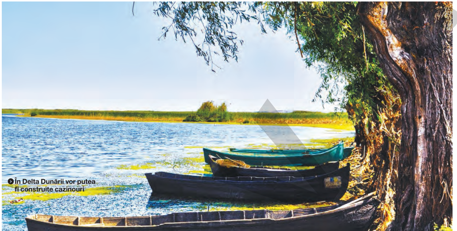
● În Delta Dunării vor putea fi construite cazinouri

doi penitenciare românești, oferta fiind refuzată. Avocatul lui Konstantinos Passaris a declarat că în cazul acestuia au fost încălcate drepturile omului în perioadele de detenție de la Penitenciarele Jilava și Craiova. ● T.M.