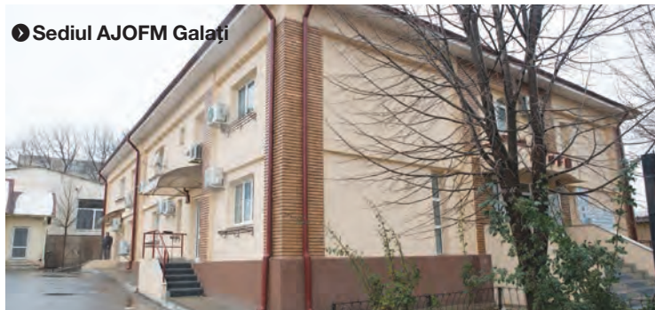
● Sediul AJOFM Galați

339 de persoane, dintre care 137 de femei, și-au găsit un loc de muncă cu sprijinul Agenției Județene pentru Ocuparea Forței de Muncă Galați, în cursul lunii ianuarie, anunță un comunicat al instituției. 196 dintre aceste persoane au vârsta de peste 45 de ani, 54 sunt între 35 și 45 de ani, 47 au între 25 și 35 de ani, iar 42 sunt tineri sub 25 de ani. În funcție de rezidență, 232 de persoane provin din mediul urban, iar 107 sunt din mediul rural. Din punct de vedere al nivelului