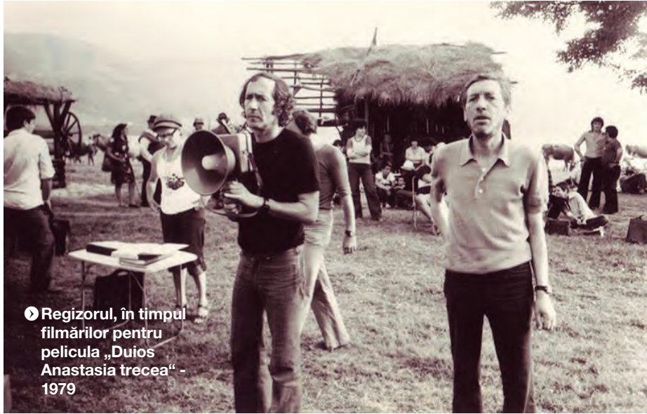
● Regizorul, în timpul filmărilor pentru pelicula „Duios Anastasia trecea” - 1979