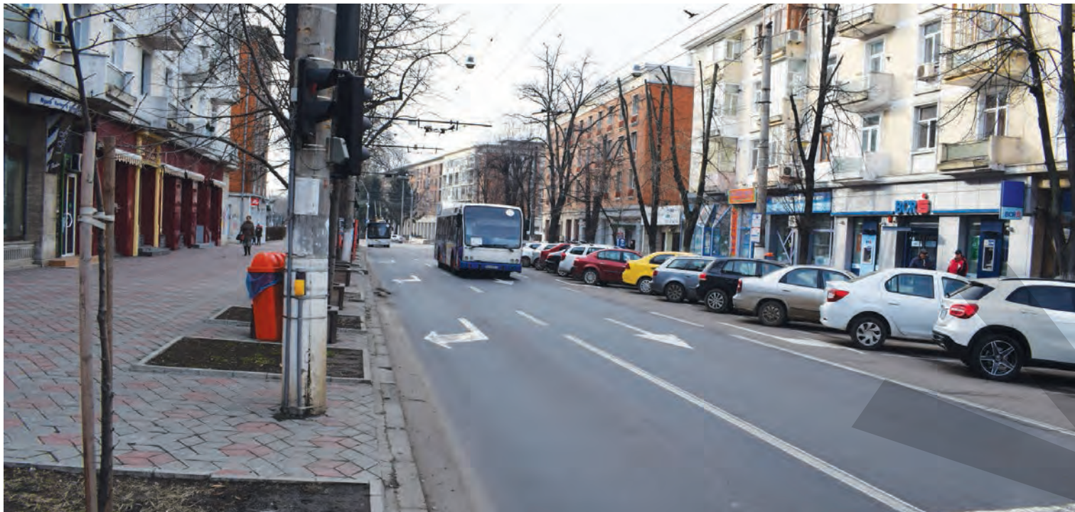
● Traficul va fi dat peste cap între orele 9,00 și 15,00

RESTRICȚII DE CIRCULAȚIE ȘI TRASEE DEVIATE ● ANUNȚ