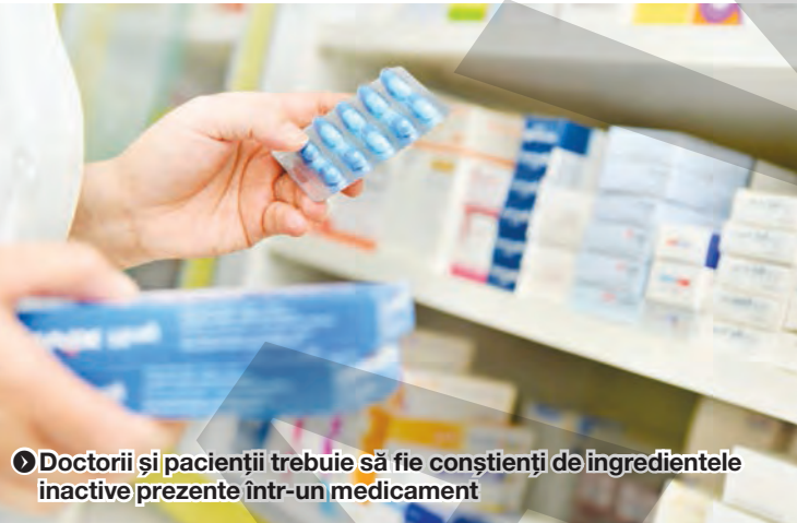
● Doctorii și pacienții trebuie să fie conștienți de ingredientele inactivate prezente într-un medicament

„O pastilă conține mai mult decât medicamentul“, a spus Traverso. Pentru acest studiu, specialistul și colegii săi au analizat ingredientele inactivate prezente în peste 42.000 de medicamente. Aceste pastile și capsule conțineau aproape 360.000 de ingrediente inactivate. Au fost identificate 38 de ingrediente inactivate ce pot provoca reacții alergice în urma ingerării. Ingredientele inactivate pot provoca reacții alergice precum urticarie, probleme respiratorii sau simptome gastrointestinale, a concluzionat Traverso. ●