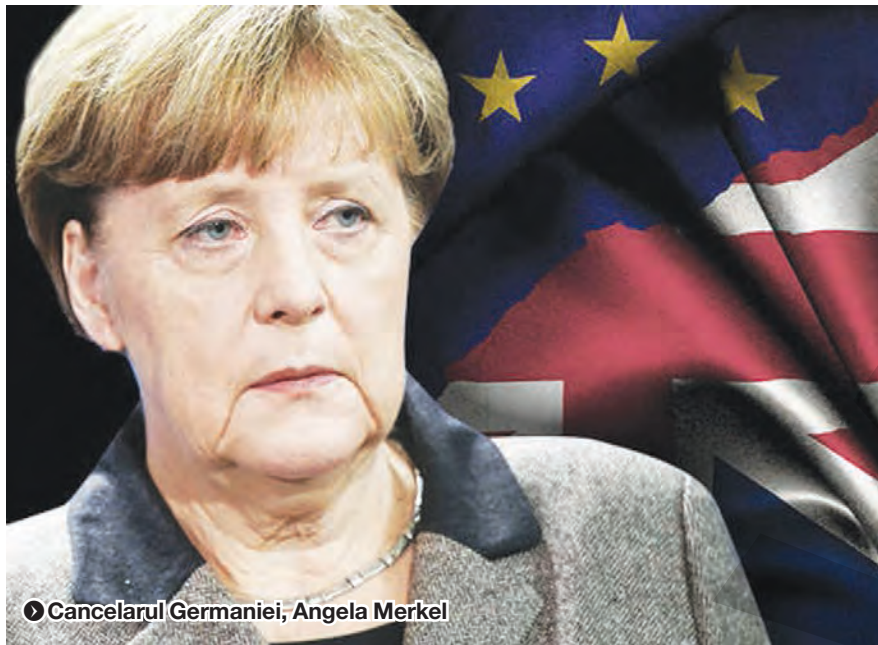
Cancelarul Germaniei, Angela Merkel

au fost uciși. Al-Muhajir a spus că atentatul din Noua Zeelandă, pe care l-a descris drept „războiul cruciaților” împotriva musulmanilor, ar reprezenta o extensie a luptei împotriva rețelei teroriste Stat Islamic și a acuzat statele occidentale că au vărsat „lacrimi de crocodil pentru victimele” atacului. ● C.L.