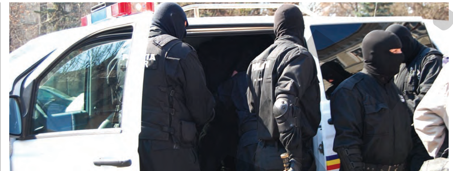
● Oamenii legii au vizat mai multe adrese din București, Ilfov și Prahova

PERCHEZIȚII ÎN MAI MULTE JUDEȚE DIN ȚARĂ ● DOSAR