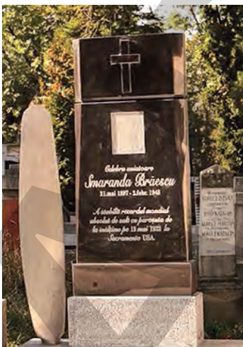
● Monument ridicat în cimitirul din Cluj-Napoca în memoria Smarandei Brăescu

PREMIERĂ. În aprilie 1936, Smaranda Brăescu a traversat la bordul avionului său personal Munții Iugoslaviei, o zonă aeriană cunoscută ca fiind extrem de periculoasă. Apoi, a făcut un raid de 1.100 de kilometri, în linie dreaptă, deasupra Mării Mediterane, de la Roma la Tripoli (capitala Libiei), în premieră mondială. A zburat șase ore și zece minute până la Sorman (localitate aflată la 65 de kilometri de Tripoli), unde a fost nevoită să aterizeze forțat. De la Tripoli s-a îndreptat spre Atena și de acolo, survolând Bulgaria, a aterizat la București. Fiind căutată de comuniști pentru a fi arestată, Smaranda Brăescu s-a ascuns un timp în via fratelui său geamăn, în casa preotului greco-catolic Anton Pet, din Răchiteni, județul Iași și la Butea, conform Wikipedia. Fiind grav bolnavă, a fost operată, sub numele de Maria Matei, iar la sfârșitul anului 1947 se afla la ferma Congregației Maicii Domnului din Cluj, purtând numele de Maria Popescu. A murit în Clinica Universitară a celebrului medic Iuliu Hațieganu. În prezent, o stradă din București a fost denumită în memoria sa. ● R.B.