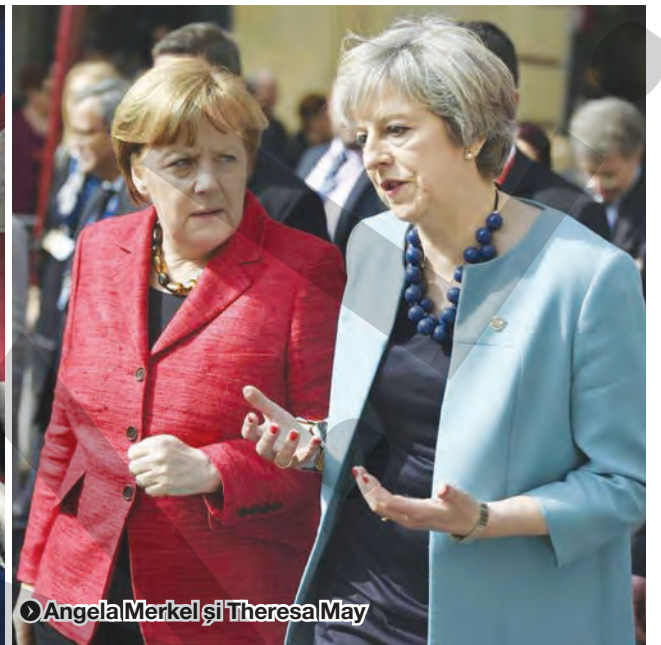
Angela Merkel și Theresa May