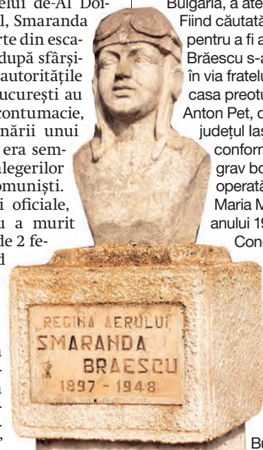
● Bustul din comuna Buciumeni