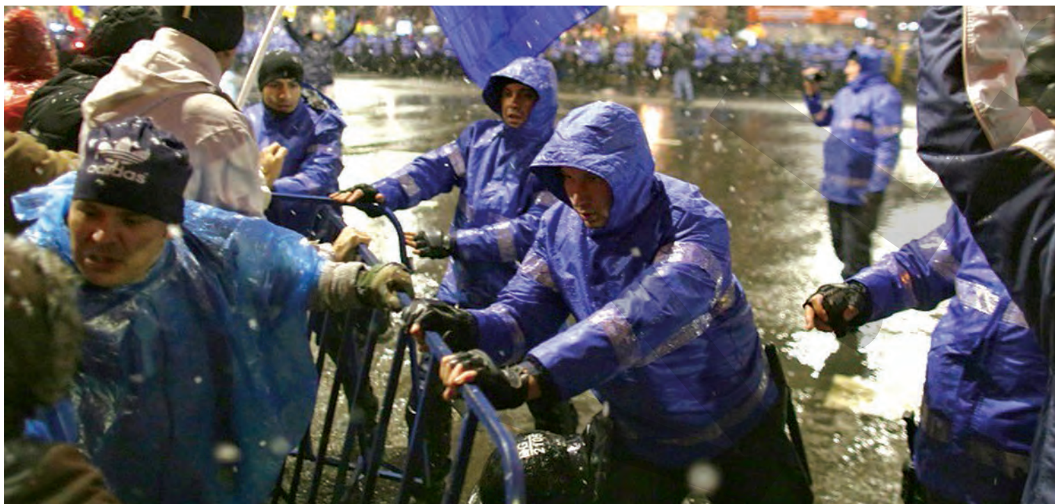
● La protestul din 10 august 2018 din Piața Victoriei, la care au participat mii de oameni, au avut loc mai multe violențe

CU PRIVIRE LA PROTESTELE DIN 10 AUGUST 2018 ● ANCHETĂ