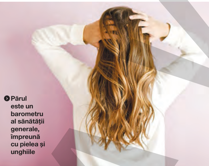
► Părul este un barometru al sănătății generale, împreună cu pielea și unghiile

Vitaminele care ajută la creșterea părului pot veni și din suplimente alimentare. Acestea se iau în timpul mesei și constau într-un complex de vitamine concentrate și minerale, de două ori pe zi, dimineața și seara. Este vorba despre vitaminele B1, B2, B3, B5, B6, B12, biotină, colină, acid folic, vitamina C, vitamina D, vitamina E, bor, calciu, magneziu, mangan, seleniu, vanadiu și zinc. Complexul de vitamini