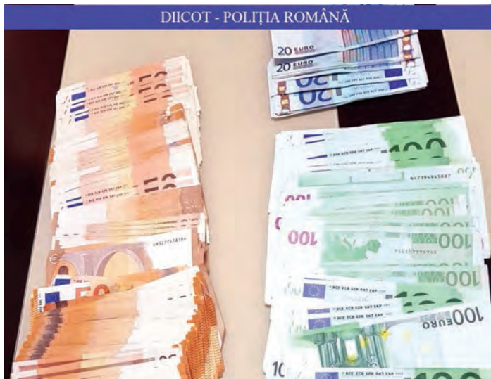
● 50.000 de lei și 24.700 de euro, puse sub scheștru de procurori