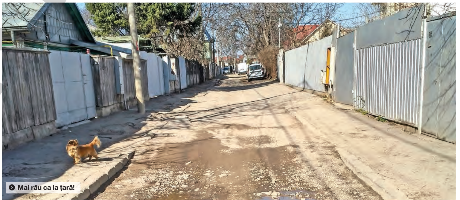
► Mai rău ca la țară!

„SC Romlotus Instalații a solicitat încetarea contractului de lucrări încheiat cu Primăria Galați datorită intrării în insolvență a firmei. Contractul a fost reziliat în data de 30 martie 2016, pentru întârzieri în execuție s-au aplicat penalități conform clauzelor contractuale în valoare de 2.518 lei”, ne explica, ulterior Primăria Galați. Nu putem să nu remarcăm faptul că rezilierea contractului s-a făcut cu două săptămâni înainte de data la care, conform planoului de șantier, lucrarea trebuia să fie gata! Progresul lucrărilor era de 12 la sută, potrivit municipalității, firma realizând următoarele operațiuni: desfacere carosabil - 240 ml, colector canalizare - 228 ml, conductă apă - 240 ml. „Pentru lucrările executate de SC Romlotus Instalații a fost decontată suma de 469.600 de lei. Valoarea lucrărilor rămase de executat pentru modernizare este de 3.468.104 lei”, ne comunica, la solicitarea noastră, Primăria Galați. »