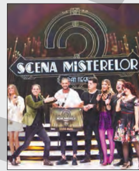
divertisment cu Dan Negru