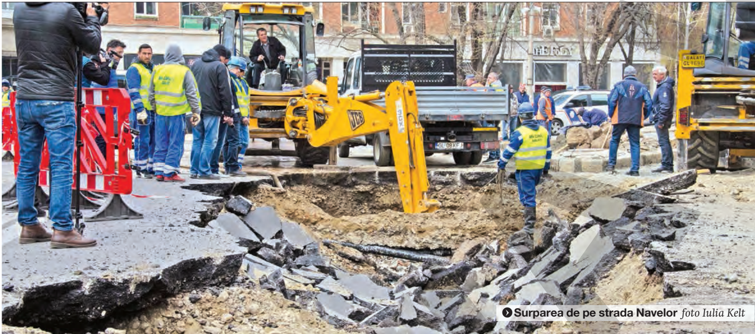
● Surparea de pe strada Navelor