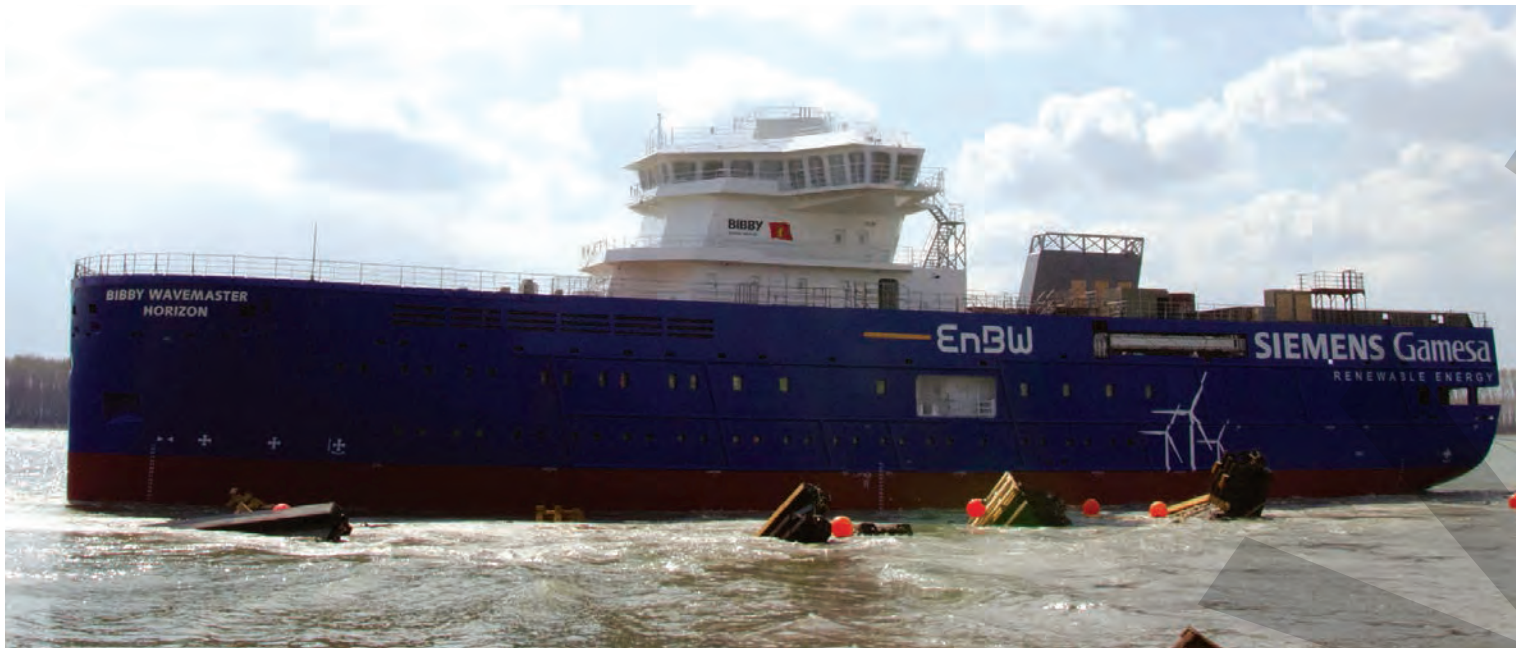
● Nava AccommodationSupplyVessel (ASV) a fost lansată la apă

LANSARE LA ȘANTIERUL NAVAL DAMEN ● COLABORARE