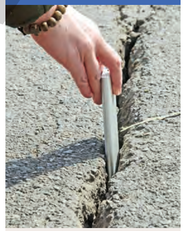
● Fisura care crește pe strada Brăilei