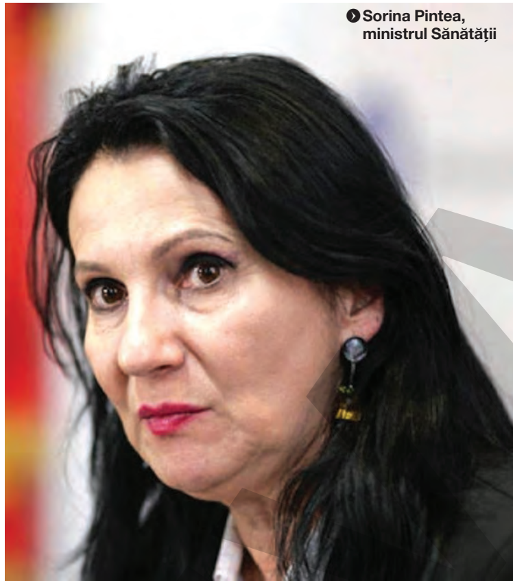
◆ Sorina Pinte, ministrul Sănătății

Ministrul a anunțat că a fost reluat programul Băncii Mondiale, care era blocat, în privința echipamentelor de radioterapie. „Și mâine (miercuri - n.r.) vom deschide oficial și vor avea acces și pacienții la primul centru fi-