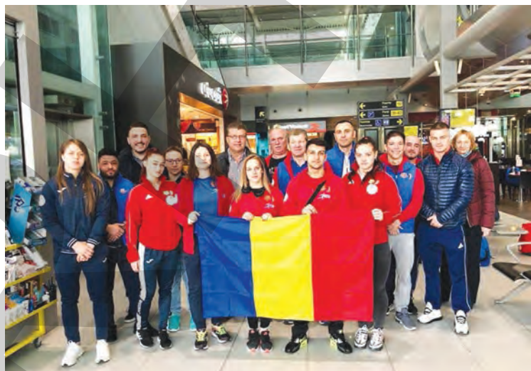
● Delegația României care va participa la „Europele” de la Batumi (Georgia)

După succesul de la „Europele” de seniori de anul trecut, cu 26 de medalii, delegația României speră să obțină rezultate bune și la actuala ediție, ce se va desfășura în perioada 6-13 aprilie, competiție ce contează pentru calificarea la Jocurile Olimpice de la Tokyo din 2020. „Anul trecut la Izvorani am obținut un număr record de medalii, 26. Acum va fi altceva și nu doar pentru că nu vom mai organiza noi, însă această ediție a Europeleor contează pentru calificarea la Jocurile Olimpice. O să fie o abundență de sportivi la Batumi, pentru că s-a schimbat regulamentul și calificarea la Jocuri este individuală. Așa că toată lumea vrea să obțină cât mai multe puncte și să ajungă la Tokyo. Noi vom merge cu 14 sportivi, jumătate la masculin și