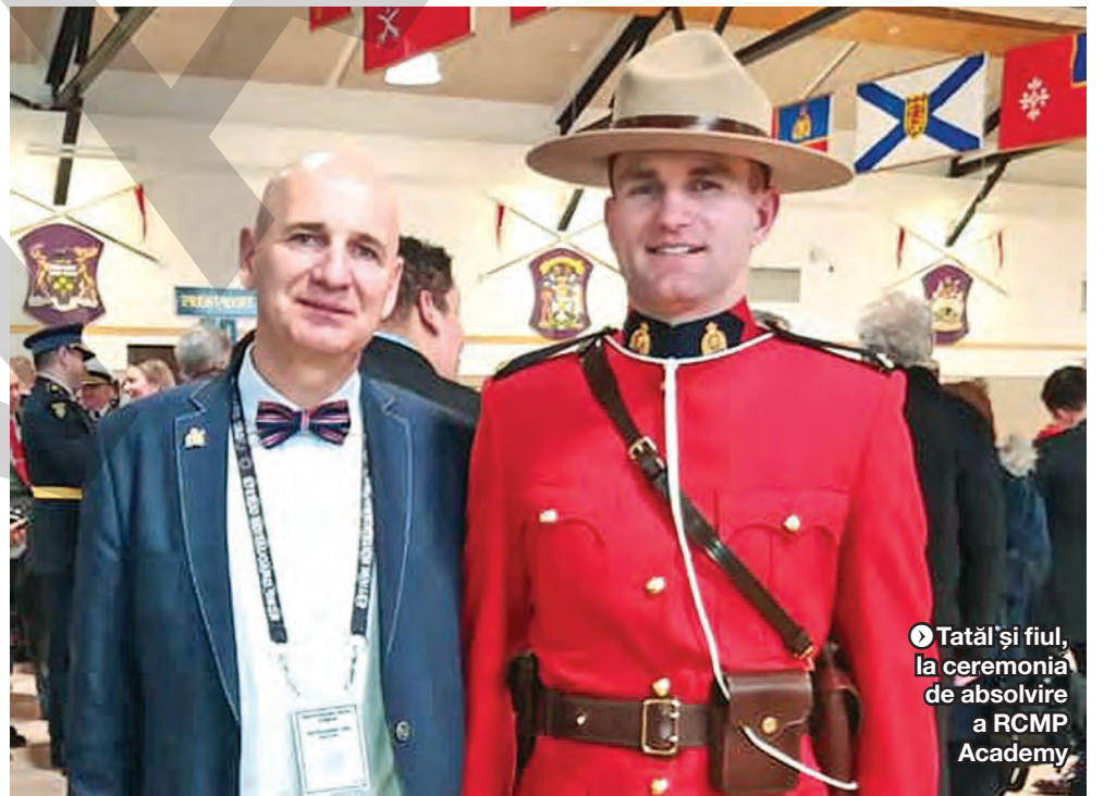
Tatăl și fiul, la ceremonia de absolvire a RCMP Academy