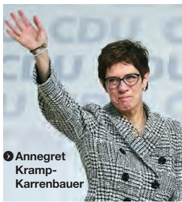
● Annegret Kramp-Karrenbauer

Annegret Kramp-Karrenbauer este favorita alegătorilor pentru preluarea postului de cancelar al Germaniei, arată un sondaj ale cărui rezultate au fost preluate luni de DPA. Circa 28 la sută din germani o preferă pe Kramp-Karrenbauer ca succesoare a celei care i-a fost mentor politic, Angela Merkel. Ei ar vota-o pe noua șefă a Uniunii Creștin-Democrate (UCD), dacă funcția de cancelar s-ar obține prin