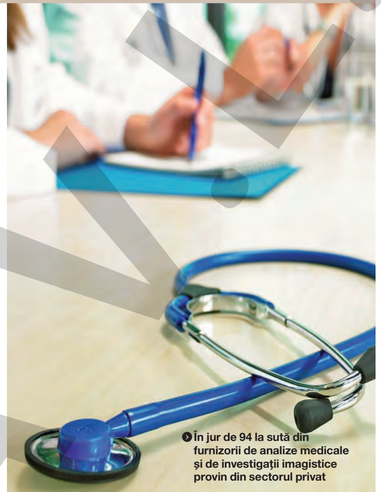
● În jur de 94 la sută din furnizorii de analize medicale și de investigații imagistice provin din sectorul privat

„Acest act normativ este o bombă socială. Dacă, până acum, un pacient cu asigurare beneficia, până pe data de 5-6 a lunii în curs, de analize decontate de CNAS, acest lucru nu se va mai întâmpla. Acel preț mic pe care îl decontează CNAS va fi dedus din suma mare pe care pacientul va fi nevoit să o plătească la privat. În aceste condiții, caracterul de asigurare socială va dispărea. Dacă acum avem o asigurare medicală discriminatorie, pentru că cel care primează este crite-