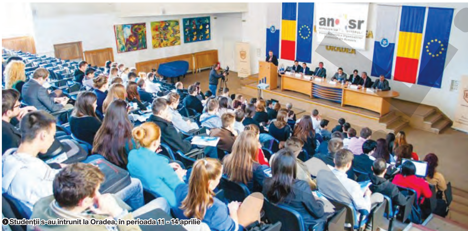
● Studenții s-au întrunit la Oradea, în perioada 11 - 14 aprilie