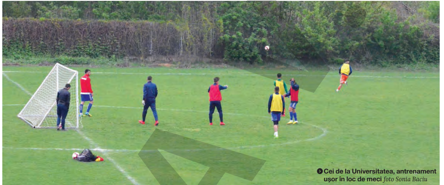
● Cei de la Universitatea, antrenament ușor în loc de meci

GHEORGHE ARSENIE gheorghe@viata-libera.ro