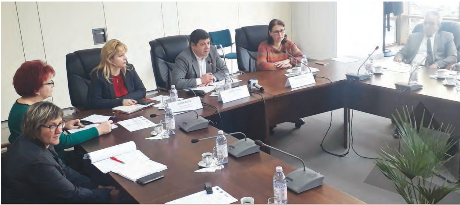
PROGRAM FINANȚAT CU FONDURI EUROPENE ● LANSARE