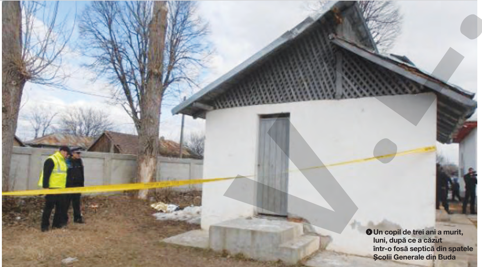
► Un copil de trei ani a murit, luni, după ce a căzut într-o fosă septică din spatele Școlii Generale din Buda