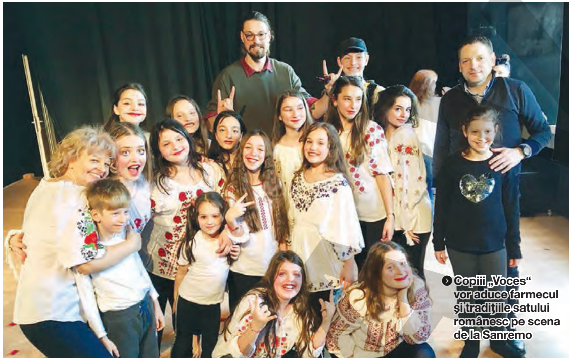
► Copiii „Voces” vor aduce farmecul și tradițiile satului românesc pe scena de la Sanremo