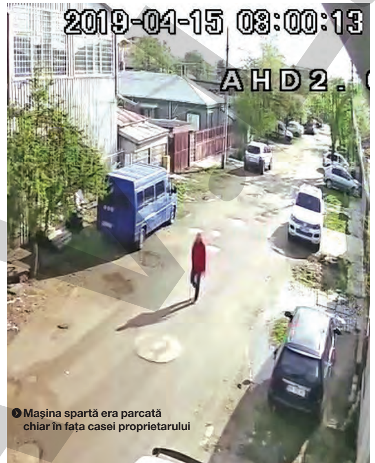
● Mașina spartă era parcată chiar în fața casei proprietarului

„În urma cercetărilor efectuate, polițiștii au stabilit că, în jurul orei 08,00, cei doi gălățeni ar fi venit în municipiul Brăila cu două autoturisme, folosind la comiterea faptei doar unul dintre acestea, pe care l-au abandonat pe raza municipiului Brăila, și și-au continuat deplasarea cu cel de-al doilea. Totodată, s-a constatat că plăcuțele de înmatriculare folosite figurează ca aparținând altor