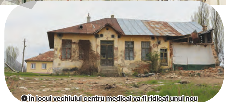
► În locul vechiului centru medical va fi ridicat unul nou