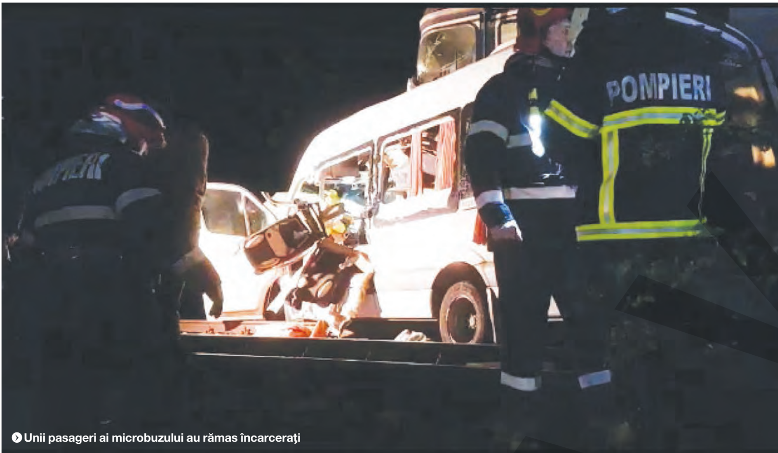
► Unii pasageri ai microbuzului au rămas încarcerati