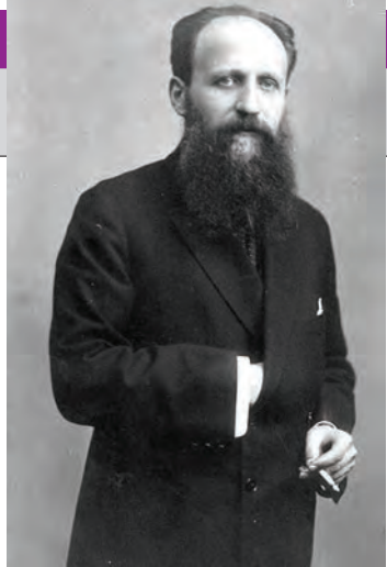
A încetat din viață la 1 aprilie 1952. ● V.G.

La 3 iunie 1938, Tzigara-Samurçaș a fost ales membru corespondent al Academiei Române.