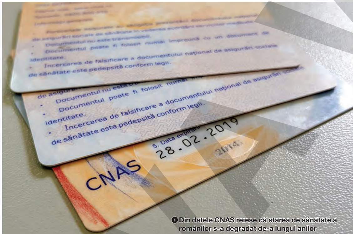
Din datele CNAS reiese că starea de sănătate a românilor s-a degradat de-a lungul anilor

În total, CNAS a avut cheltuieli de 1,9 miliarde de lei (aproximativ 400 de milioane de euro - n.r.) pentru asigurări și asistență socială în 2017 (cazuri de boală și asistență pentru familii și copii), față de 1,1 miliarde de lei în 2012, arată datele din rapoartele de activitate ale instituției.