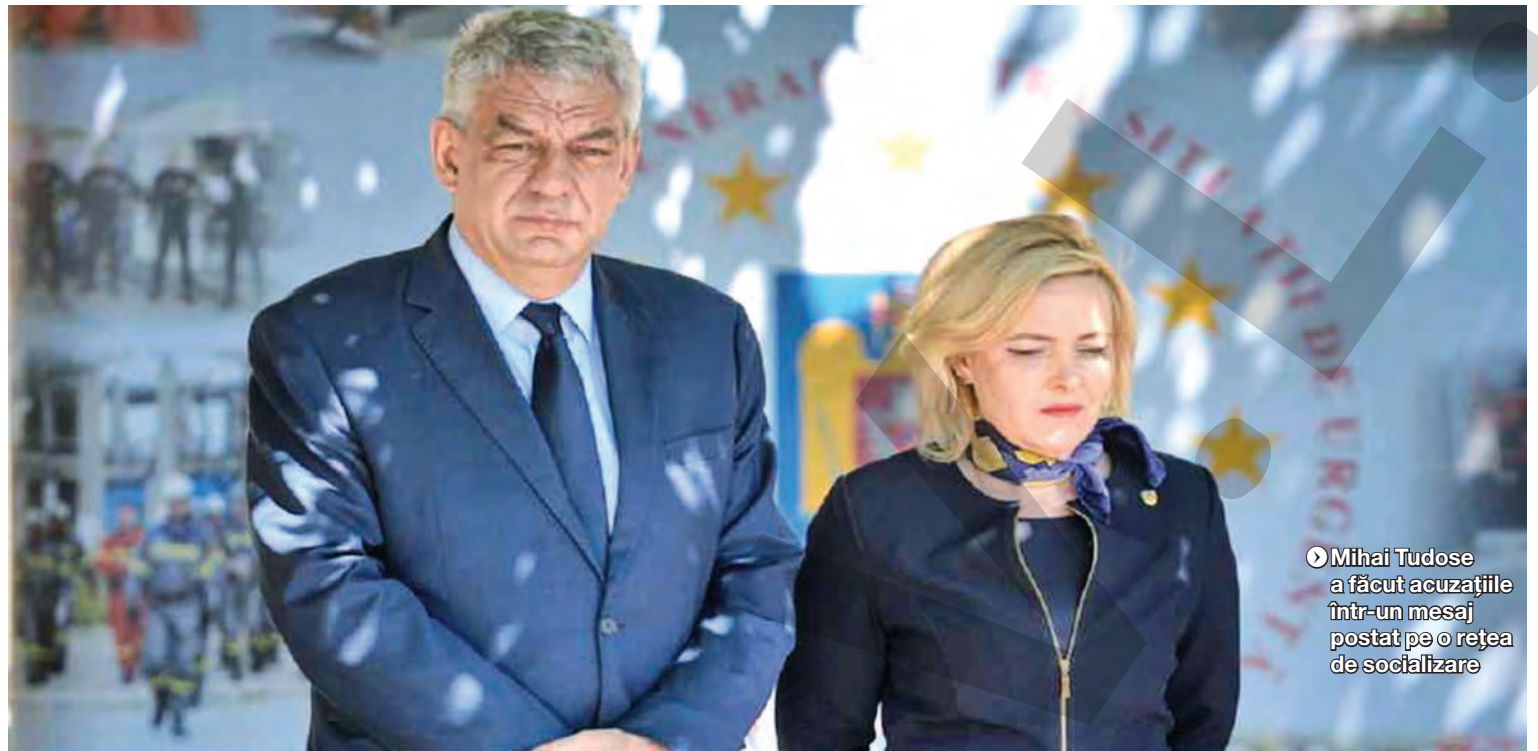
► Mihai Tudose a făcut acuzațiile într-un mesaj postat pe o rețea de socializare