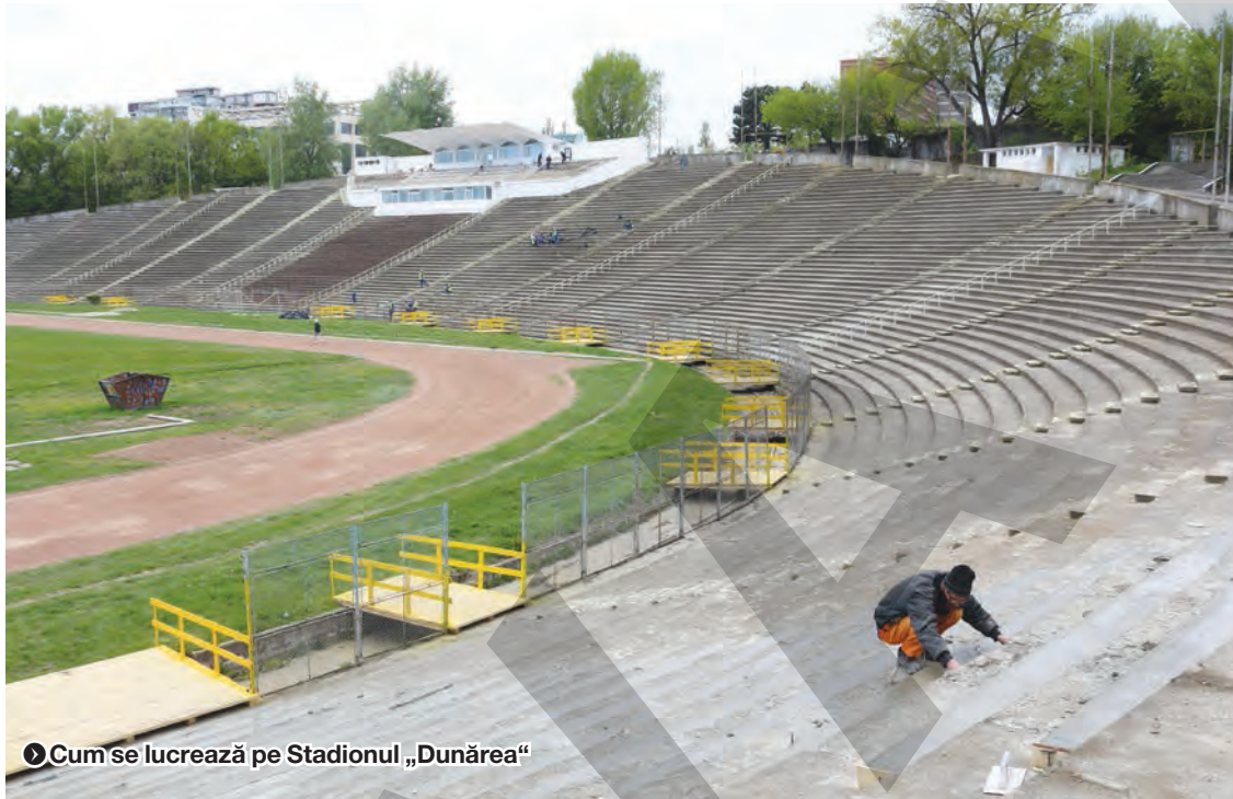
Cum se lucrează pe Stadionul „Dunărea”

„Se aprobă alocarea sumei de maximum 500.000 de lei în vederea îndeplinirii obligațiilor ce revin Județului Galați prin Consiliul Județean Galați, conform Acordului de cooperare”, se arată în proiectul de hotărâre care urmează a fi votat. Conform documentului, CJ se obligă să achiziționeze și să asigure următoarele servicii și/sau produse necesare pentru buna desfășurare a evenimentului: efecte speciale scenă (single shot, confetti metalice, jeturi CO2, mașini flăcări) și program piromuzical (cinci minute), videoanimații, versuri karaoke generatoare și combustibil pentru ele, echipă de electricieni, cablare și elemente conectivă. De asemenea, CJ se va ocupa de cazarea artiștilor și a staffului de producție, catering backstage și VIP, mese staff producție, cort backstage și amenajarea lui, închiriere ecrane LED backstage și VIP, signalistică eveniment. Tot