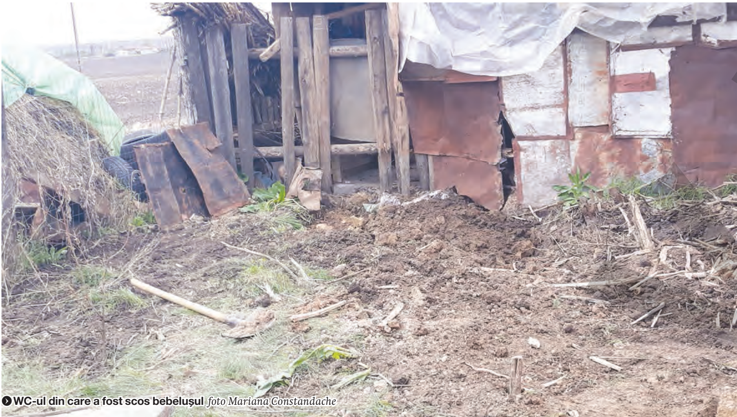
● WC-ul din care a fost scos bebelușul

INTERVENȚIE CONTRACRONOMETRU ÎNTR-UN CAZ ATROCE ● DRAMĂ