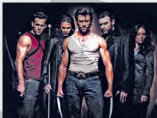
SUA, Acțiune, Fantastic