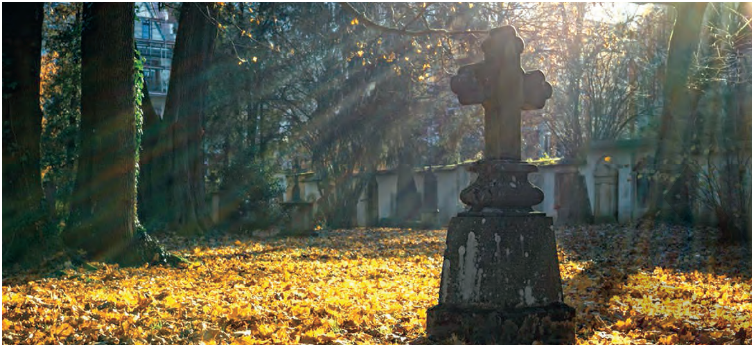
Doar anul trecut, în Galați, s-au înregistrat cu aproape 2.400 de decese mai mult decât nașteri

SPOR NATURAL NEGATIV RECORD ÎN GALAȚI ● POPULAȚIE