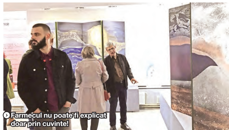
► Farmecul nu poate fi explicat doar prin cuvinte!