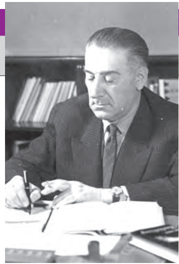
mâne. A încetat din viață la 17 august 1964. ● V.G.

ei ["Problema inconștientului", "Ipoteze și precizări în știința sufletului"], sociologiei ["Sociologia succesului"], a impus în critica literară causeria și eseul literar ["Atitudini", "Valori"], a scris note de călătorie. Cea mai importantă lucrare a sa este considerată „Explicarea omului”, o „încercare de antropologie filosofică”, în care debata principalele probleme ale civilizației umane, de la cele economice la cele artistice. La 1 noiembrie 1948, a fost ales membru titular al Academiei Ro-