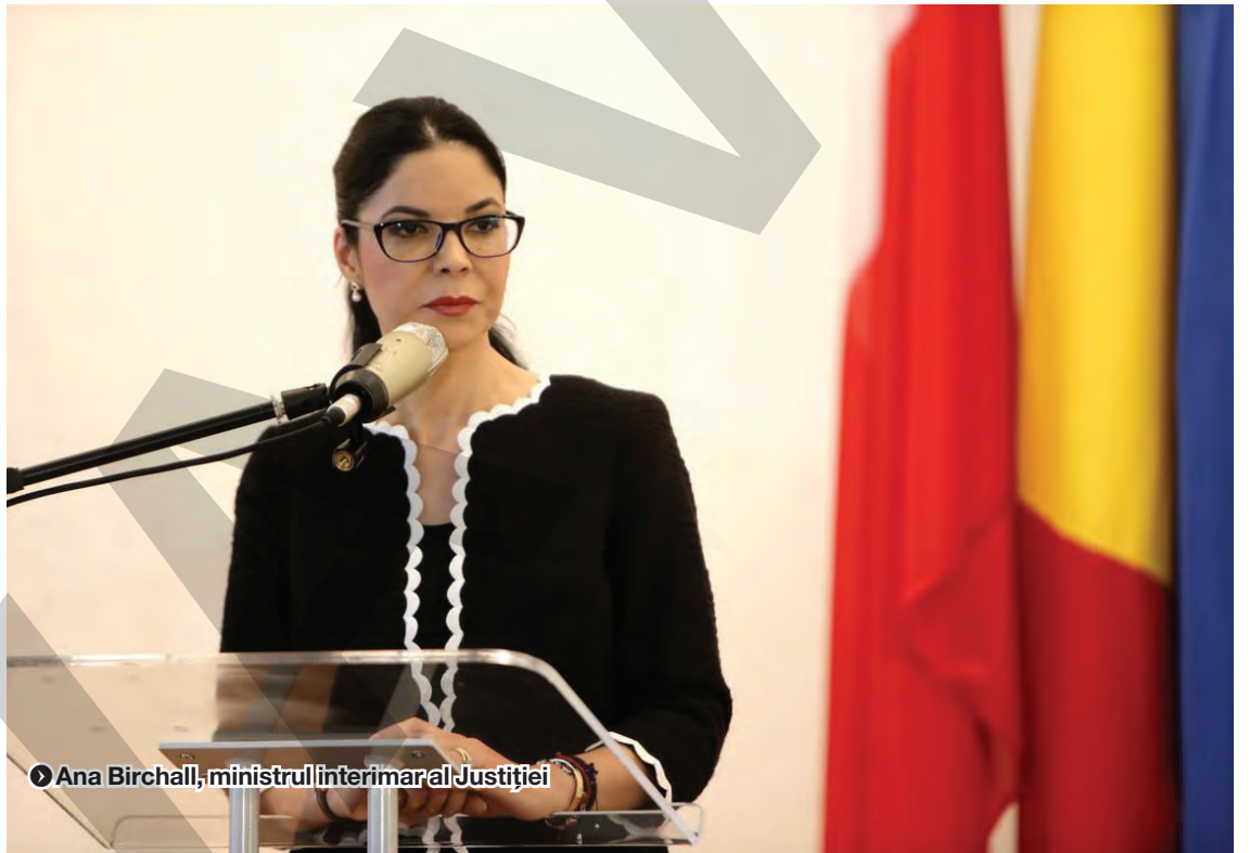
● Ana Birchall, ministrul interimar al Justiției

Prima procedură de selecție a început în 13 martie, când la conducerea Parchetului Ge-