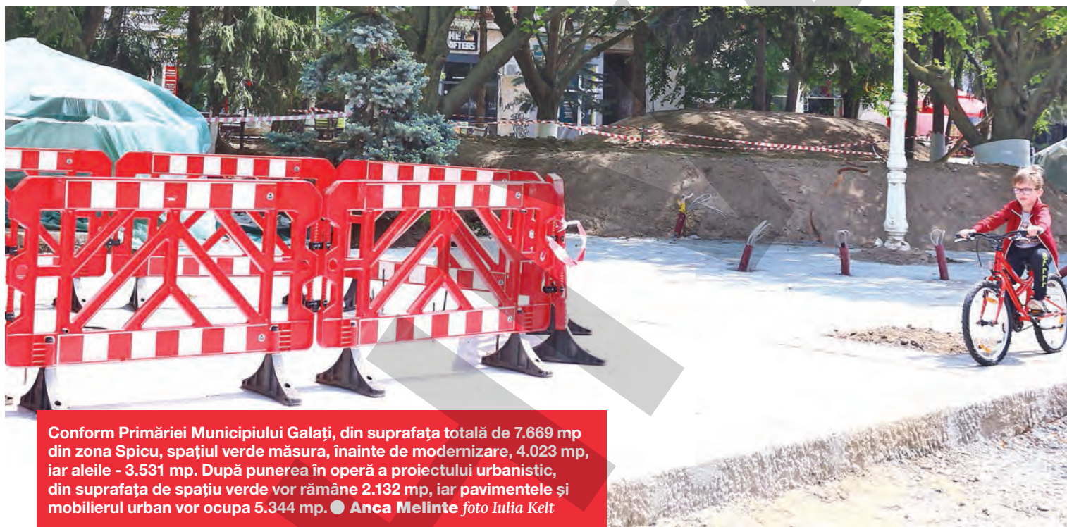
Conform Primăriei Municipiului Galați, din suprafața totală de 7.669 mp din zona Spicic, spațiul verde măsurat, înainte de modernizare, 4.023 mp, iar aleile - 3.531 mp. După punerea în operă a proiectului urbanistic, din suprafața de spațiu verde vor rămâne 2.132 mp, iar pavimentele și mobilierul urban vor ocupa 5.344 mp. ● Anca Melinte