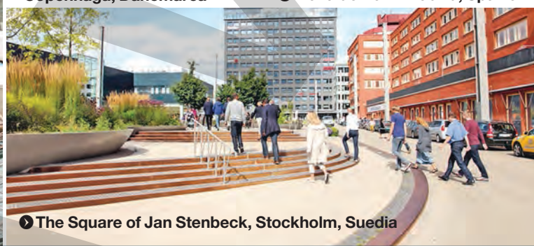
3 The Square of Jan Stenbeck, Stockholm, Suedia