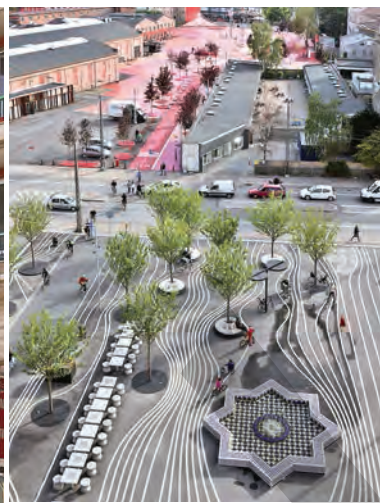
1 Norrebro Public Space, Copenhaga, Danemarca