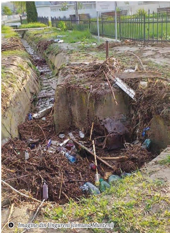
◆ Imagine din Ungureni (comuna Munteni)