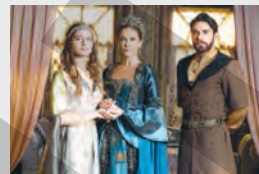
Turcia, Dramă, Istorice