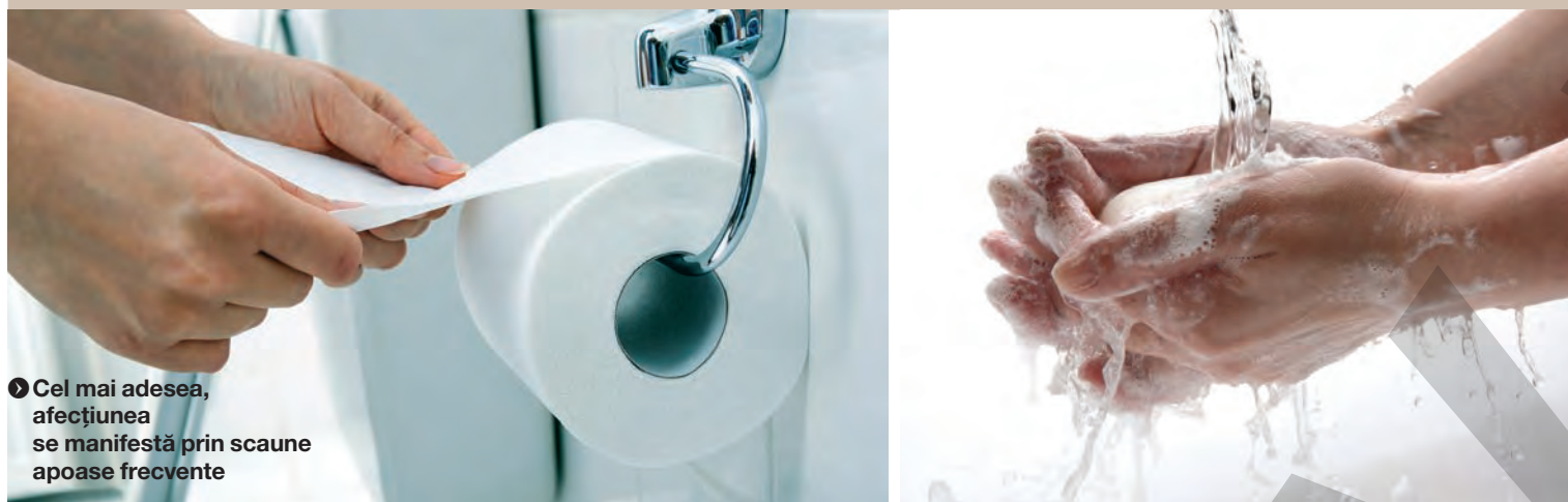
● Cel mai adesea, afecțiunea se manifestă prin scaune apoase frecvente