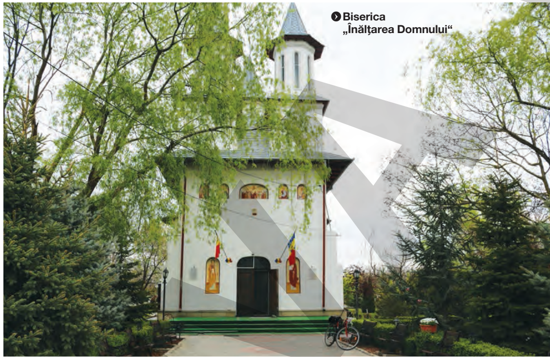
Biserica „Înălțarea Domnului”