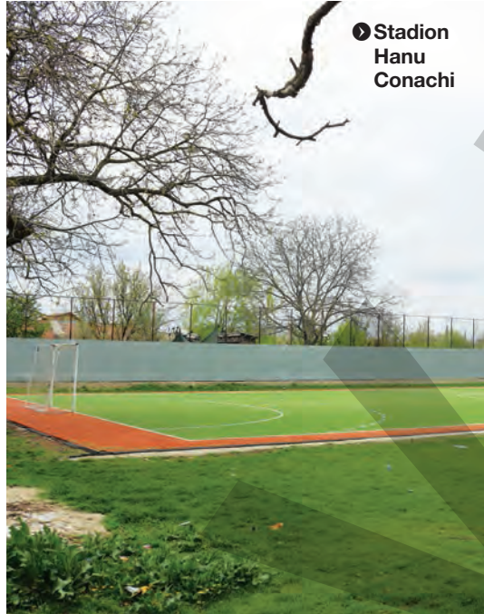
Stadion Hanu Conachi