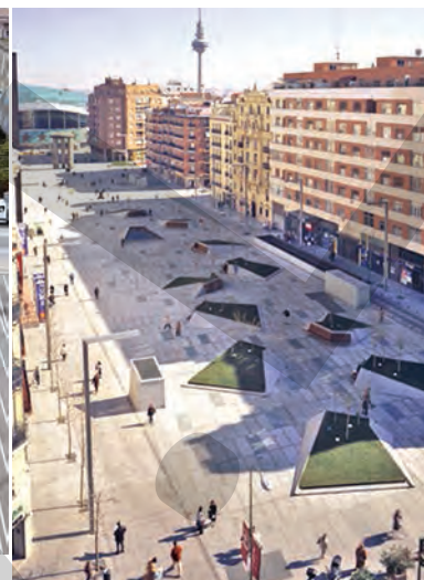
2 Plaza de Dali - Madrid, Spania