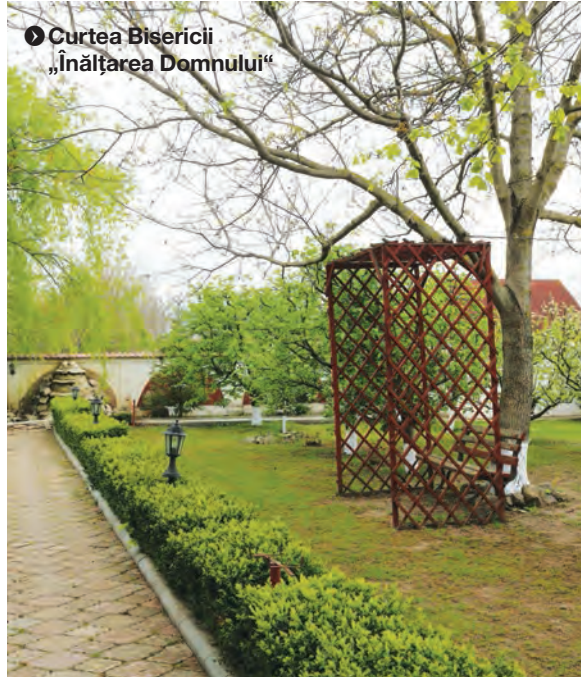
Curtea Bisericii „Înălțarea Domnului”