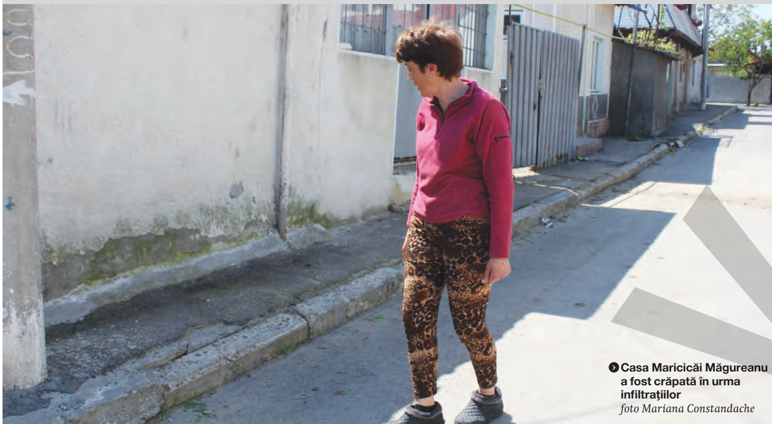
● Casa Maricicăi Măgureanu a fost crăpată în urma infiltrațiilor

MISTERUL DENIVELĂRII DE PE STRADA TUDOR VLADIMIRESCU ● CAUZE