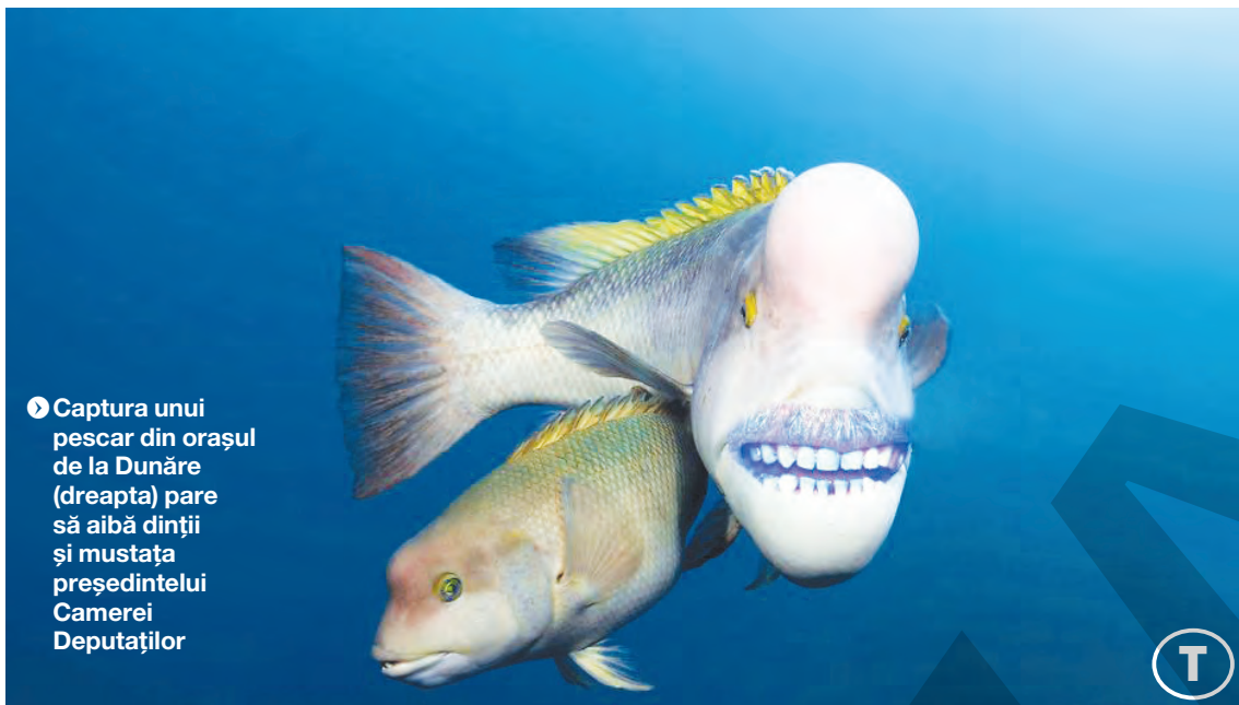
► Captura unui pescar din orașul de la Dunăre (dreapta) pare să aibă dinții și mustața președintelui Camerei Deputaților

Are maxilarul său, iar mustața pare să fie una și aceeași cu bijuteria facială a controversatului politician român. Mai mult decât atât, monstrul care seamănă izbitor de bine cu Liviu Dragnea a rămas fără libertate într-o perioadă în care pescuitul este strict interzis. Uneori, și soarta face glume proaste.