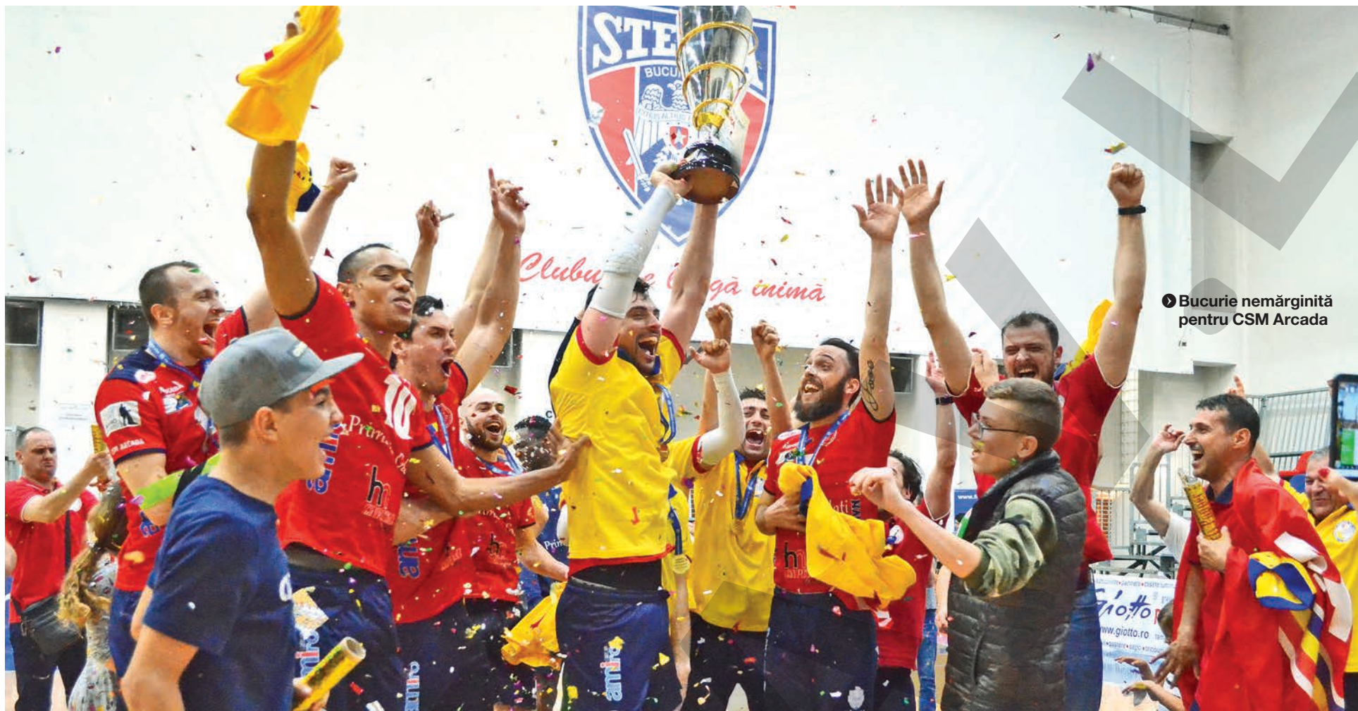
► Bucurie nemărginită pentru CSM Arcada