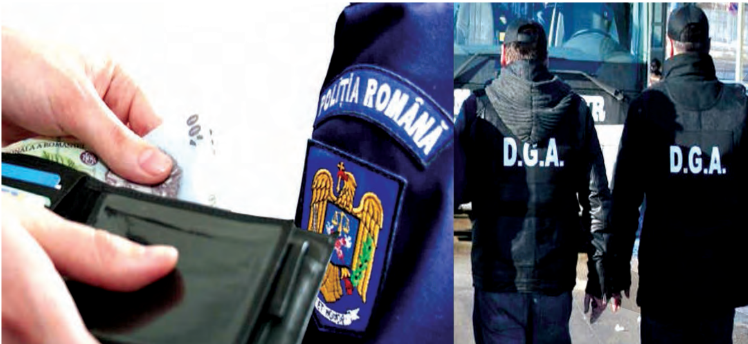
► Trei dintre polițiști vor sta după gratii, alți doi având pedepse cu suspendare

DUPĂ PATRU ANI DE LA SĂVÂRȘIREA FAPTELOR ● ANCHETĂ