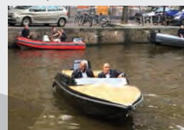
SUA, Acțiune, Comedie

07:00 Observator 10:00 Scena misterelor (R) 13:00 Observator 13:15 Printesa indaratnica 2 - Nunta SUA, Comedie 15:30 Familii la cutite (R) 19:00 Observator 20:00 Liber ca pasărea cerului România, Comedie 21:00 Hitman's Bodyguard: Care pe care SUA, Acțiune, Comedie 23:30 iUmor (R) 01:30 Printesa indaratnica 2 - Nunta (R) SUA, Comedie 03:30 Fructul oprit (R) România, Dramă 06:00 Observator