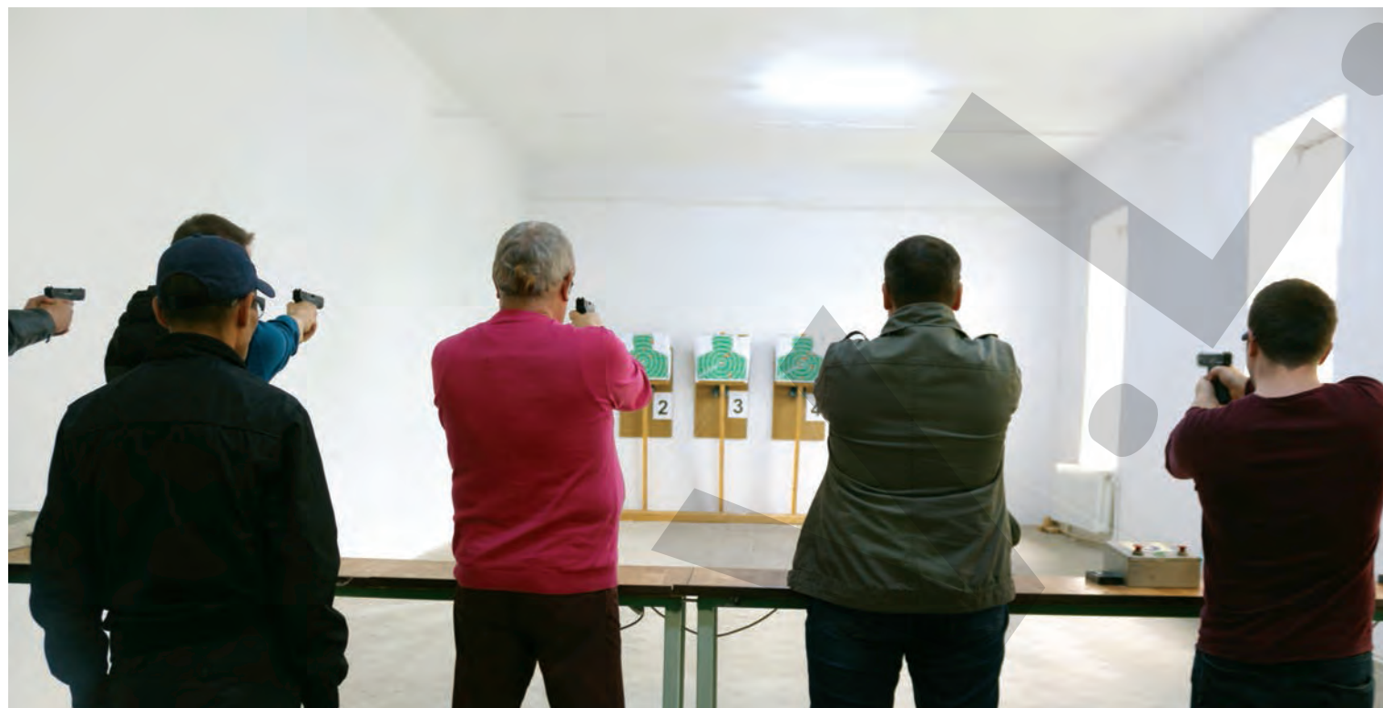
● Jurnaliștii nu au avut milă de țintele Poliției Locale

ACTIVITĂȚI ÎNAINTE DE ZIUA POLIȚIEI LOCALE ● TIR