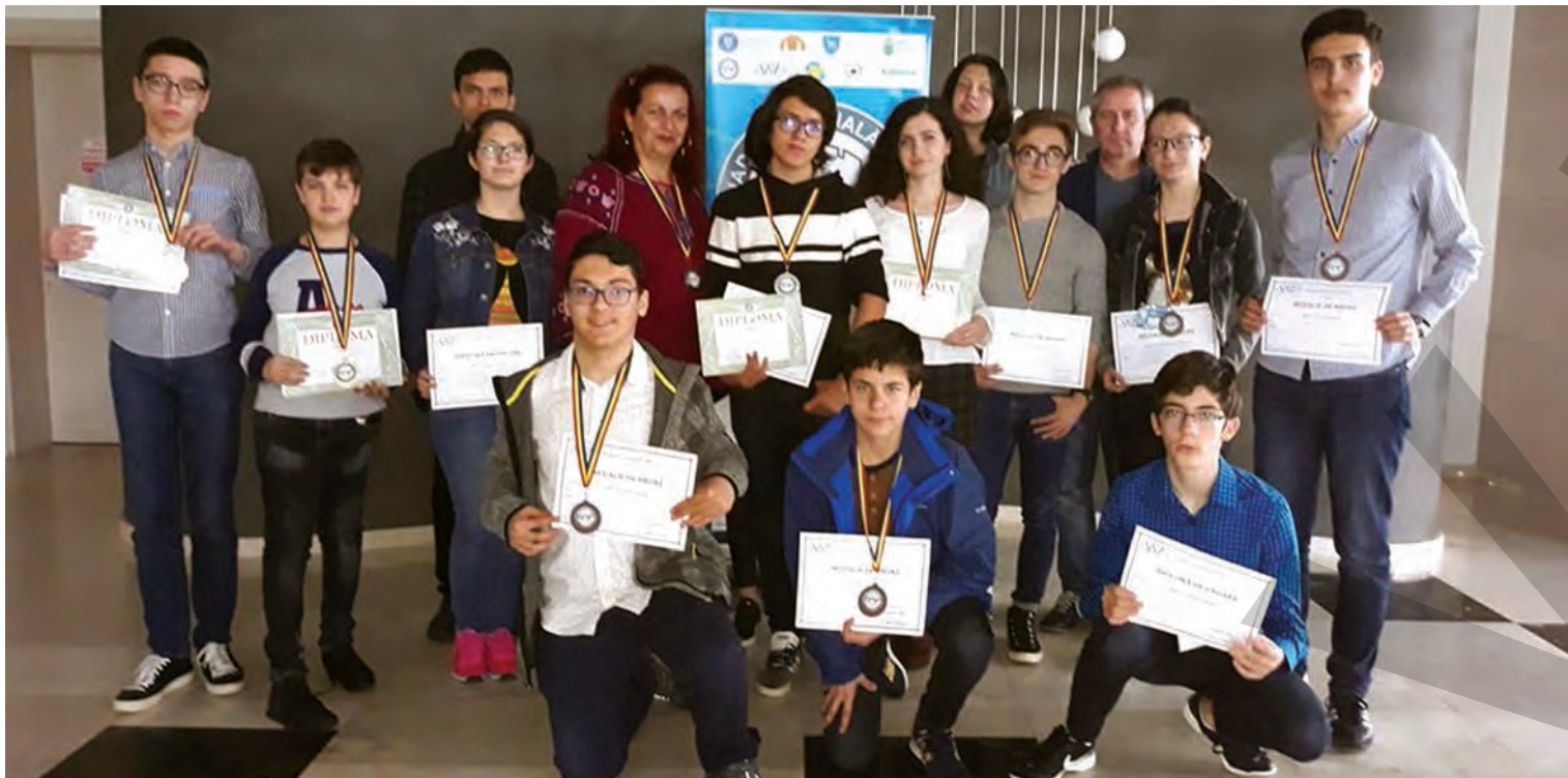
UN AN CU REZULTATE DE EXCEPȚIE ● PODIUM