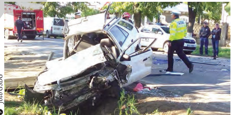
● În accident au fost implicate două mașini și o autocisternă

MARIANA CONSTANDACHE mariana@viata-libera.ro