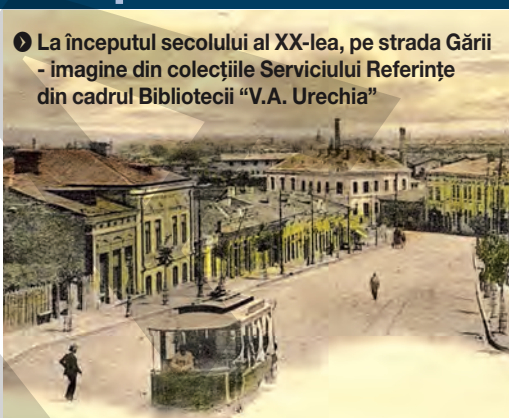
▶ La începutul secolului al XX-lea, pe strada Gării

„La 1926, capitalul Societății Anonime de Exploatare a Tramvaielor se ridica la 5 milioane de franci belgieni, în cadrul societății lucrând circa 110 salariați, din care 88 de vatmani, plus încasatori și controlori. Doar 23 de tramvaie circulau, la acea dată, pe străzile Portului, Colonel Boyle (fostă Speranței, astăzi Portului), Berthelot (fostă Mavromol, astăzi Nicolae Bălcescu), Lascăr Catargiu (fostă Culturii, astăzi Gării), Heliade Rădulescu (astăzi Gării), Traian, Tecuci, Brăilei și în Bădălan, pe strada Pescăriei”, spune consilierul Direcției pentru Cultură.