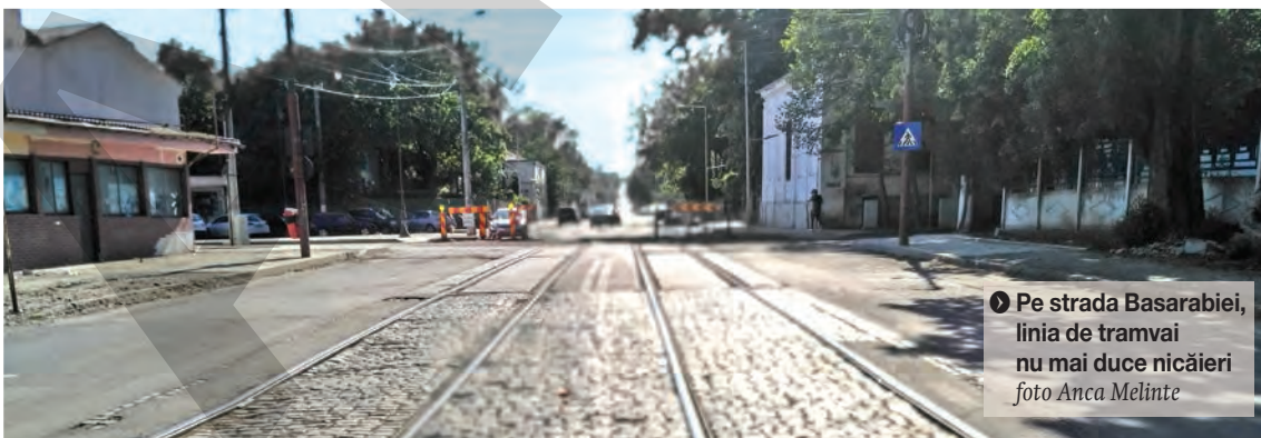
▶ Pe strada Basarabiei, linia de tramvai nu mai duce nicăieri

SECVENȚĂ. „Vagonul pătrășos, cu geamuri mari și cu un pantograf la fel de mare, se apropie, sunând din clopoțel și atenționând trecătorii. Un far mare, rotund este poziționat central, iar de o parte și de cealaltă a lui se află înscris numărul, probabil, de înmatriculare al vagonului: 17. Pe geamul vatmanului, în partea de jos se află o plăcuță pe care scrie cu majuscule „GARĂ”. Tramvaiul a coborât panta, venind dinspre oraș și mai are o singură stație până la Gara de călători CFR. Manipulantul frânează ușor și, înainte să ajungă în stație, un bărbat în palton și cu pălărie pe cap, se desprinde de bara de la ușa din față a tramvaiului, coborând din mers. Zgomotul hurducăit de metal, produs de roțile frânate, ușor, de saboții de metal, se suprapune peste larma celor care așteaptă, nerăbdători să urce în unicul vagon al tramvaiului. Ajuns în stație, oamenii se îmbulzesc prin cele patru goluri înguste, cu rol de ușă, câte două pe fiecare latură a vagonului. Tramvaiul pleacă, parcă târându-se sub greutatea mulțimii de pasageri... Nu este o poveste”, spune Marius Mitrof, este o secvență cât se poate de reală, de doar 24 de secunde, dintr-un film de propagandă realizat de către un soldat german, în Galați anulul 1944, când România era încă aliata Germaniei în timpul celui de-Al Doilea Război Mondial. ● A.M.