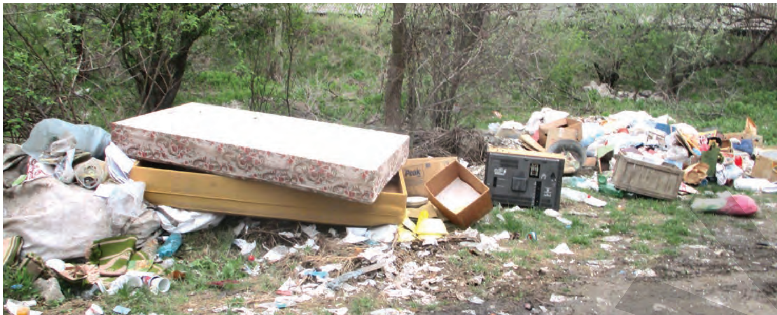
► Cele mai multe amenzi au fost aplicate pentru murdărirea domeniului public

PROTECȚIA MEDIULUI, O SARCINĂ PENTRU FIECARE ● MĂSURI