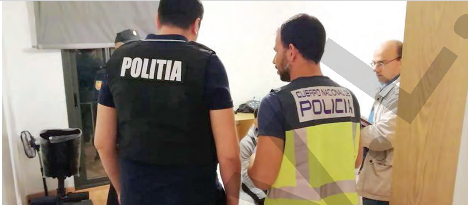
● Perchezițiile au avut loc și în Italia, Spania, Franța, Ungaria și Portugalia

ANCHETĂ DE AMPLOARE ÎN MAI MULTE STATE ● DOSAR