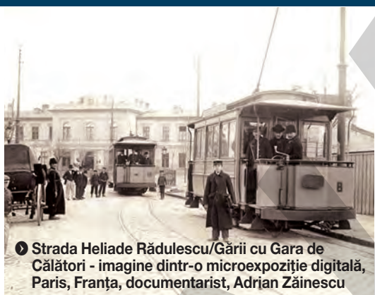
▶ Strada Heliade Rădulescu/Gării cu Gara de Călători - imagine dintr-o microexpoziție digitală, Paris, Franța, documentarist, Adrian Zăinescu