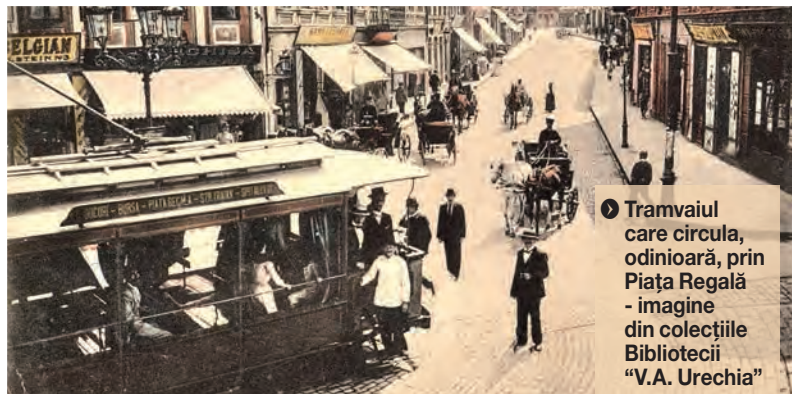
▶ Tramvaiul care circula, odinioară, prin Piața Regală