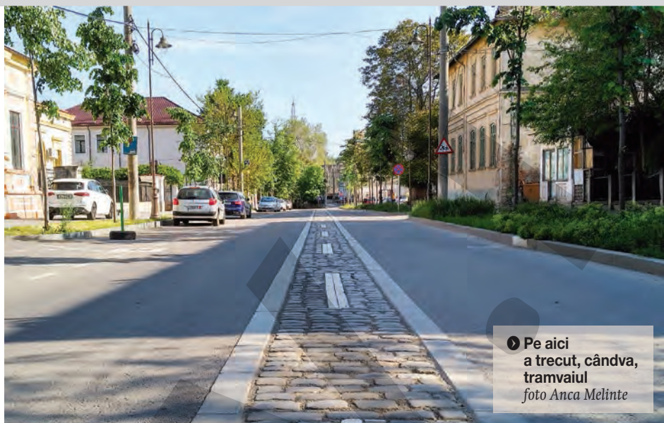
▶ Pe aici a trecut, cândva, tramvaiul