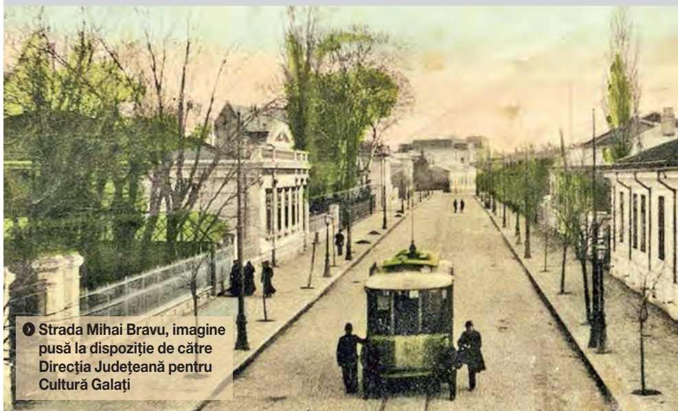
▶ Strada Mihai Bravu