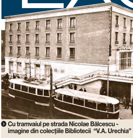
▶ Cu tramvaiul pe strada Nicolae Bălcescu