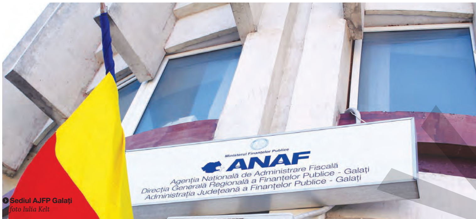
● Sediul AJFP Galați

UNUL PLEACĂ, ALTUL VINE, BA CHIAR DE DOUĂ ORI ● DGRFP