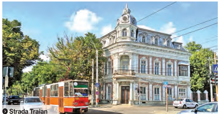
● Strada Traian