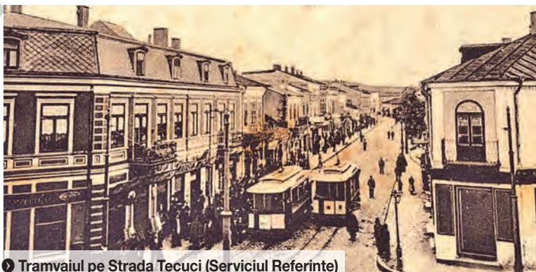
● Tramvaiul pe Strada Tecuci