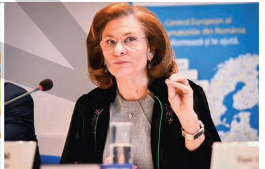
▶ Maria Grapini