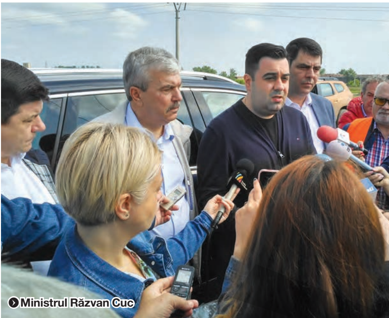
Ministrul Răzvan Cuc