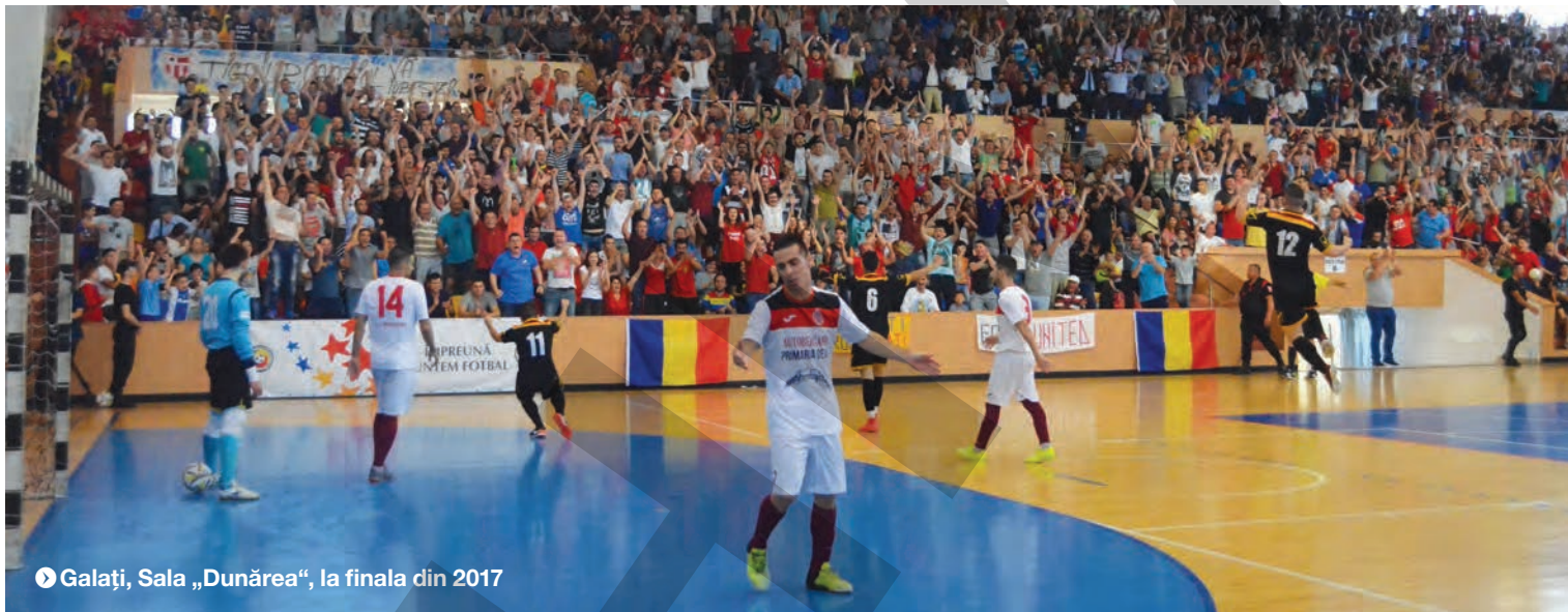
Galați, Sala „Dunărea”, la finala din 2017