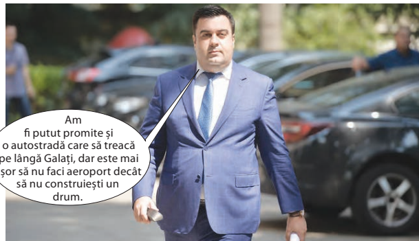
Am fi putut promite și o autostradă care să treacă pe lângă Galați, dar este mai ușor să nu faci aeroport decât să nu construiești un drum.

Ministrul Răzvan Cuc a fost ieri în județul Galați pentru a stabili zona în care va fi construit un aeroport internațional