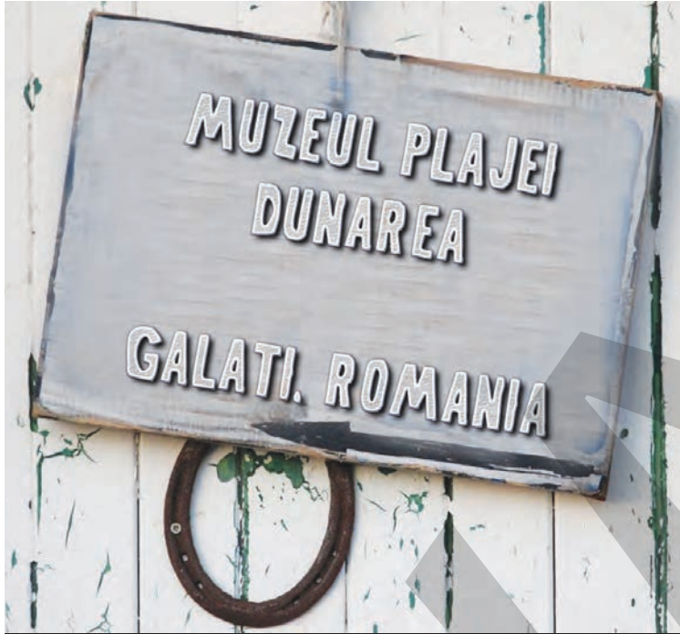
Vintage. Acesta e cuvântul care descrie fidel atmosfera din muzeul aflat la poalele turnului de televiziune

„Uite, tati, aici veneam cu maică-ta, când ne-am cunoscut, stăteam la soare, ne și bălăceam, că erau și bazine... Fii atent, să nu atingi exponatele, că se sparg, iar unele sunt și pline de rugină. Doamne, patina timpului îi dă muzeului valoare! Frumos, ce să mai, m-a răscolit mult această vizită”, au fost auziți unii părinți, în ciuda faptului că cei mici nu erau neapărat entuziasmați de istoriile spuse la doisprezece noaptea. „Bunicule, dacă tata a fost aici când nu era muzeu, putem spune că e muzeograf, că e cercetător sau ce e?”, a spart la un moment dat