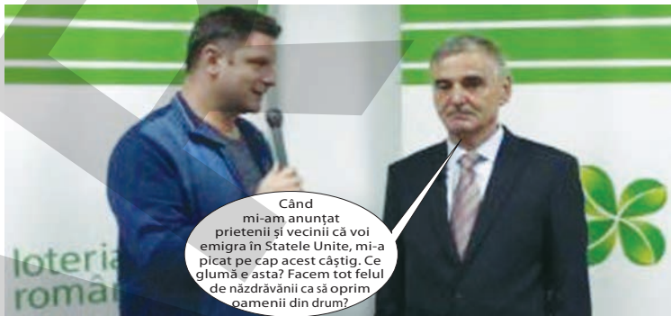
Când mi-am anunțat prietenii și vecinii că voi emigra în Statele Unite, mi-a picat pe cap acest câștig. Ce glumă e asta? Facem tot felul de năzdrăvăni ca să oprim oamenii din drum?

Un gălățean cu afaceri (dreapta) a câștigat 4,7 milioane de euro la loto