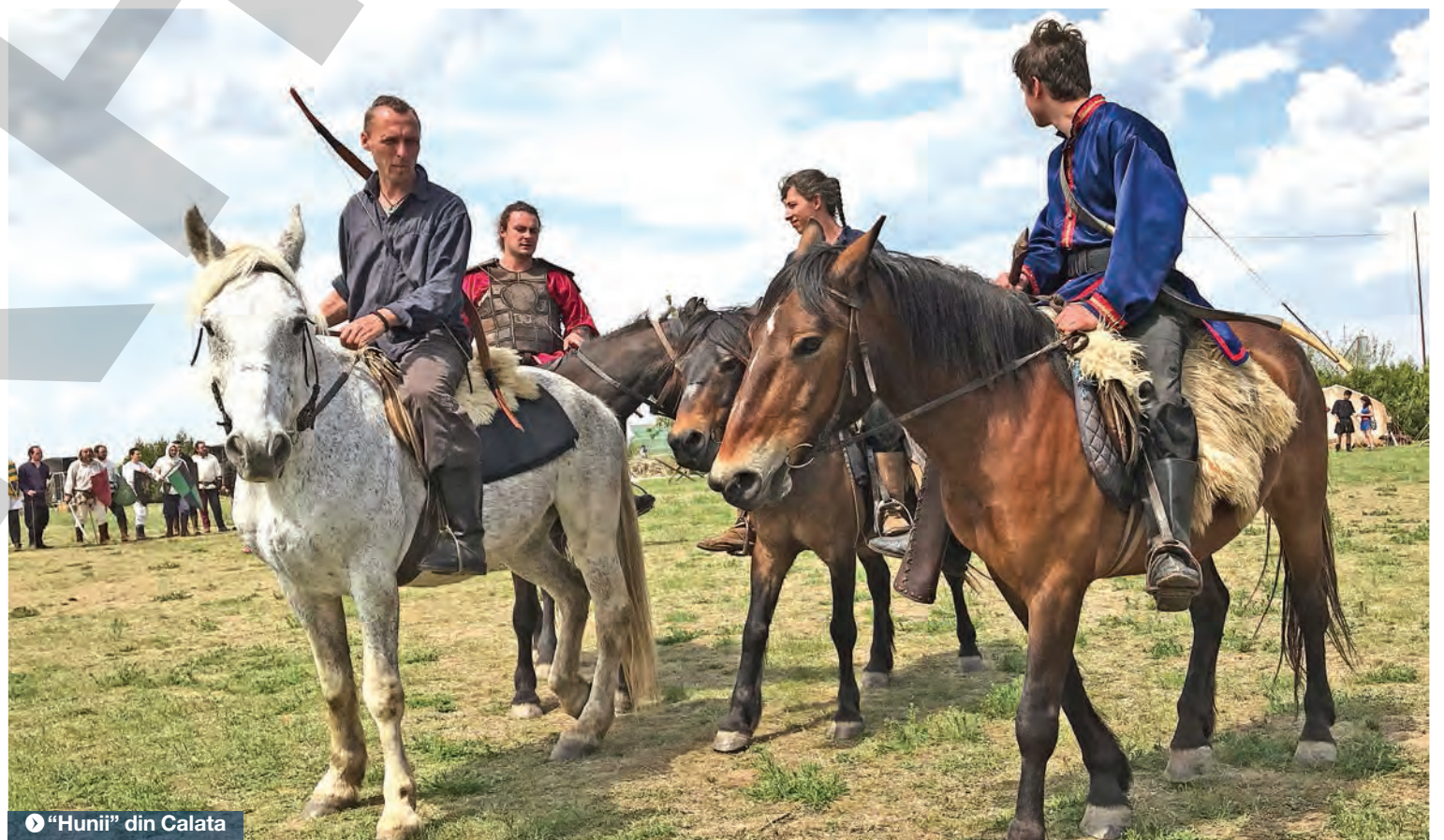
► “Hunii” din Calata