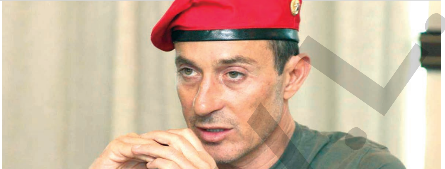
● Fostul primar al Constanței a fost închis la Rahova

România. Pentru informații suplimentare, vă rugăm să contactați autoritățile competente din România”, anunță Executivul Uniunii Europene. Sistemul european pentru urmărirea comercializării produselor din tutun, care include elemente de siguranță, a intrat în vigoare luni. ● T.M.