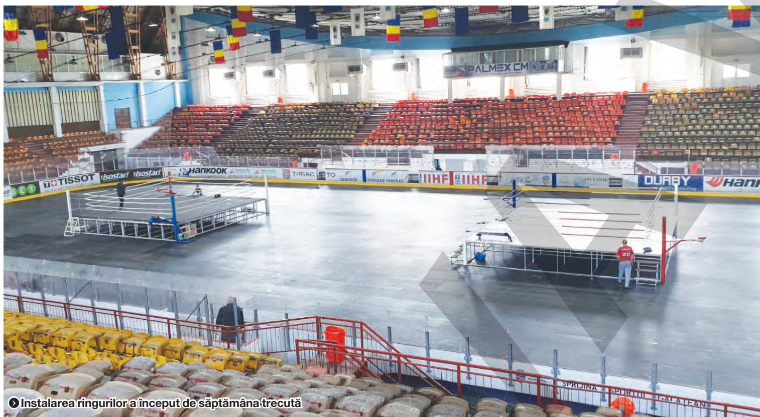
● Instalarea ringurilor a început de săptămâna trecută

MARIAN CĂPĂȚINĂ marian.capatina@viata-libera.ro