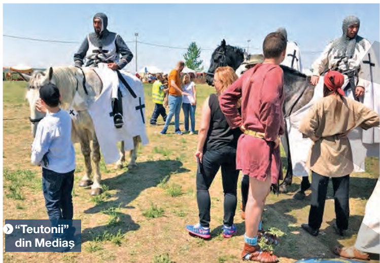
„Teutonii” din Mediaș