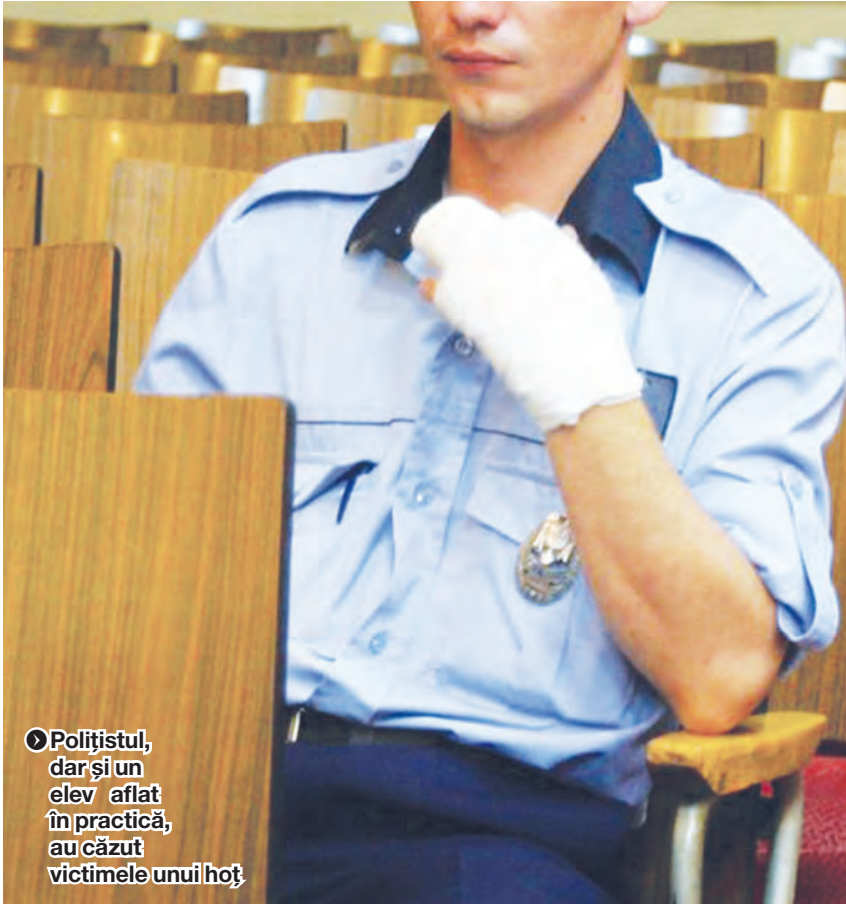
► Polițistul, dar și un elev aflat în practică, au căzut victimele unui hoț