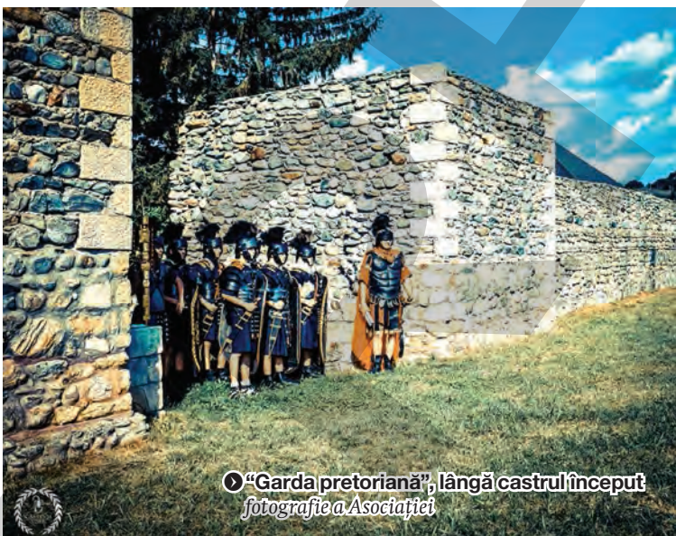
„Garda pretoriană”, lângă castrul început fotografie a Asociației