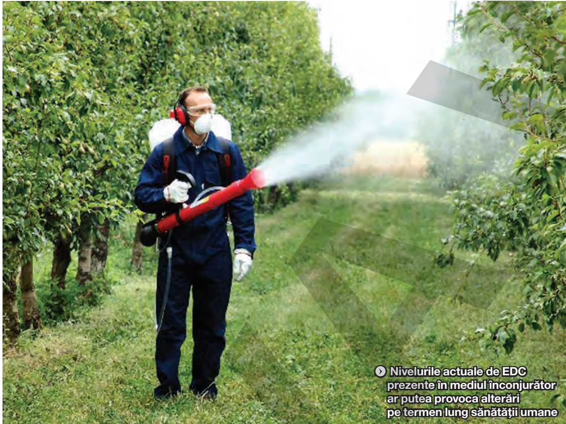
► Nivelurile actuale de EDC prezente în mediul înconjurător ar putea provoca alterări pe termen lung sănătății umane

În cadrul cercetării, mai multe generații de șoareci femele au fost expuse unui amestec de substanțe, precum compuși de plastic, estrogen, pesticide și alte doze de toxine inhalate în mod obișnuit de oameni. „Descendenții femelelor de șoareci gestante expuși unui amestec de perturbatori endocrini obișnuiți (endocrine disrupting chemicals - EDC), similari celor la care sunt expuși oamenii, au prezentat alterări în dezvoltarea sexuală și în comportamentele maternale, alterări ce