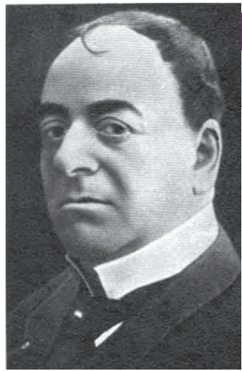
A încetat din viață pe 16 octombrie 1935.

Personalitate marcantă a istoriei teatrului românesc, Constantin I. Nottara a fost, timp de jumătate de secol, interpret, director de scenă, profesor de actorie. Ca profesor al Conservatorului de Artă Dramatică din București, Nottara i-a avut ca elevi, printre alții, pe viitorii mari actori ai scenei românești Tony Bulandra, Vasile Maximilian, Ion Manolescu, Maria Ventura, Maria Filotti.