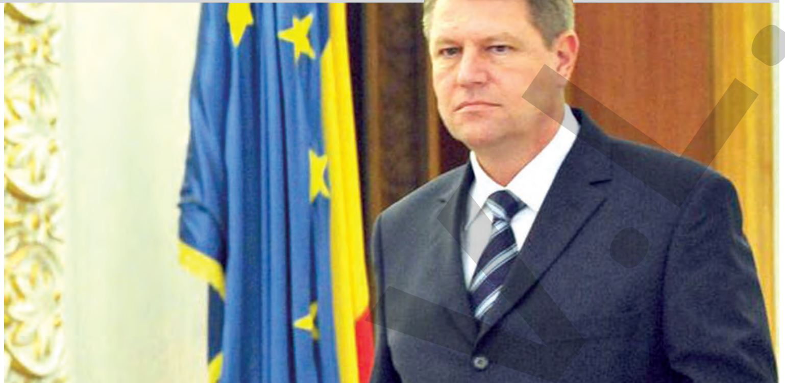
● Klaus Iohannis a discutat cu liderii PNL, USR și UDMR

RESTITUIRI. Administrația Județeană a Finanțelor Publice (AJFP) Galați informează că Administrația Fondului pentru Mediu a virat, luni, banii necesari restituirii timbrului auto pentru gălățenii care au depus cereri în acest sens. „Ultimul virament, în sumă de 2,5 milioane lei, a fost efectuat în data de 3.06 pentru cererile reprezentând timbru de mediu, urmând ca această sumă să fie restituită în cursul zilelor de 3 și 4.06. În funcție de sumele virate, AJFP Galați va proceda la restituirea taxelor solicitate”, a precizat pentru „Viața liberă” instituția gălățeană. ● C.L.