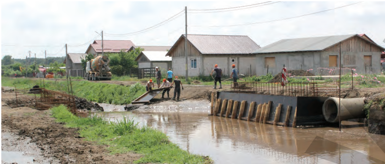
Podurile construite cu bani de la Guvern

INVESTIȚII MULT AȘTEPTATE DE CETĂȚENI ● PROIECTE