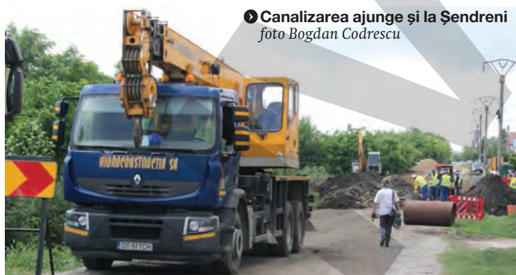
Canalizarea ajunge și la Șendreni

„Mă preocupă siguranța cetățenilor. Avem două cursuri de apă, Rusca Mare și Obreja, pentru care am obținut, prin Programul Național de Dezvoltare Locală (PNDR), finanțare pentru construirea a