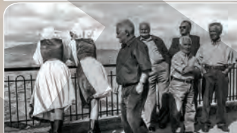
► Fotografii „marca” Sabella