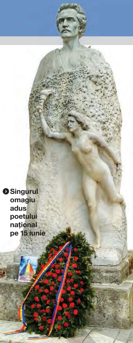
● Singurul omagiu adus poetului național pe 15 iunie