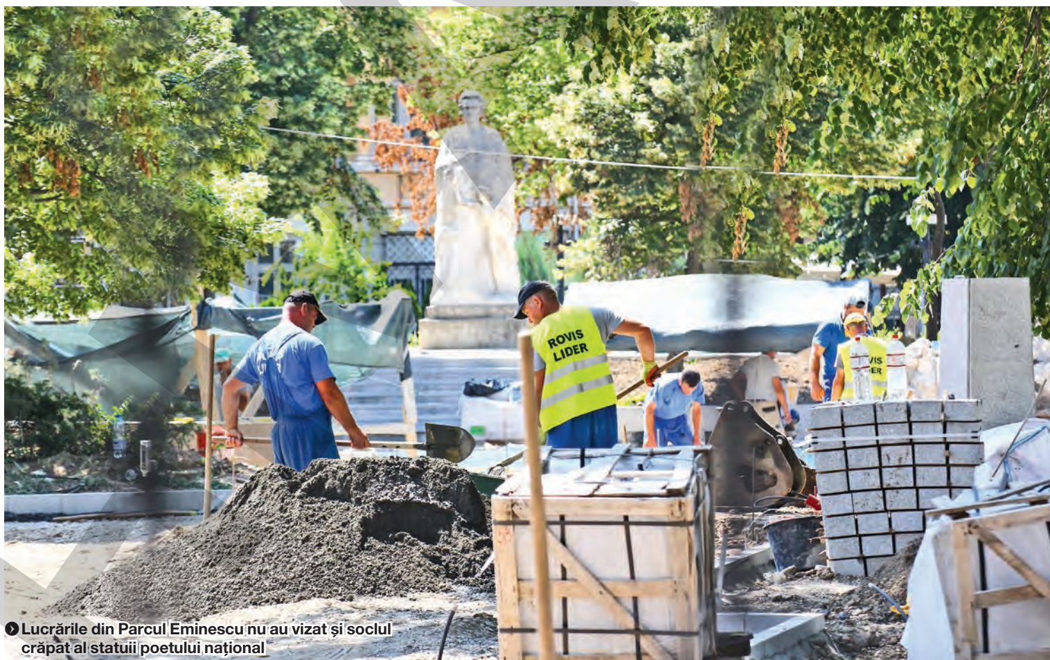
● Lucrările din Parcul Eminescu nu au vizat și soclul crăpat al statuii poetului național