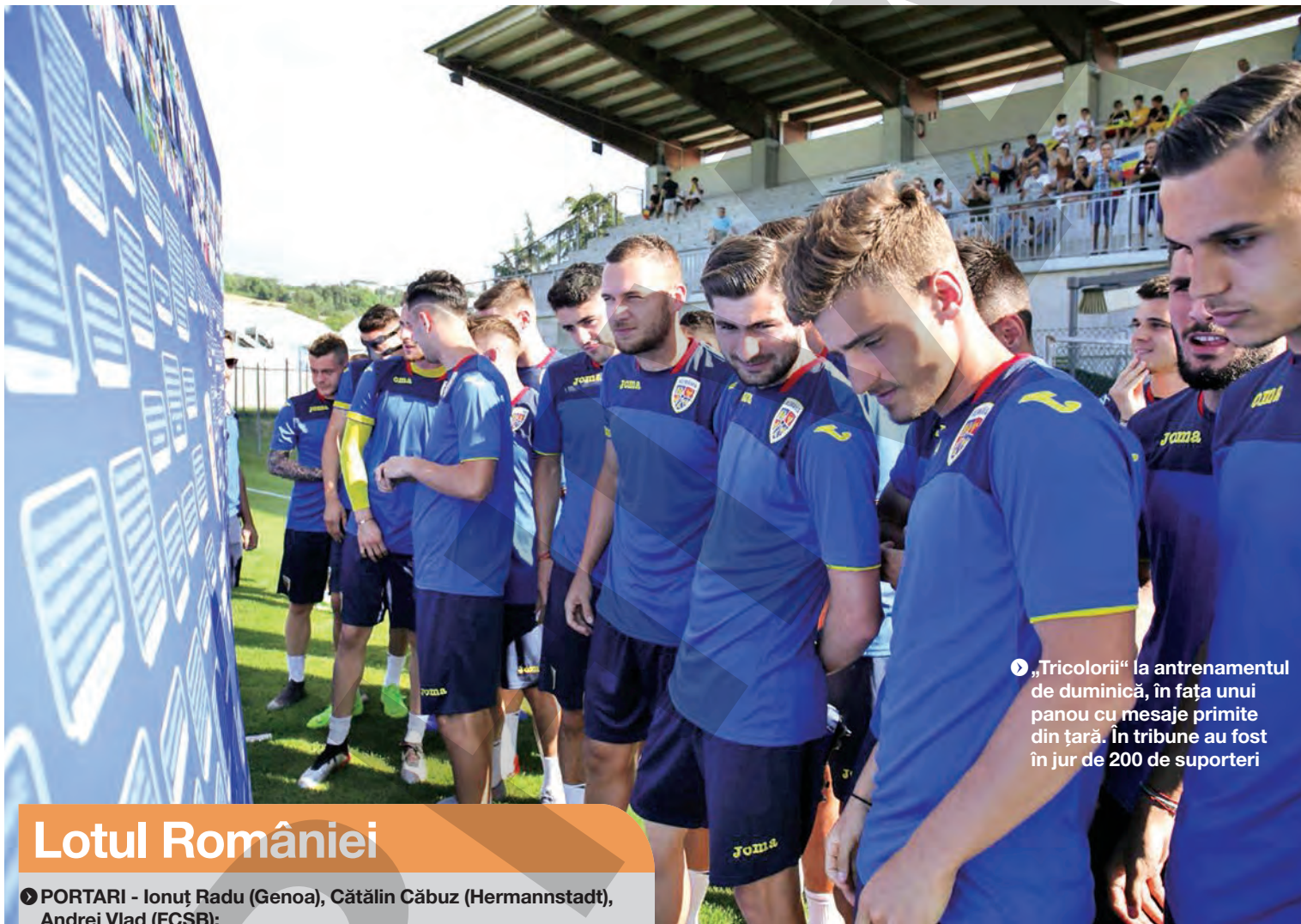
„Tricolorii“ la antrenamentul de duminică, în fața unui panou cu mesaje primite din țară. În tribune au fost în jur de 200 de suporteri

MIREL RĂDOI selecționerul echipei naționale U21