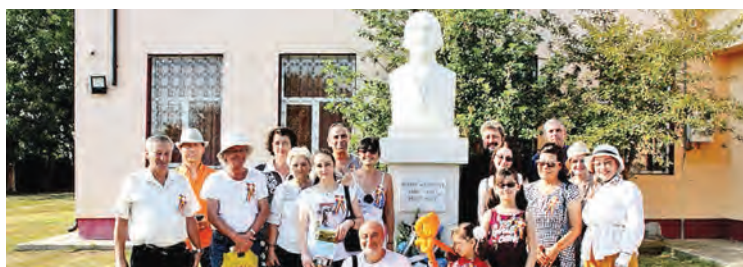
► Lângă statuia lui Mateevici din Movileni