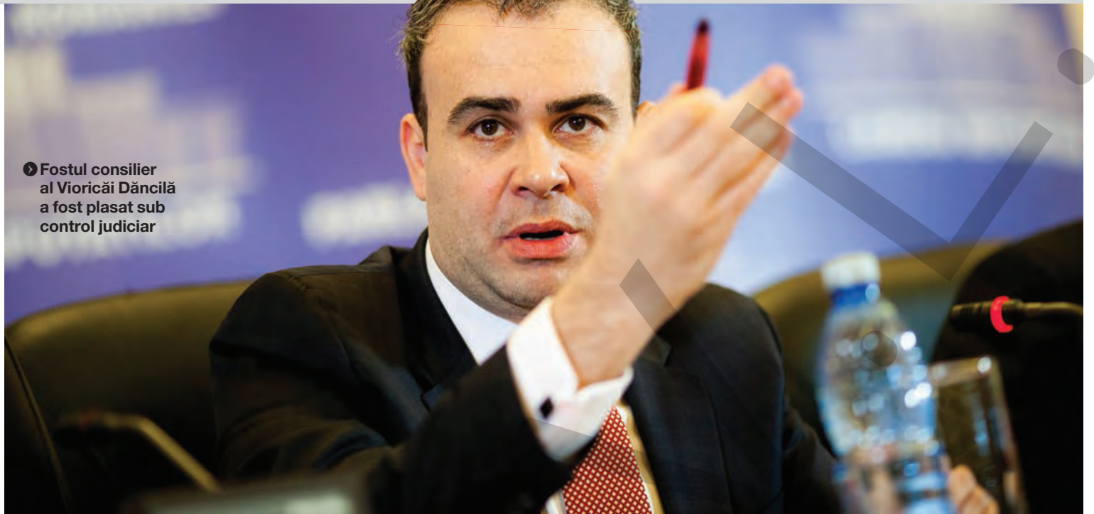
► Fostul consilier al Vioricăi Dăncilă a fost plasat sub control judiciar

DUPĂ CE A PUBLICAT PROTOCOLUL DIN SRI ȘI PARCHETUL GENERAL ● ANCHETĂ