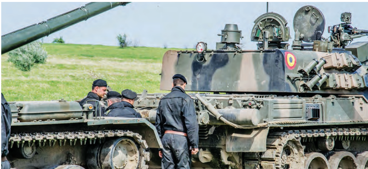
► Militarii au folosit muniție reală de luptă

ÎN CADRUL SABER GUARDIAN 2019 ● ANTRENAMENTE