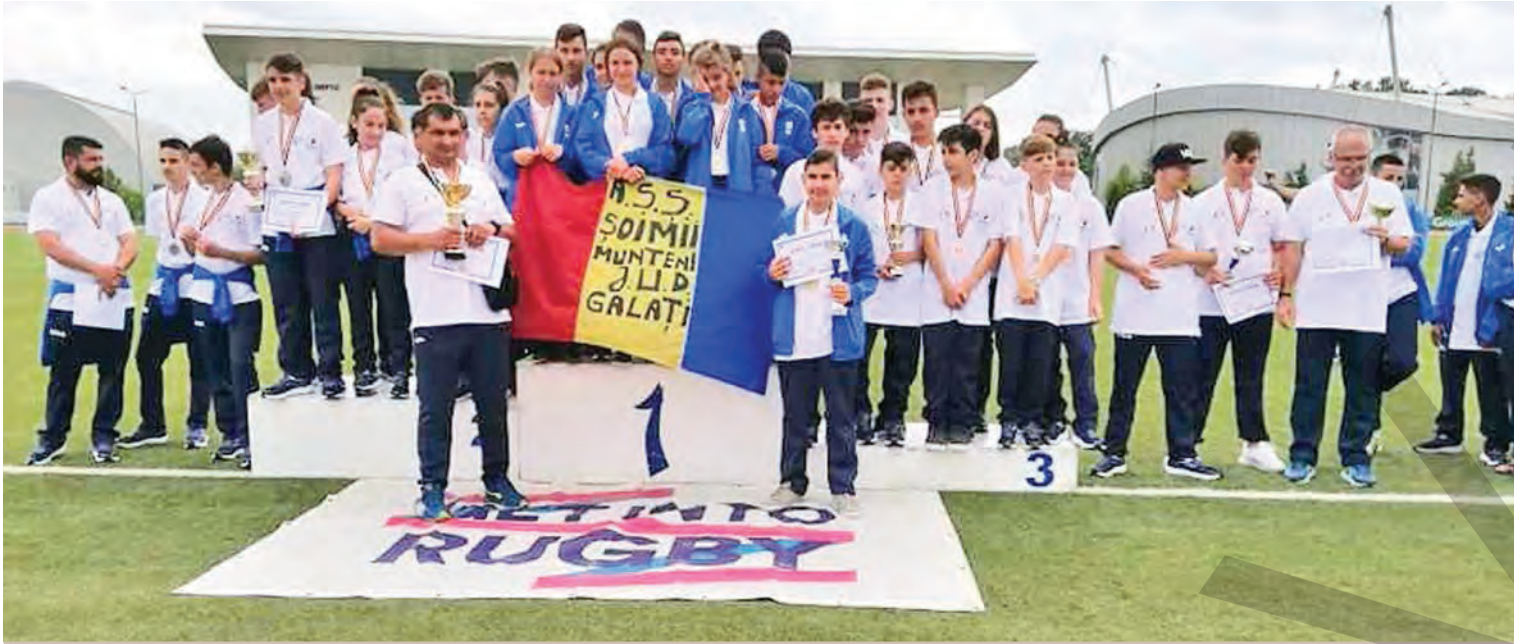
LA OLIMPIADELE NAȚIONALE LA RUGBY TAG ● REUȘITE