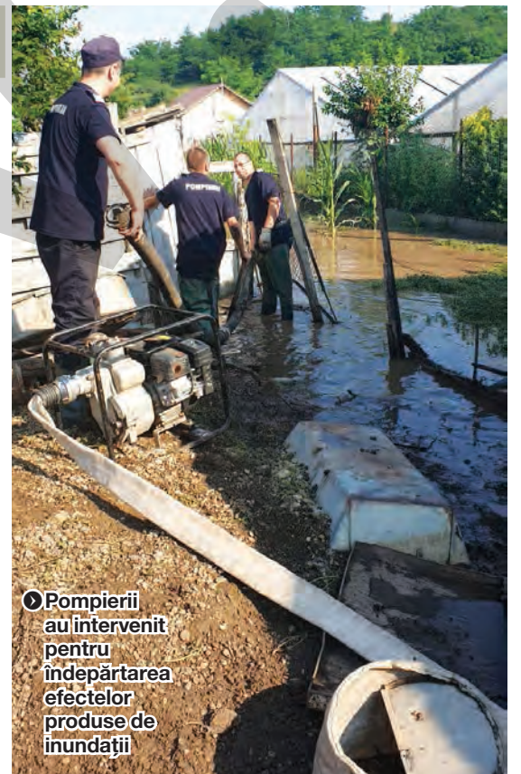
► Pompierii au intervenit pentru îndepărtarea efectelor produse de inundații

Din păcate, meteorologii nu au vești bune nici pentru zilele următoare, așa că localnicilor din Corod nu le rămâne decât să se roage ca ploile torențiale să le ocolească localitatea. ●