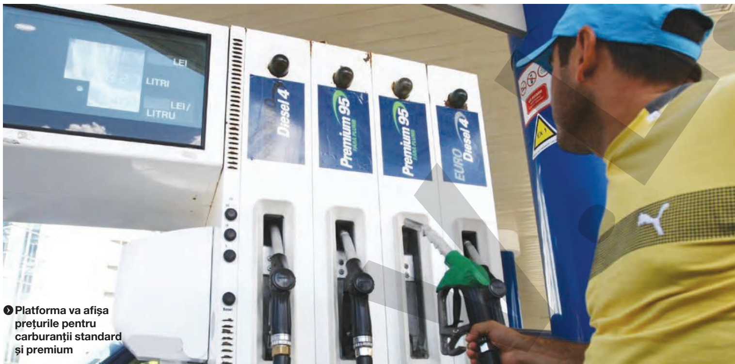
● Platforma va afișa prețurile pentru carburanții standard și premium

CONSILIUL CONCURENȚEI MONITORIZĂ CARBURANȚII ● APLICAȚIE