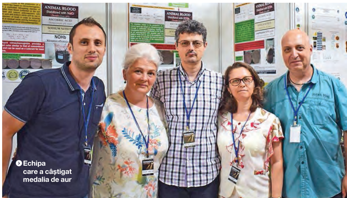
● Echipa care a câștigat medalia de aur

Ideea i-a adus Universității „Dunărea de Jos” Diploma de Excelență și o medalie de aur la „Inventica 2019”