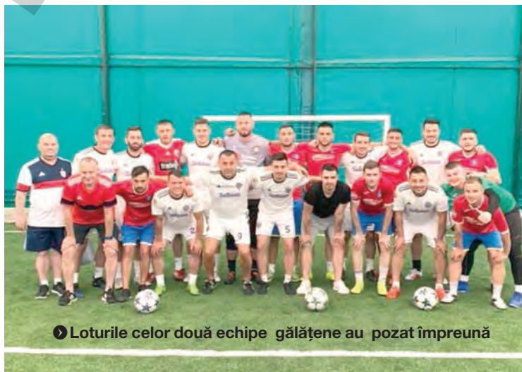
● Loturile celor două echipe gălățene au pozat împreună

În turneul care s-a desfășurat la Bacău, Atletico Abcoz a învins, în grupă, pe Liriada Râșnov cu 3-2 și a cedat cu 3-6 în fața redutabilei echipe „La Maria și Ion” București, una cu jucători în regim profesionist, cu salarii lunare. Formația gălățeană a avansat din grupă de pe locul secund, iar în primul tur eliminatorku („32-imi”) a trecut cu 2-1 de Farmacia Victoria Tg. Jiu. A urmat încă o victorie, 3-2 la loviturile de departajare cu Phone Focșani (2-2 în timpul re-