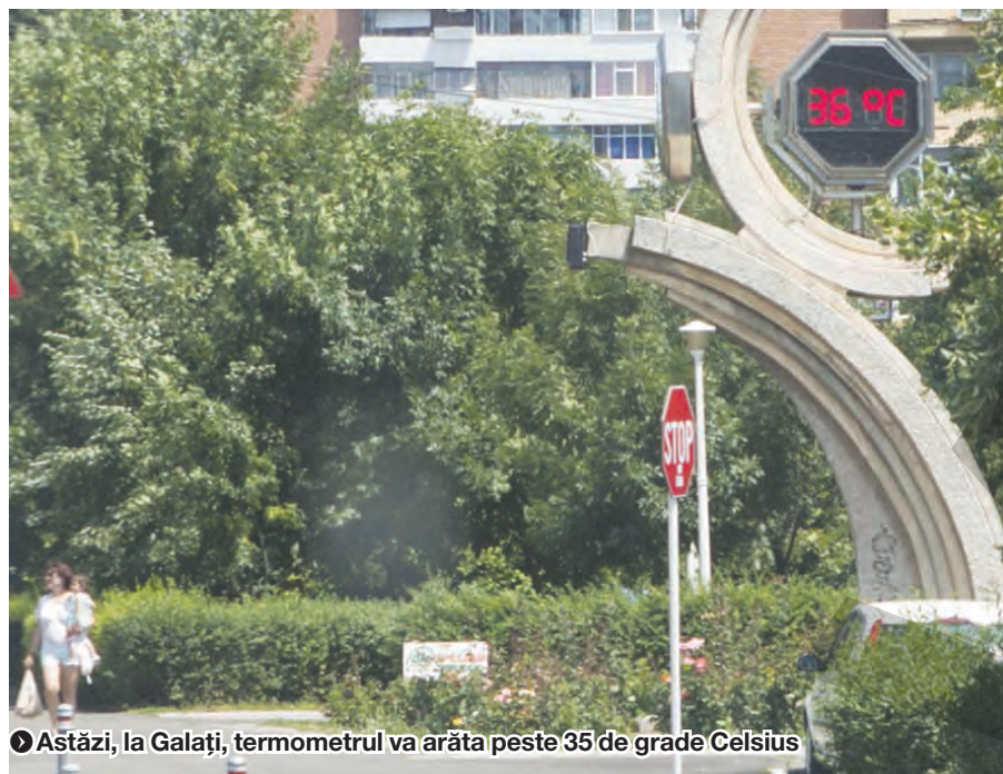
● Astăzi, la Galați, termometrul va arăta peste 35 de grade Celsius

Aceștia au descoperit că riscurile apariției bolilor mintale sunt reduse cu până la 30 la sută în momentul în care angajații devin șomeri, se află în concediu prenatal sau lucrează de acasă mai puțin de opt ore pe săptămână. ● R.B.