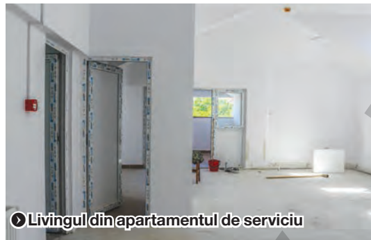
Livingul din apartamentul de serviciu