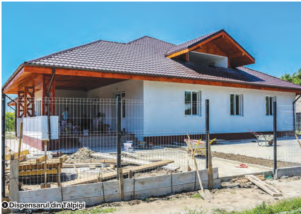
Dispensarul din Tălpigi