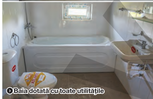
Baia dotată cu toate utilitățile

CONDIȚII PENTRU SERVICII MEDICALE MAI BUNE ● INVESTIȚIE