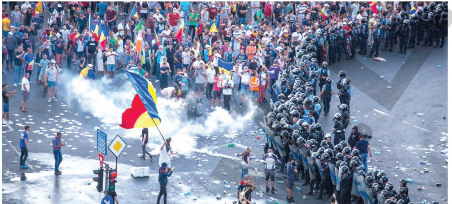
● Aproape 800 de protestatari au depus plângeri penale împotriva jandarmilor

în Ilfov, două în Prahova și câte una în Dâmbovița și Brașov) în cauza în care sunt cercetate fapte de corupție și delapidare. Activitatea TAROM nu a fost afectată de percheziții, iar operarea curselor aeriene s-a derulat în condiții normale. ● T.M.