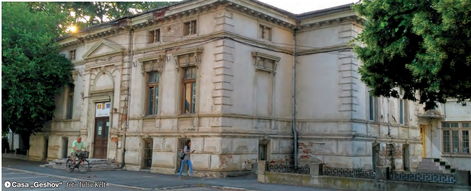
► Casa „Geshov”

LICITAȚII ANULATE PENTRU RESTAURARE PE BANI EUROPENI ● CONTRACTE