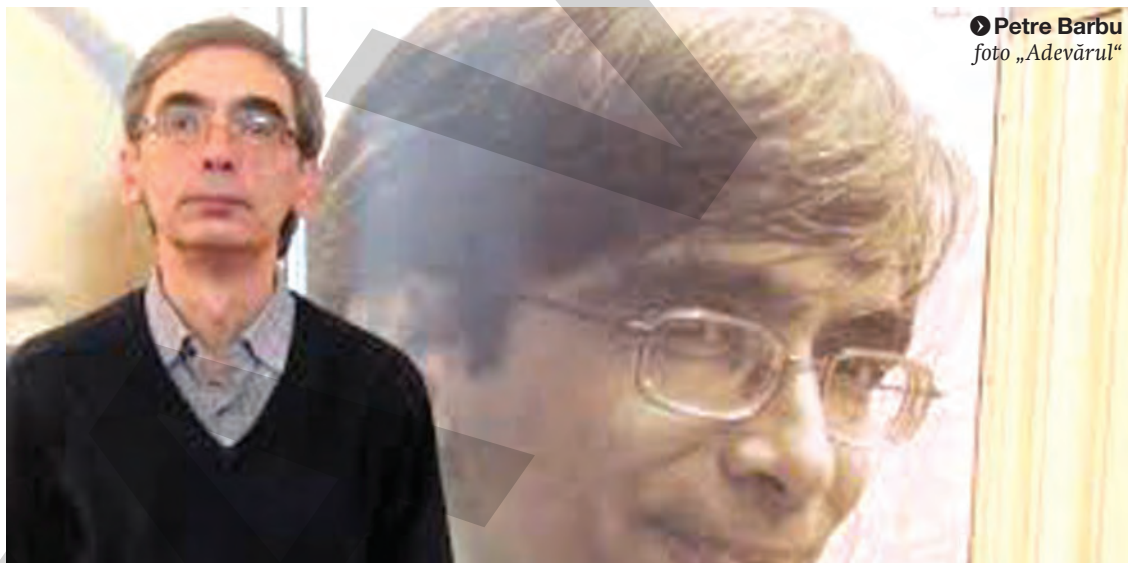
● Petre Barbu foto „Adevărul”