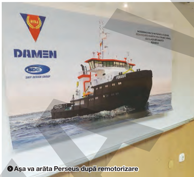
► Așa va arăta Perseus după remotorizare

CRISTINEL LUCA cristi.luca@viata-libera.ro