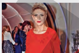
cu Teo Trandafir