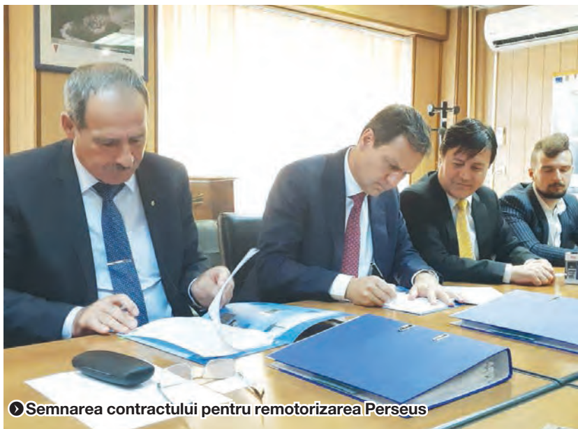
► Semnarea contractului pentru remotorizarea Perseus