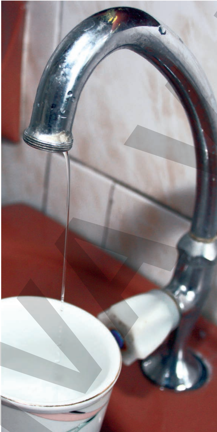
● Apa potabilă va fi oprită de la ora 8,00 și până la ora 22,00

Pentru situații deosebite, societatea va pune la dispoziție cisterne cu apă, cererile putând fi făcute la Dispeceratul Apă Canal, la numerele de telefon 0236.463.294 și 0236.473.380 interior 133. ●