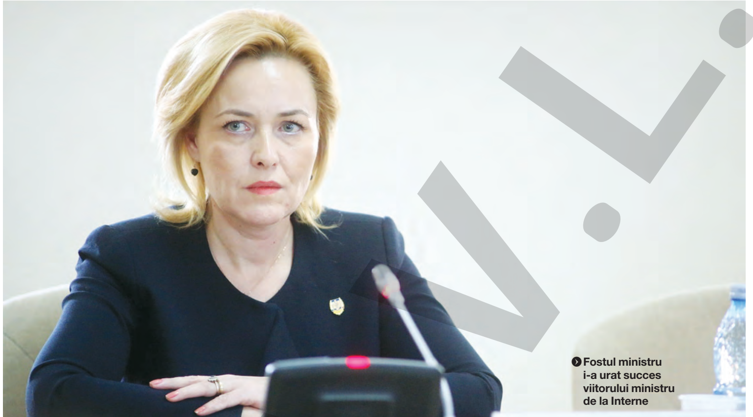
● Fostul ministru i-a urât succes viitorului ministru de la Interne