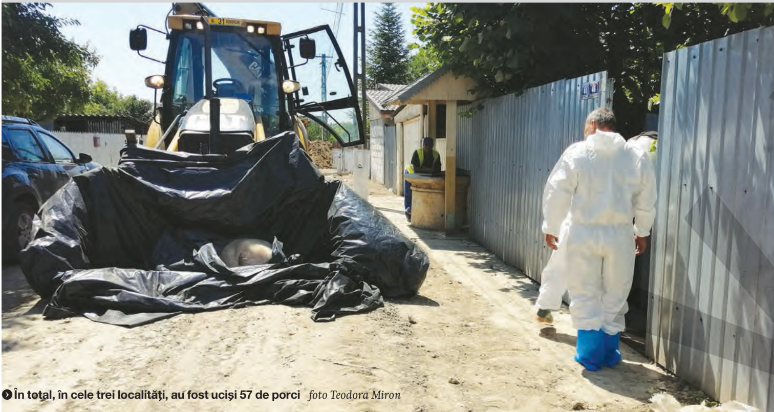
● În total, în cele trei localități, au fost uciși 57 de porci

TREI FOCARE NOI ÎN JUDEȚUL GALAȚI ● ALERTĂ