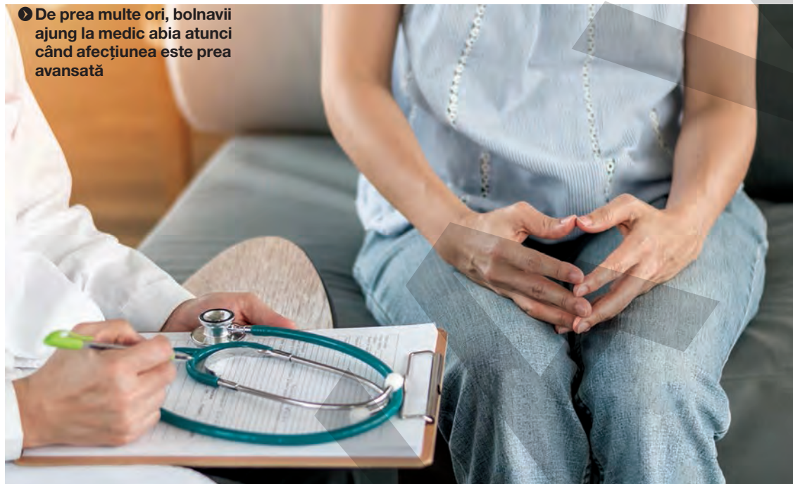
De prea multe ori, bolnavii ajung la medic abia atunci când afecțiunea este prea avansată

Din datele publicate recent de Centrul Național de Statistică și Informatică în Sănătate Publică reiese că, în primele trei luni ale acestui an, în județul Galați au fost diagnosticate 344 de noi cazuri de cancer, față de 311, în perioada corespunzătoare a anului trecut. Incidența la sută de mii de locuitori a crescut astfel de la 246,7 cazuri, în primul trimestru din 2018, la 272,9 cazuri, în trimestrul I al acestui an. Practic, potrivit autorităților, incidența tumorilor maligne nou diagnosticate pe plan local a fost de 3,3 cazuri la sută de locuitori, în perioada ianuarie-martie 2019, în timp ce media națională a fost de 2,5. Opt județe se află în fața Galațiului, cu o incidență mai mare a cazurilor noi de cancer. Printre acestea se numără județele Olt, Dolj, Teleorman și Sibiu.