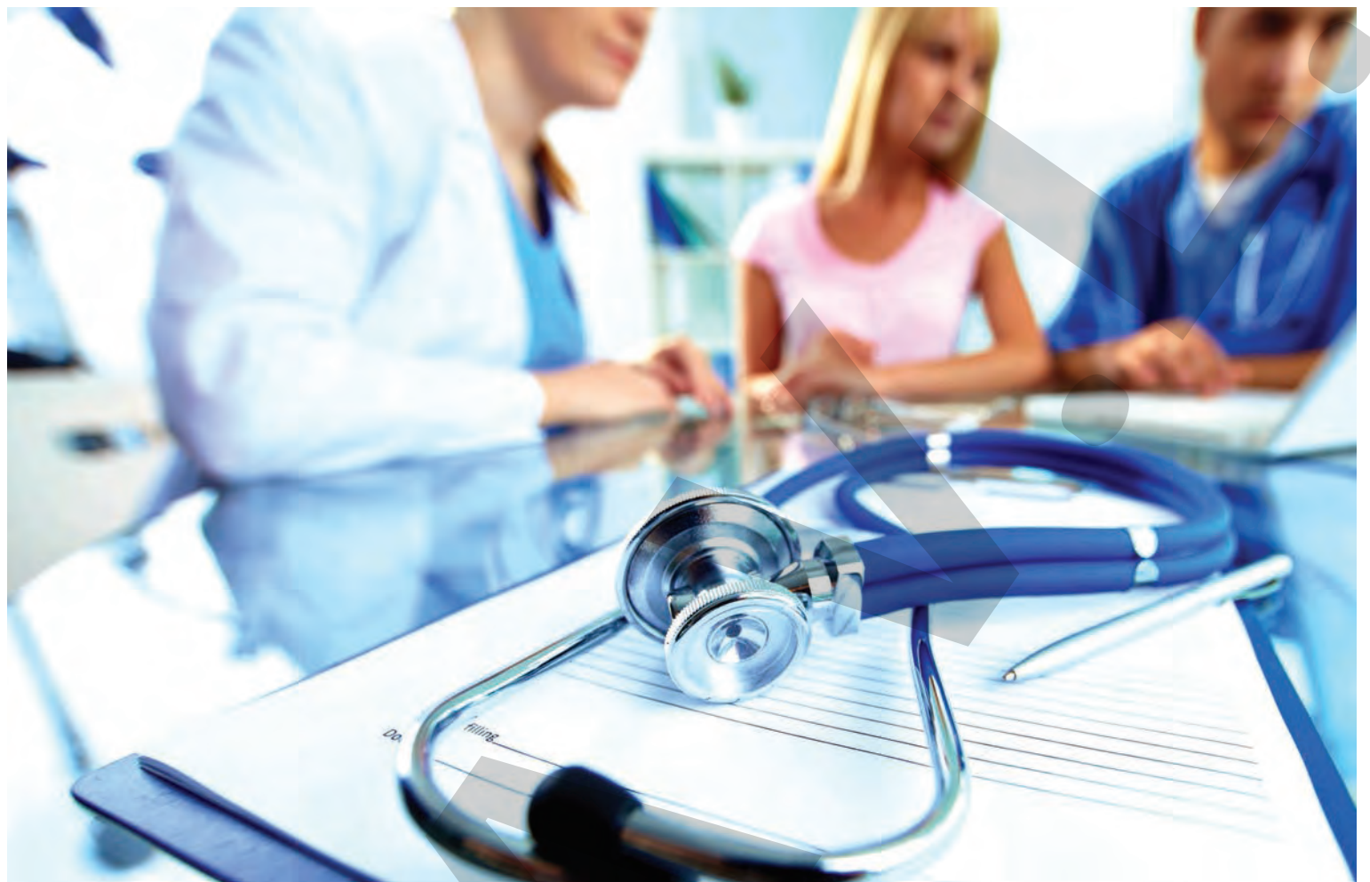
● Serviciile acordate de clinicile de boli profesionale și de cabinetele de medicină a muncii nu sunt decontate de stat

MĂSURĂ. Ministrul Sănătății, Sorina Pinteș, a anunțat că un angajat al unui spital din România a fost dat afară, după infiltrarea falșilor pacienți în spitalele din România. Pacienții falși au fost trimiși cu scopul de a verifica dacă medicii solicită mită și dacă condiționează actul medical. Trimiterea „pacienților sub acoperire“ în spitale a început de trei săptămâni, a spus Sorina Pinteș, până acum având loc cinci astfel de acțiuni, informează agerpres.ro. „În acest moment, o persoană a părăsit spitalul. (...) Este o parte a strategiei anticorupție pe care trebuie să o aplicăm, iar în momentul în care gradul de satisfacție al pacientului scade, până la urmă trebuie să luăm cu toții niște măsuri și trebuie să ne ridicăm și noi semne de întrebare. (...) Pentru unii care nu respectă niște reguli nu trebuie să suferă toți cei care lucrează în sistemul medical. Până la urmă trebuie să învățăm că există niște reguli și trebuie să le respectăm“, a menționat ministrul Sănătății, care a precizat că se referă doar la cei care condiționează actul medical. Oficialul a dat exemplul unei persoane care a mers la un spital pentru a face consultațiile obligatorii pentru școala de șoferi și căreia i s-a cerut tariful legal, plus o sumă „pentru celeritate“ de către un personal auxiliar. ● R.B.