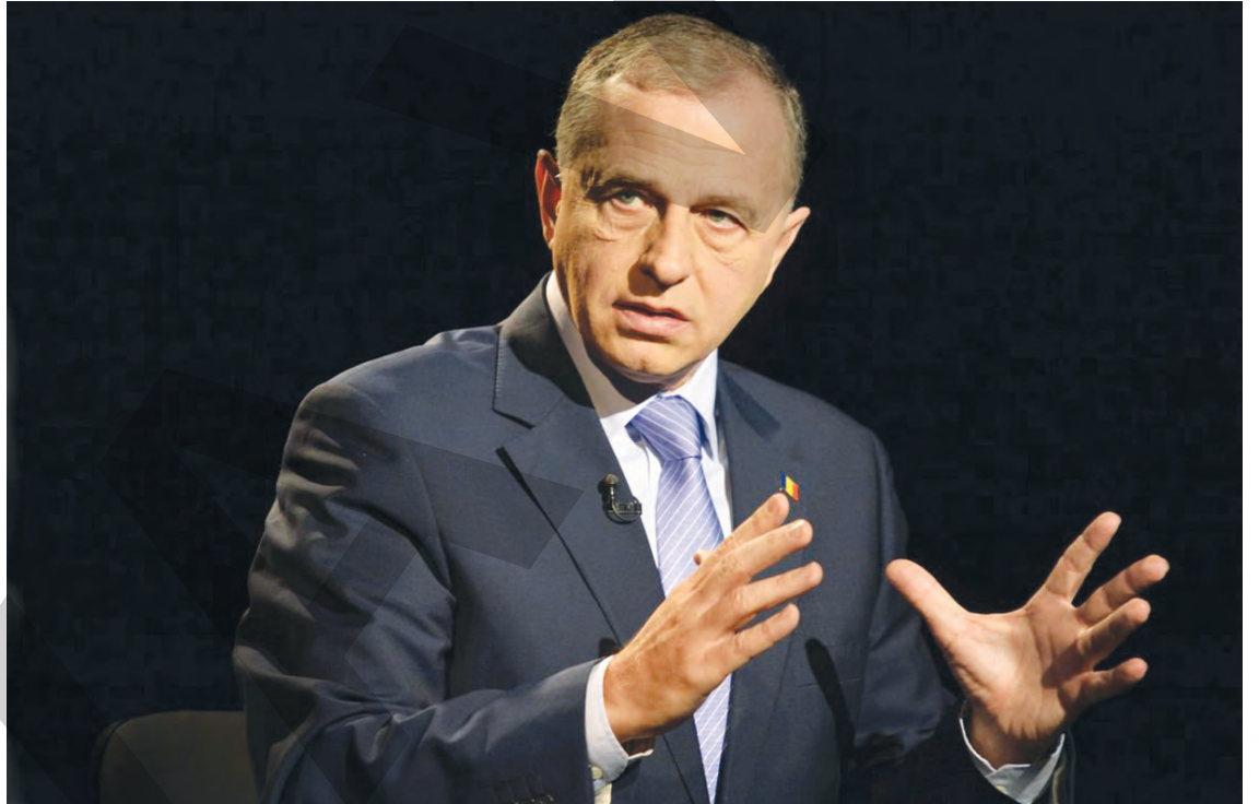
● Mircea Geoană a fost ambasador al României în SUA și ministru de Externe în Guvernul Năstase

„Sunt mândru să fiu desemnat de către secretarul general NATO, Jens Stoltenberg, ca următorul secretar general adjunct. Este, deopotrivă, o uriașă provocare și o oportunitate de a reprezenta interesele alianței noastre, care asigură securitatea a peste un miliard de cetățeni. De-a lungul carierei mele diplomatice și politice, am promovat legătura transatlantică și integrarea euro-atlantică a României. Sunt profund onorat să fiu desemnat pentru această poziție cheie ce reprezintă, de asemenea, o recunoaștere a importanței contribuției a României în cadrul NATO. Apreciez, în mod deosebit, susținerea politică