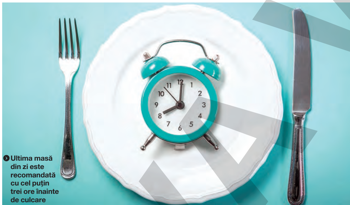
● Ultima masă din zi este recomandată cu cel puțin trei ore înainte de culcare

În cele 16 ore în care nu vei mânca nimic, nivelul de insuli-