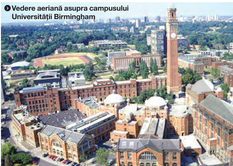
► Vedere aeriană asupra campusului Universității Birmingham

în prezent sunt create cu un condei de maestru de Victor Cilincă. Limbajul și detaliile adaptate fiecărei epoci în parte, umorul din abundență și detaliile istorice bine documentate fac din „Das Mioritza Reich“ un text deosebit de complex, maleabil însă pe așteptările și pe imaginația fiecărui cititor în parte.