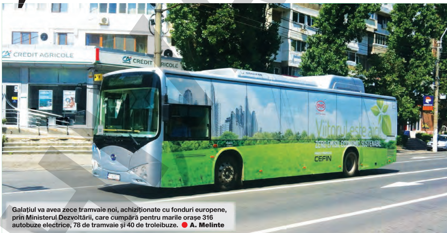
Galațiul va avea zece tramvaie noi, achiziționate cu fonduri europene, prin Ministerul Dezvoltării, care cumpără pentru marile orașe 316 autobuze electrice, 78 de tramvaie și 40 de troleibuze. ● A. Melinte