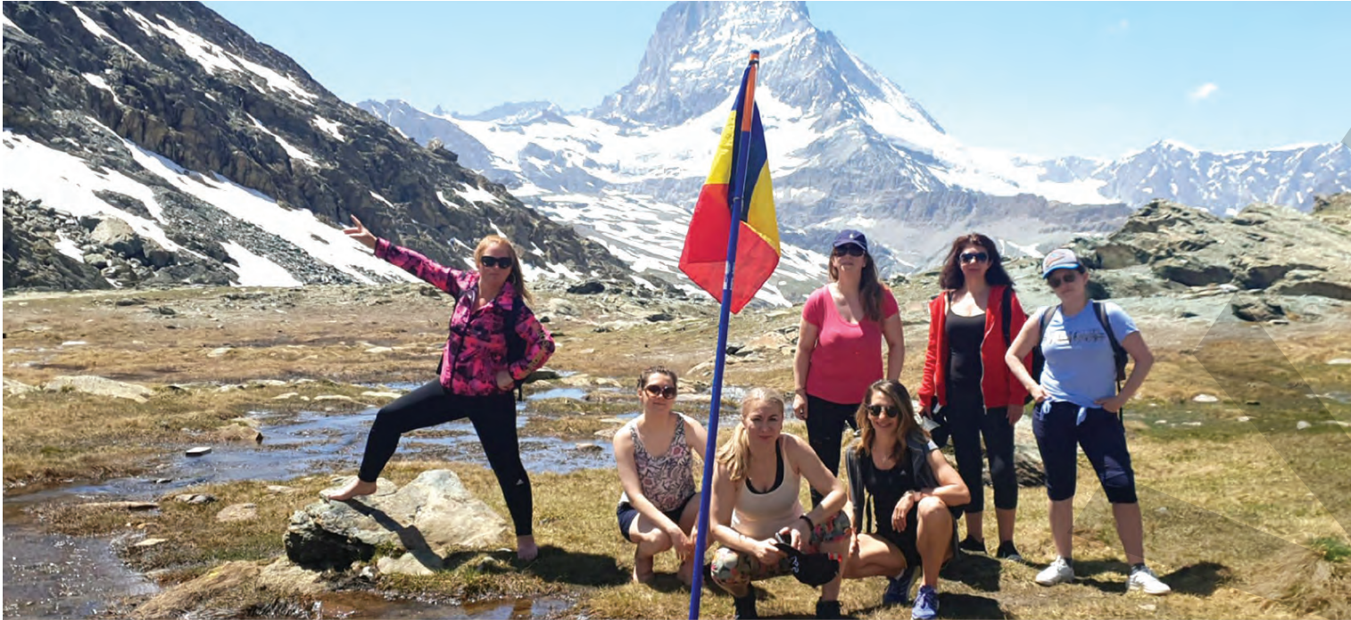
ROMANIAN WOMEN IN UK ● PATRIOTISM