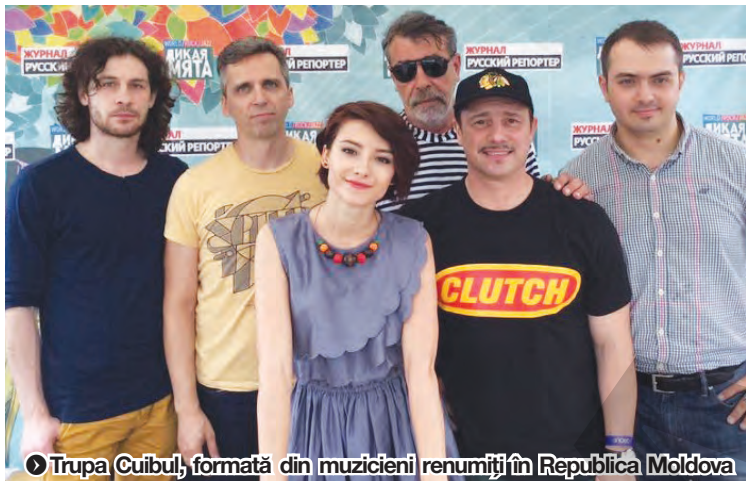
Trupa Cuibul , formată din muzicieni renumiți în Republica Moldova

Ultima trupă din prima seară a festivalului vine tocmai din îndepărtata Cuba: Afro-Cuban Musa . Bucuria pe care o transpun în cântecele lor este fantastică, tocmai de aceea muzica lor este plină de energie pozitivă, foarte lirică, foarte ușor de ascultat și înțeles. Cei de la Afro-Cuban Musa reușesc să creeze o punte între muzica cubaneză contemporană și cea tradițională, demonstrând că muzica acestei țări nu a dispărut în timp. În a doua seară a Danube Jazz