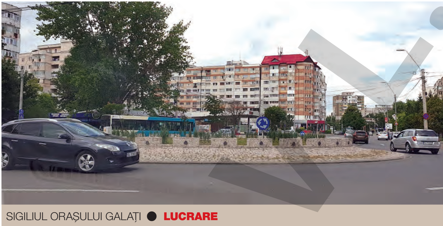
SIGILIUL ORAȘULUI GALAȚI ● LUCRARE

PENAL. Polițiștii Biroului Rutier Galați au fost sesizați, prin apel la numărul unic de urgență 112, cu privire la faptul că, pe strada Navelor, din municipiul Galați, un autoturism, înmatriculat în Franța, se deplasează sinuos. Un echipaj al Poliției Rutiere s-a deplasat imediat în zona indicată și a găsit autoturismul în cauză parcat pe partea dreaptă a sensului de mers dinspre bulevardul Marea Unire către strada Domnească. Bărbatul, în vârstă de 52 de ani, aflat la volan, a fost testat cu aparatul etilotest, valoarea înregistrată fiind de 0,73 mg/l alcool pur în aerul expirat. Acesta a fost condus la spital unde i-au fost prelevate mostre biologice, iar polițiștii au întocmit dosar penal pentru infracțiunea de conducere a unui vehicul sub influența alcoolului. ●T.M.