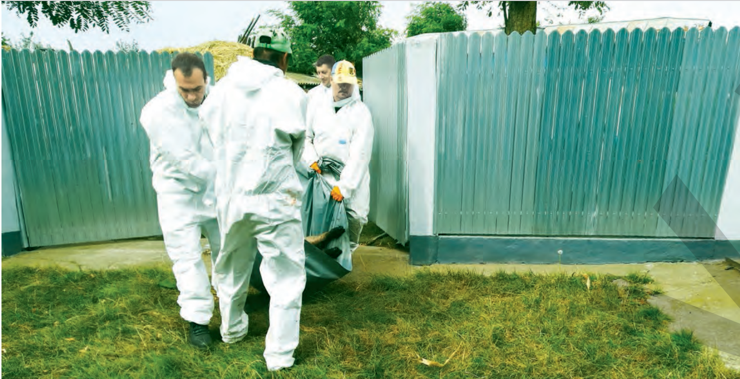
● Autoritățile așteaptă confirmare pentru alte două focare

DOUĂ FOCARE CONFIRMATE, ALTE DOUĂ AȘTEAPTĂ BULETINUL DE ANALIZĂ ● ALERTĂ