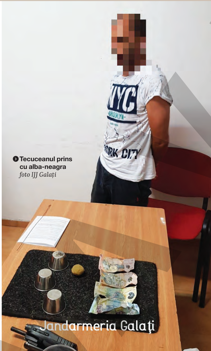
● Tecuceanul prins cu alba-neagra

Din peisajul bâlcii de la Tecuci nu au lipsit nici petrecăreții care nu au avut grijă de propriile lucruri, dar și cei care au profitat de naivitatea celorlalți cu scopul de a face rapid rost de bani. În prima categorie s-a înscris o tânără din Corod, venită la petrecerea de la Tecuci, care în iureșul distracției și-a pierdut portofelul plin cu acte, bani și carduri. A avut norocul ca portmoneul să fie găsit de jandarmi, în iarbă. „Întrucât jandarmii nu au reușit să identifice proprietara portofelului printre participanții la manifestarea cultural-artistică, au ales să posteze câteva date ale acesteia pe un grup de Facebook, iar în scurt timp o persoană a recunoscut-o și a anunțat-o că portofelul se află la jandarmi, de unde îl poate ridica”, a explicat reprezentantul