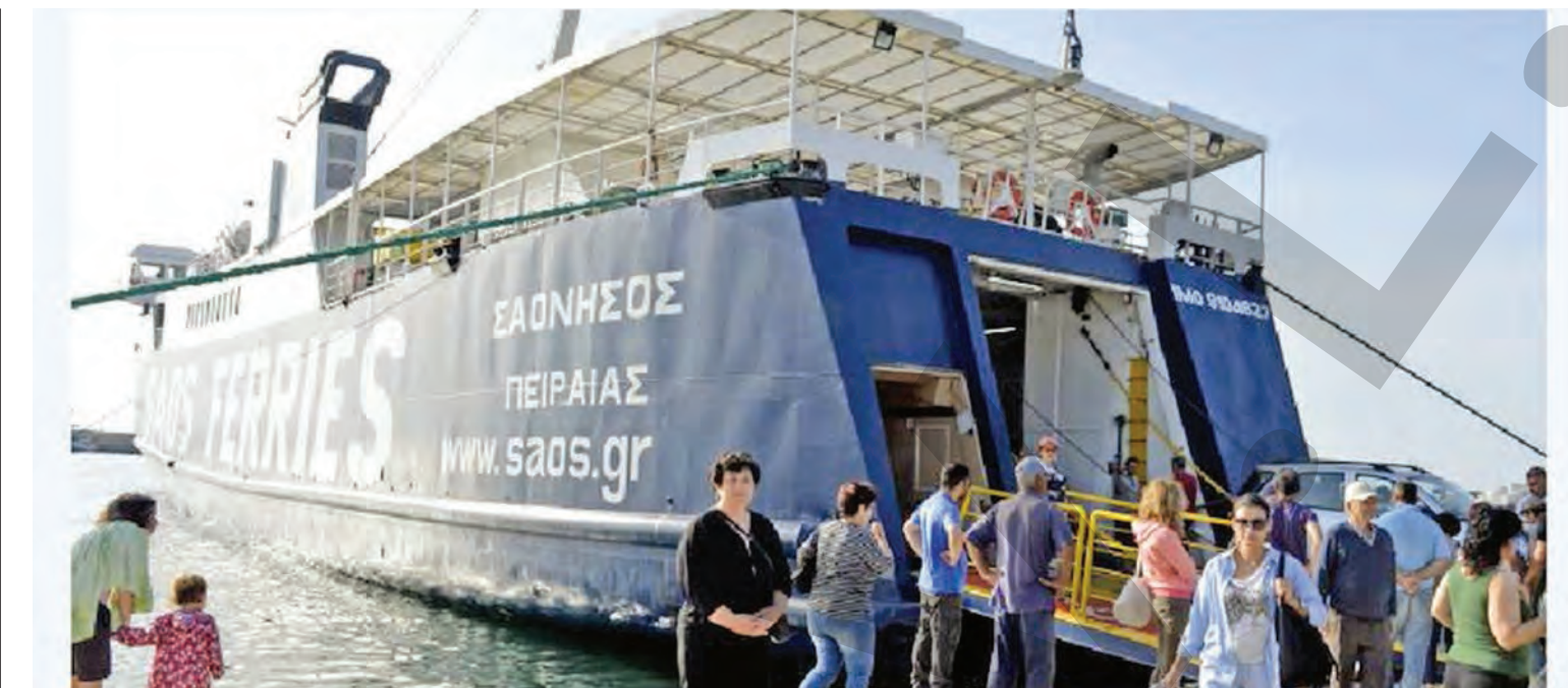
● Turiștii români spun că au trăit un adevărat coșmar pe insula Samothraki