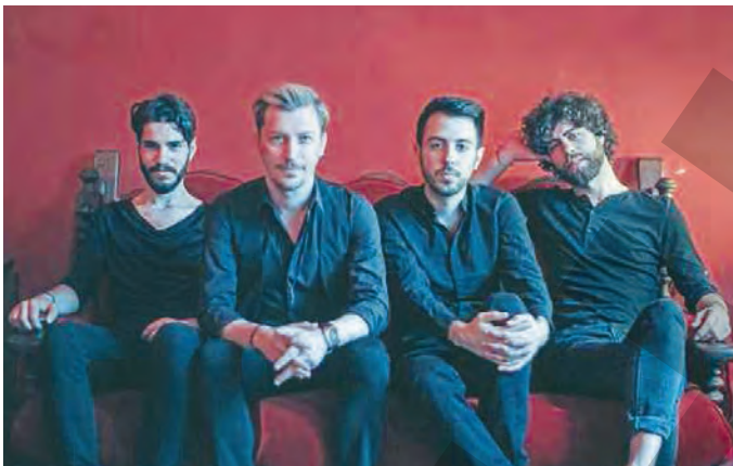
● The Mono Jacks

Concertele, proiecțiile de film și atelierele pentru copii vor fi deschise în fiecare zi de festival, de la aceleași ore. ●