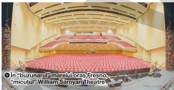
● În „buzunarul” marelui oraș Fresno, „micuțul” William Saroyan Theatre