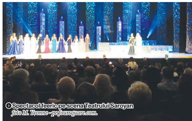
● Spectacol feeric pe scena Teatrului Saroyan