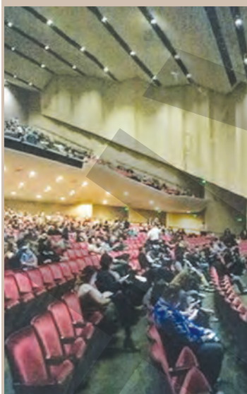
● Enormul William Saroyan Theatre - numai bun de prezentat gălățenilor