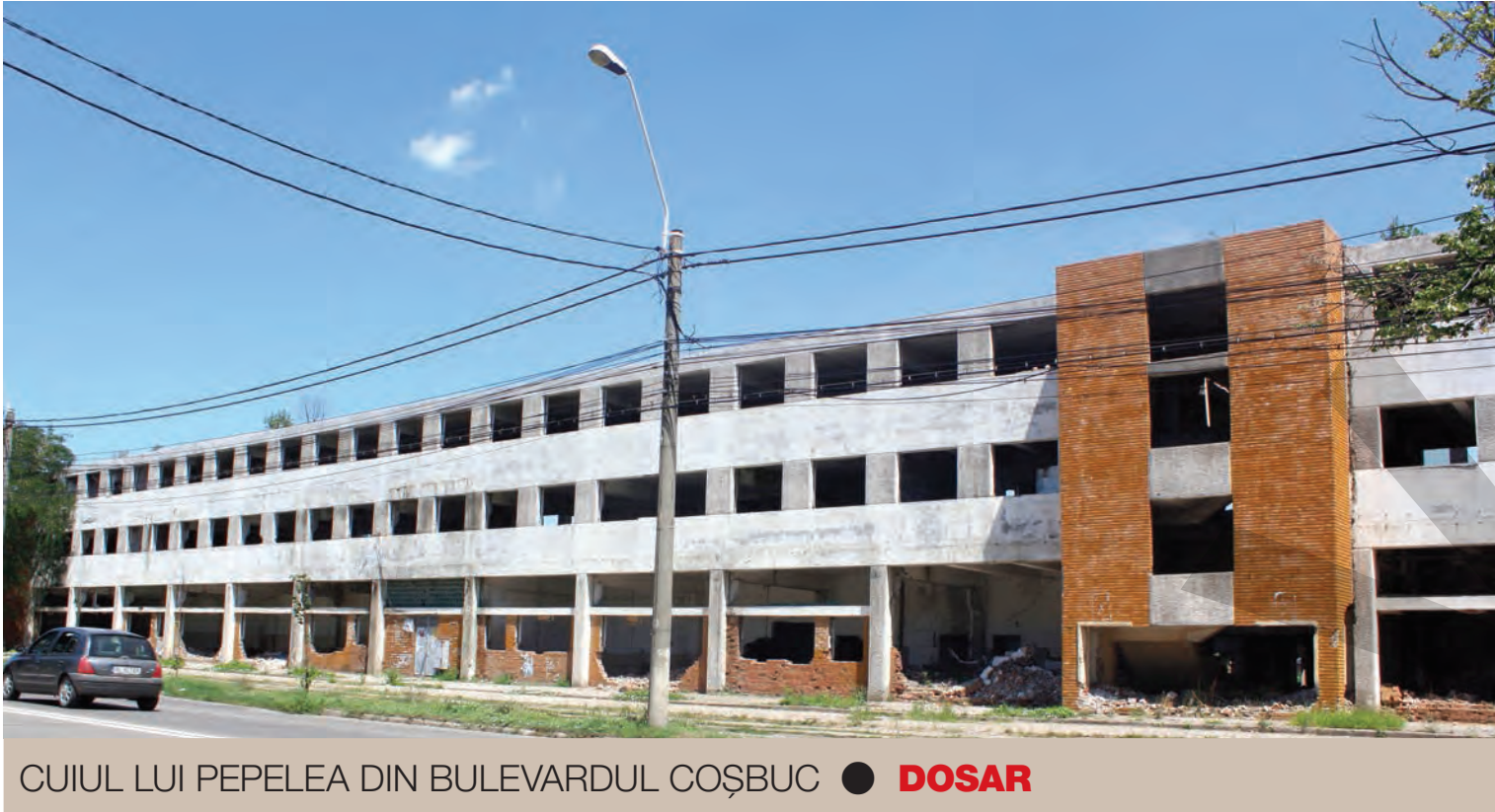
CUIUL LUI PEPELEA DIN BULEVARDUL COȘBUC ● DOSAR