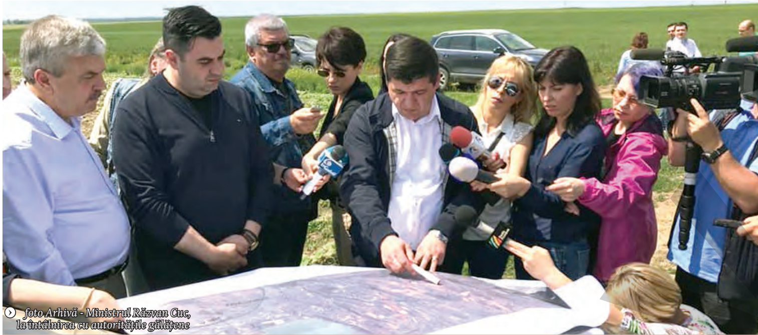
Ministrul Răzvan Cuc, la întâlnirea cu autoritățile gălățene

PROIECT PRIVIND INDICATORII TEHNICO-ECONOMICI ● INFRASTRUCTURĂ