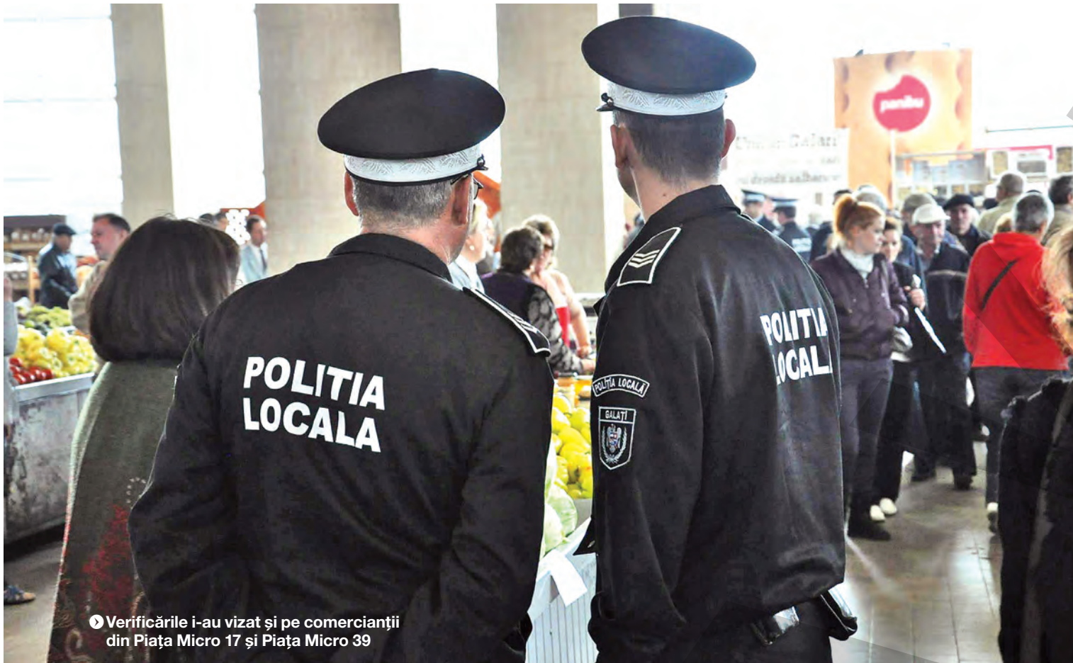
Verificările i-au vizat și pe comercianții din Piața Micro 17 și Piața Micro 39

CONTROALE LA AGENȚII ECONOMICI DIN GALAȚI ● ACȚIUNE