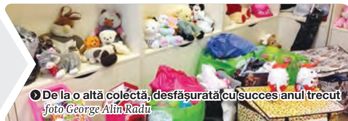
► De la o altă colecție, desfășurată cu succes anul trecut

nare, radiere, blocuri de desen, acuarele sau orice alte lucruri necesare școlărilor”, anunță organizatorul, gălățeanul George Alin Radu, care a mai organizat în același loc, în luna martie, o colecție de haine, la care au participat cam 500 de donatori. ● V. Cilincă