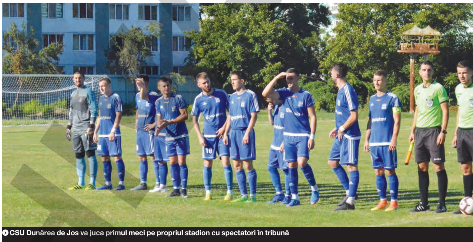
CSU Dunărea de Jos va juca primul meci pe propriul stadion cu spectatori în tribună