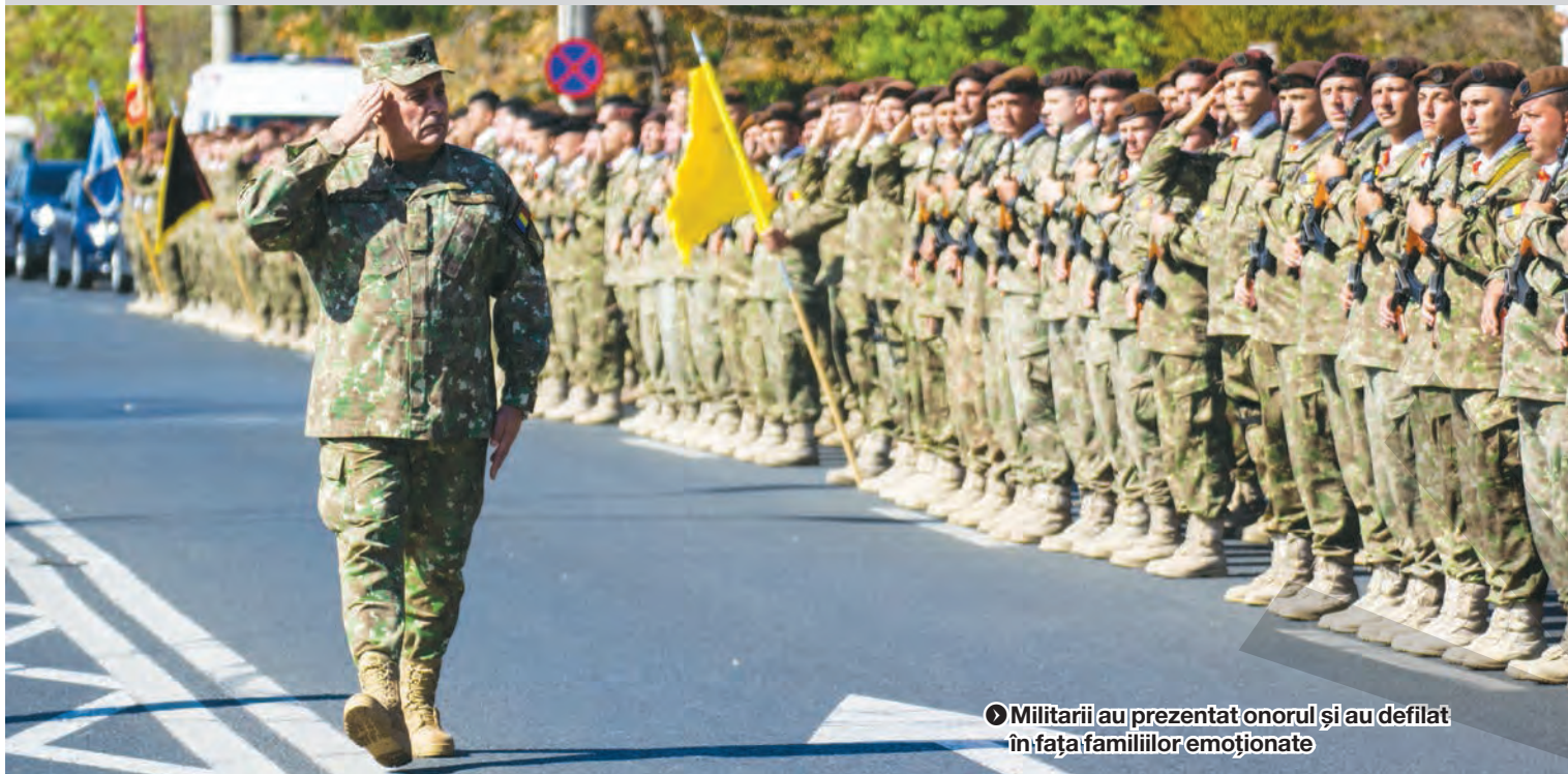
► Militarii au prezentat onorul și au defilat în fața familiilor emoționate

CEREMONIAL PENTRU REPATRIEREA SOLDAȚILOR DIN AFGANISTAN ● EMOȚII