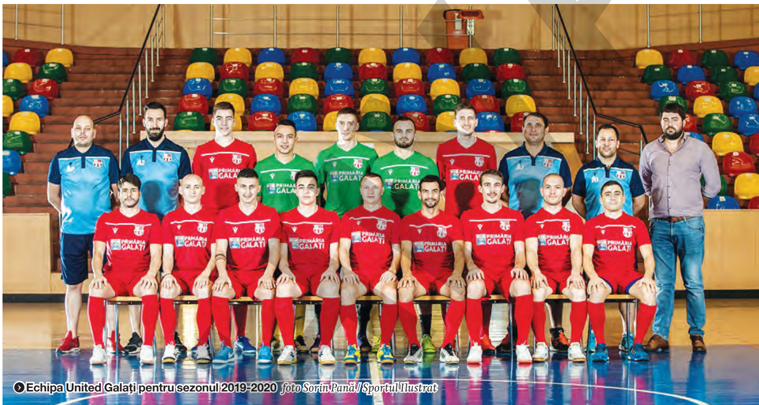
► Echipa United Galați pentru sezonul 2019-2020