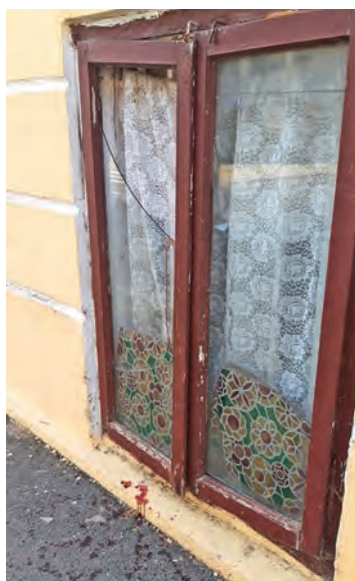
● Geamul în care s-a tăiat tânărul, în cădere

„FACULTATEA DE MEDICINĂ FUNCȚIONEAZĂ ÎN CLĂDIREA FOSTEI POLICLINICI ȘI ÎN CONȘTIINȚA TUTUROR ESTE IDENTIFICATĂ CA UN LOC UNDE POȚI OBTINE UN AJUTOR MEDICAL”