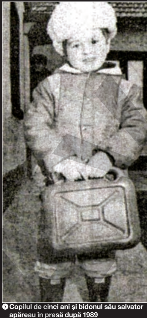
● Copilul de cinci ani și bidonul său salvator apăreau în presă după 1989