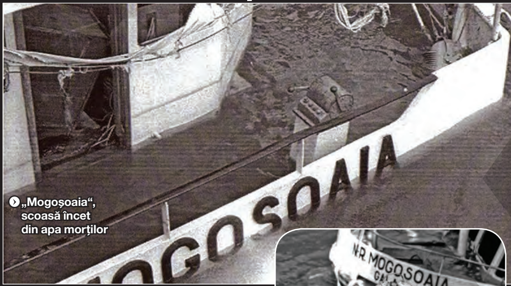
● „Mogoșoia“, scoasă încet din apa morților