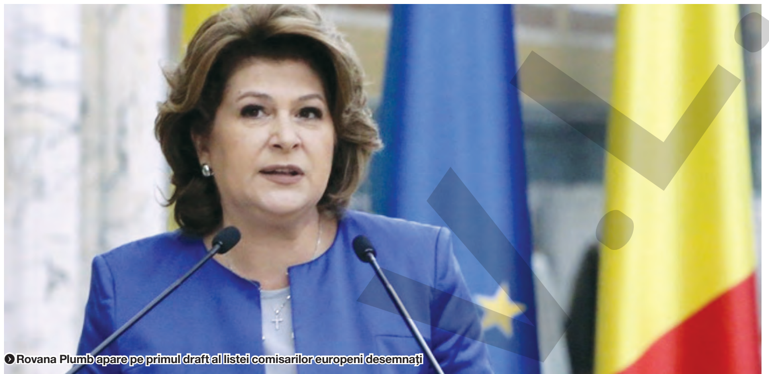
● Rovana Plumb apare pe primul draft al listei comisarilor europeni desemnați

împreună cu cei din cadrul Serviciului de Investiții Criminale s-au deplasat de îndată la fața locului și efectuează cercetări în vederea stabilirii situației de fapt și identificării celui care a săvârșit fapta”, susțin polițiștii din Olt. ● T.M.