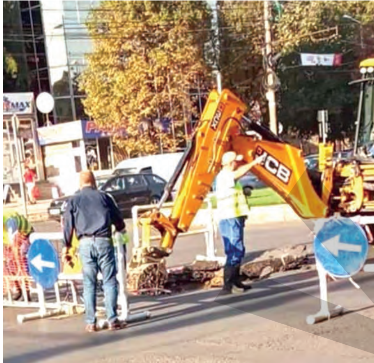
● Surparea a apărut din cauza unei avarii la o conductă de apă