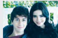
SUA, Comedie, Dramă, Romantic