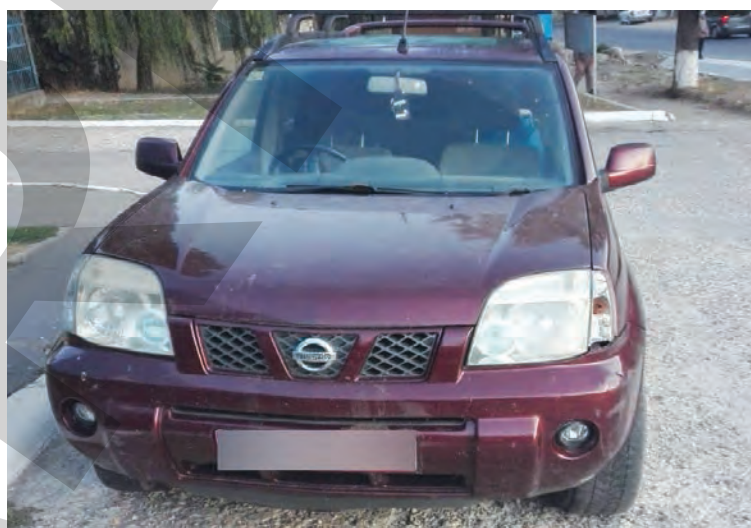
● Mașina condusă fără permis foto STPF Galați

Un tânăr în vârstă de 33 de ani, din județul Galați, ar putea plăti cu câțiva ani de libertate faptul că nu s-a putut abține de la condus mașina, în ciuda faptului că polițiștii i-au interzis acest lucru. Bărbatul fusese sancționat contravențional pentru o abatere la regimul rutier, în urma căreia i se suspendase temporar dreptul de a șofa. Cu toate acestea, s-a urcat la volanul unui autoturism și a pornit la drum, înainte ca perioada legală de suspendare să fi expirat. A avut ghinionul