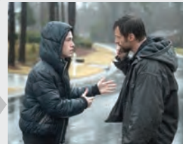
SUA, Crimă, Dramă