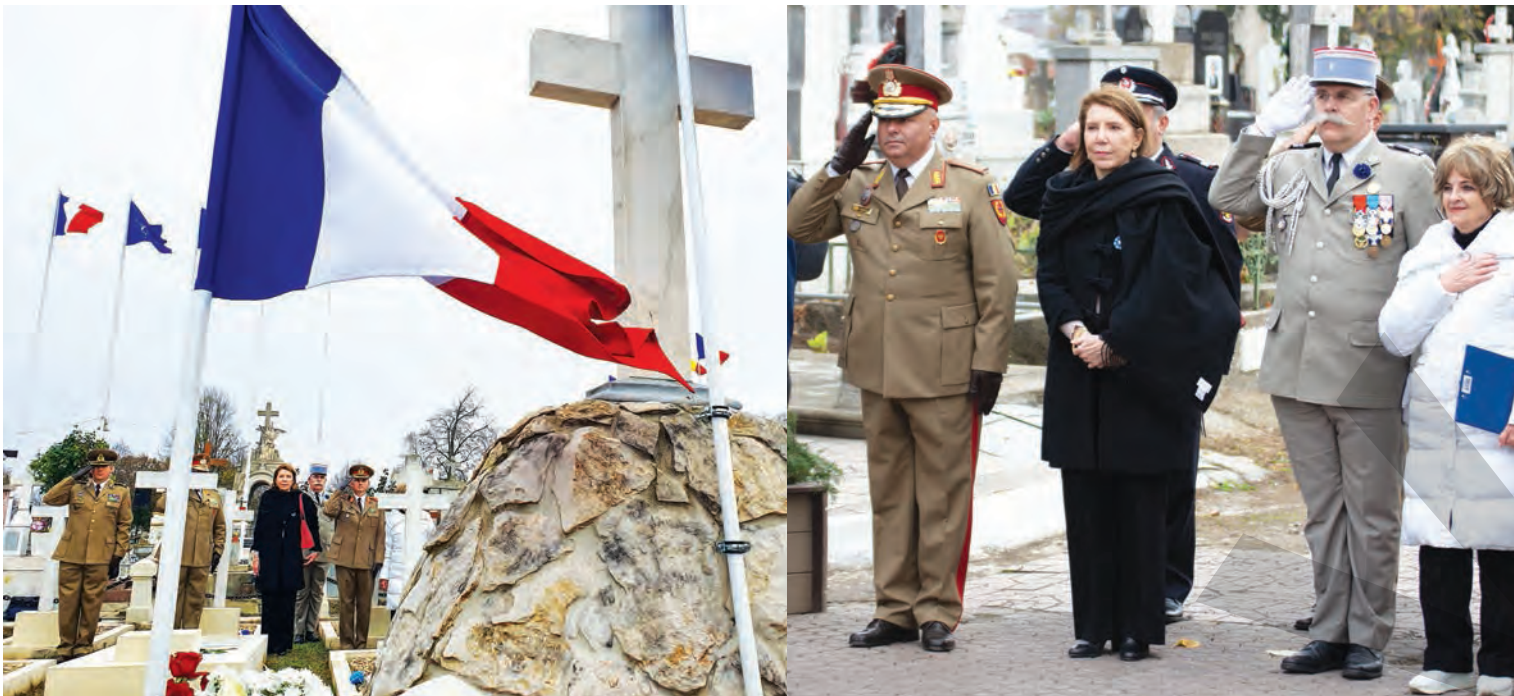
● Ambasadoarea Franței, între înalți ofițeri din Franța și România, salutând drapelul francez

GESTURI PIOASE LA ZIUA ARMISTIȚIULUI ● CEREMONIE