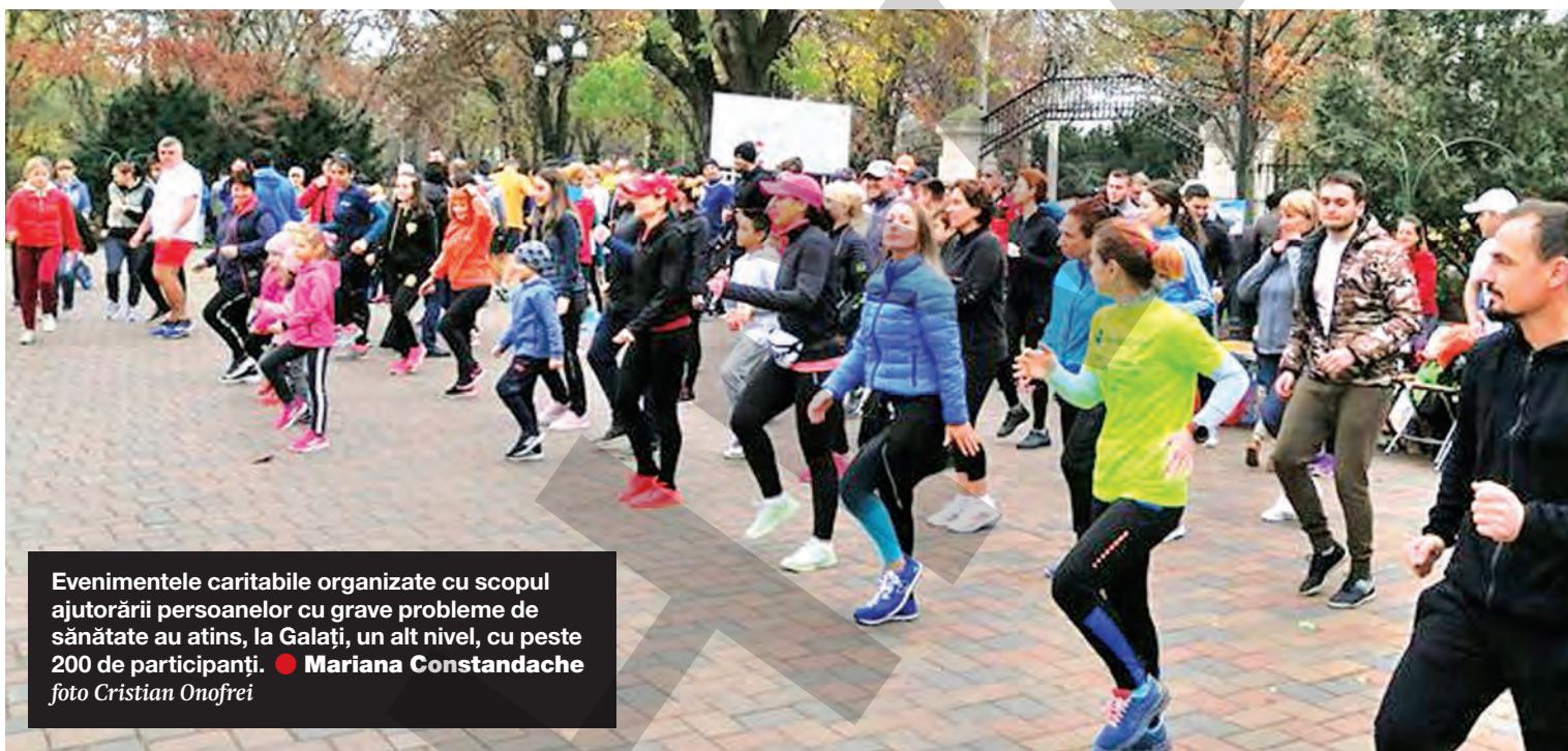
Evenimentele caritabile organizate cu scopul ajutorării persoanelor cu grave probleme de sănătate au atins, la Galați, un alt nivel, cu peste 200 de participanți. ● Mariana Constandache