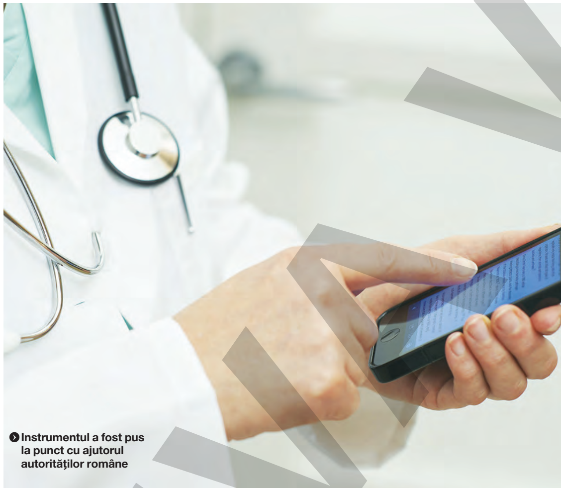
Instrumentul a fost pus la punct cu ajutorul autorităților române

Specialiștii arată că două din cinci persoane diagnosticate cu cancer spun că și-au pierdut pofta de mâncare. În plus, circa 43 la sută din pacienți suferă de stres psihologic major. De aceea, pacienților le este recomandat să nu se informeze din surse necredibile de pe Internet,