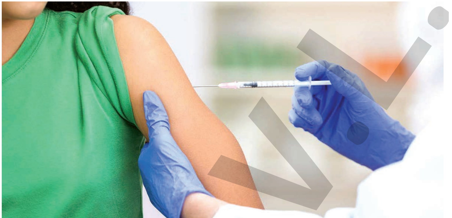
● Medicii spun că temerile în privința acestui vaccin sunt nejustificate

Românii, alături de maghiari și de polonezi, sunt cei mai afectați dintre europeni de particulele nocive din aer. Cercetătorii încurajează eliminarea treptată a centrelor pe cărbune și recomandă transportul în comun, precum și diete bazate pe recoltele agricole de sezon. ● R.B.