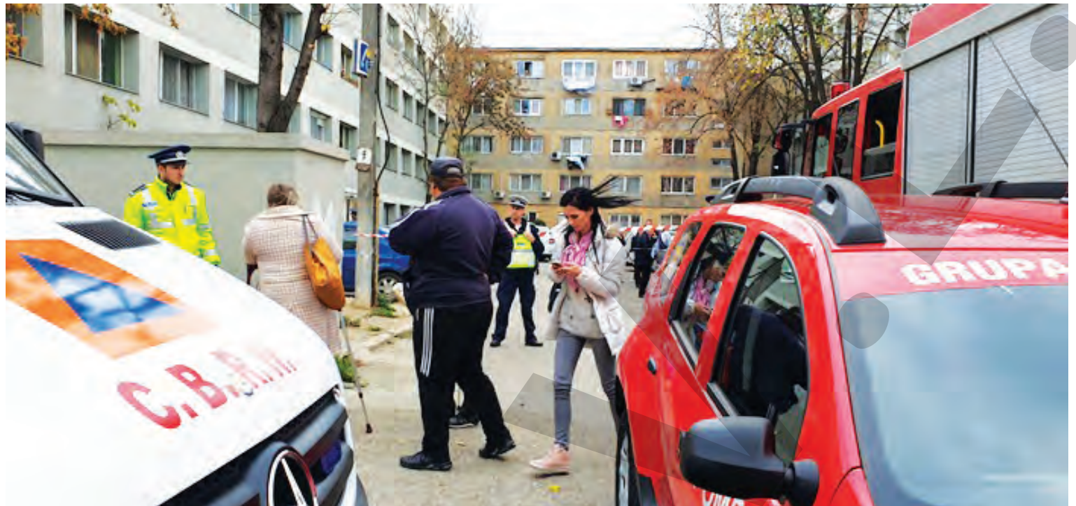
● Salvatorii au decis evacuarea întregului bloc