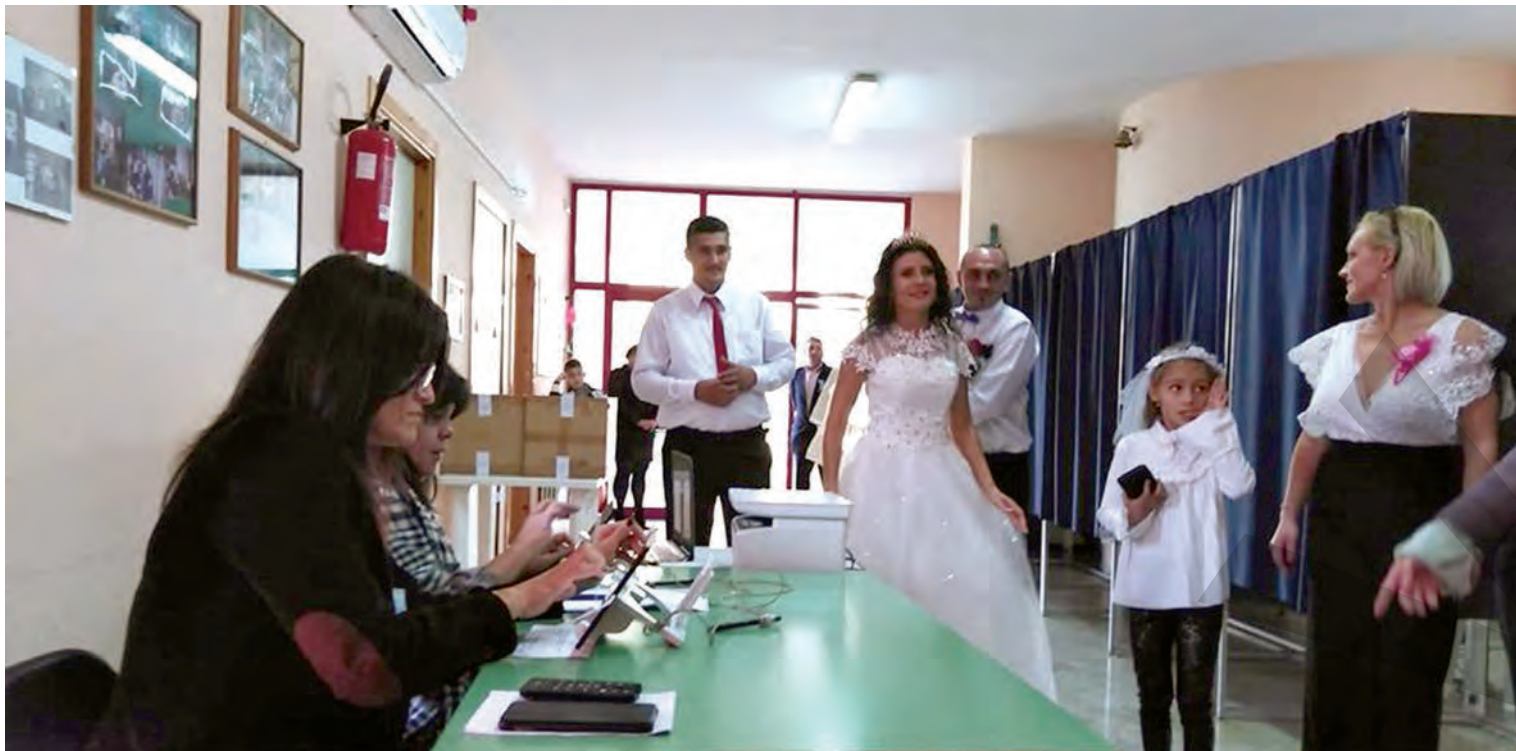
În ziua nunții, două mirese românce din Italia și Germania au ales să voteze pentru președintele României

REZULTATELE OFICIALE ALE ALEGERILOR PREZIDENȚIALE ● SCORURI