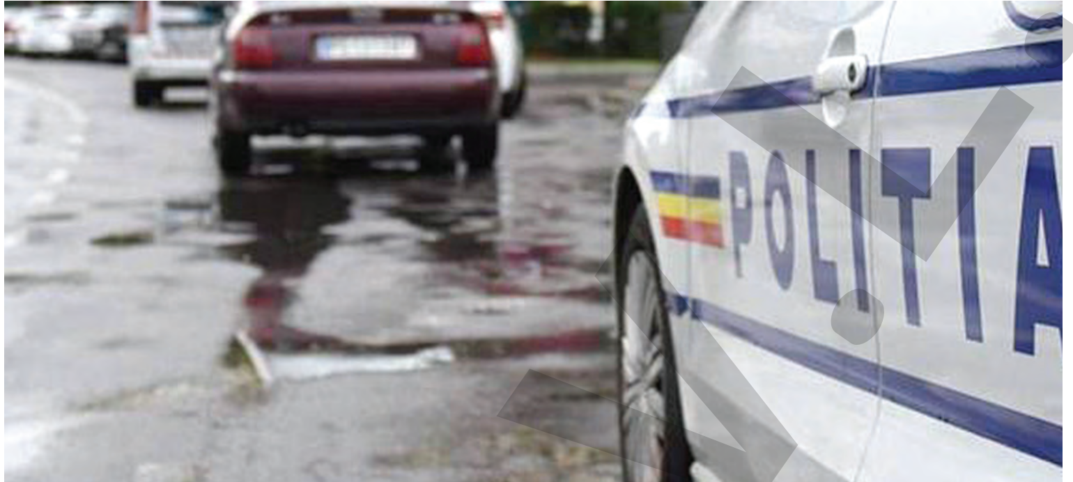
● Anchetatorii au audiat persoanele care au găsit oasele

AEP. Autoritatea Electorală Permanentă (AEP) a transmis că numărul total al alegătorilor înscrisi în listele electorale permanente este de 18.217.411 persoane, iar în străinătate figurează 715.064 de cetățeni români cu drept de vot la scrutinul din 24 noiembrie. AEP precizează că alegătorii care au domiciliul în România și care au optat să voteze în străinătate, atât pentru votul prin corespondență, cât și pentru votul la o secție de votare, în număr de 63.362, au fost radiați din listele electorale permanente din România. ● T.M.