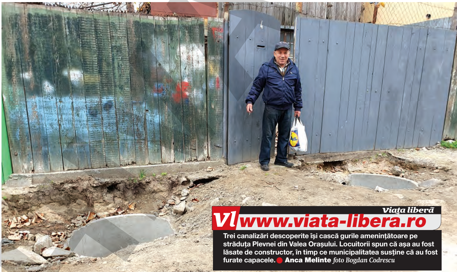
Viata libera www.viata-libera.ro Trei canalizări descoperite își cască gurile amenințătoare pe străduța Plevnei din Valea Orașului. Locuitorii spun că așa au fost lăsate de constructor, în timp ce municipalitatea susține că au fost furate capacele. ● Anca Melinte