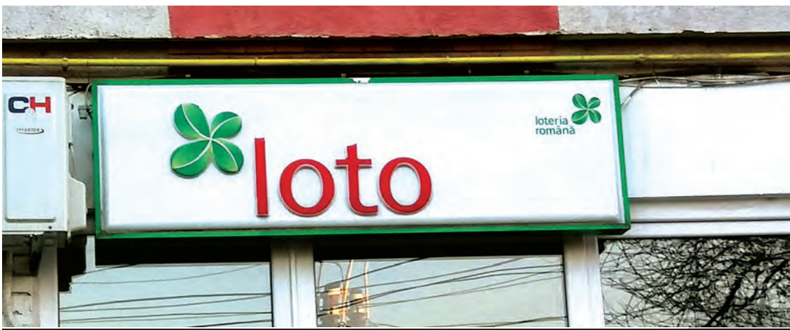
Loteria Română pregătește un anunț important pentru contribuabilii județului Galați. Cin' să fie, cin' să fie?

La așa ceva nu se aștepta nimeni: un câștigător al potului cel mare la jocul 6 din 49 ar putea deveni persoana numărul 1 a județului Galați. Bilele ar putea decide și altceva, căci poate n-ați prins ideea. Noul prefect va fi decis de Compania Națională care deține monopolul privind organizarea și exploatarea jocurilor de noroc.