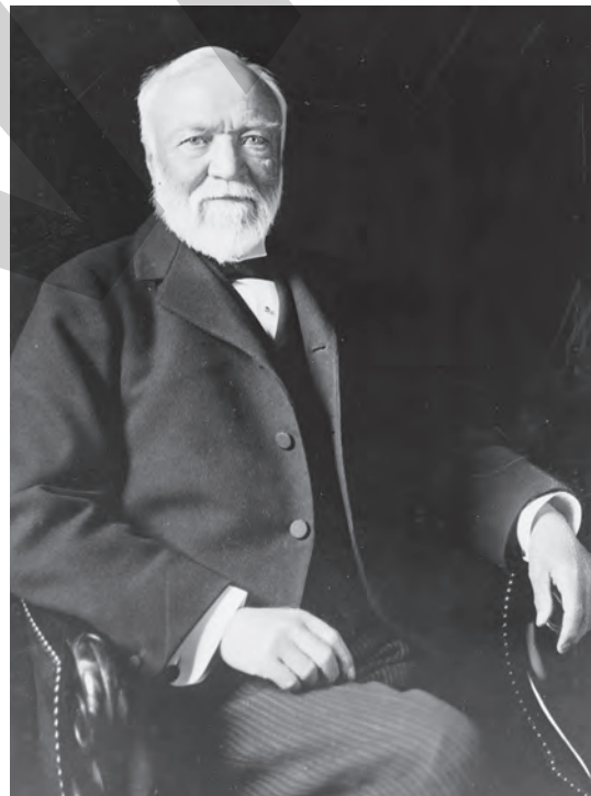
➤ Carnegie, în 1913

Unul dintre punctele de interes ale lui Carnegie a fost înființarea bibliotecilor publice gratuite, pentru a pune la dispoziția oricui accesul la cultură. Erau doar câteva biblioteci în lume cu acces gratuit, când, în 1881, Carnegie a început să-și promoveze această idee. A cheltuit peste 50 de milioane de dolari SUA pentru a constitui 2.509 biblioteci, în țările vorbitoare de limbă