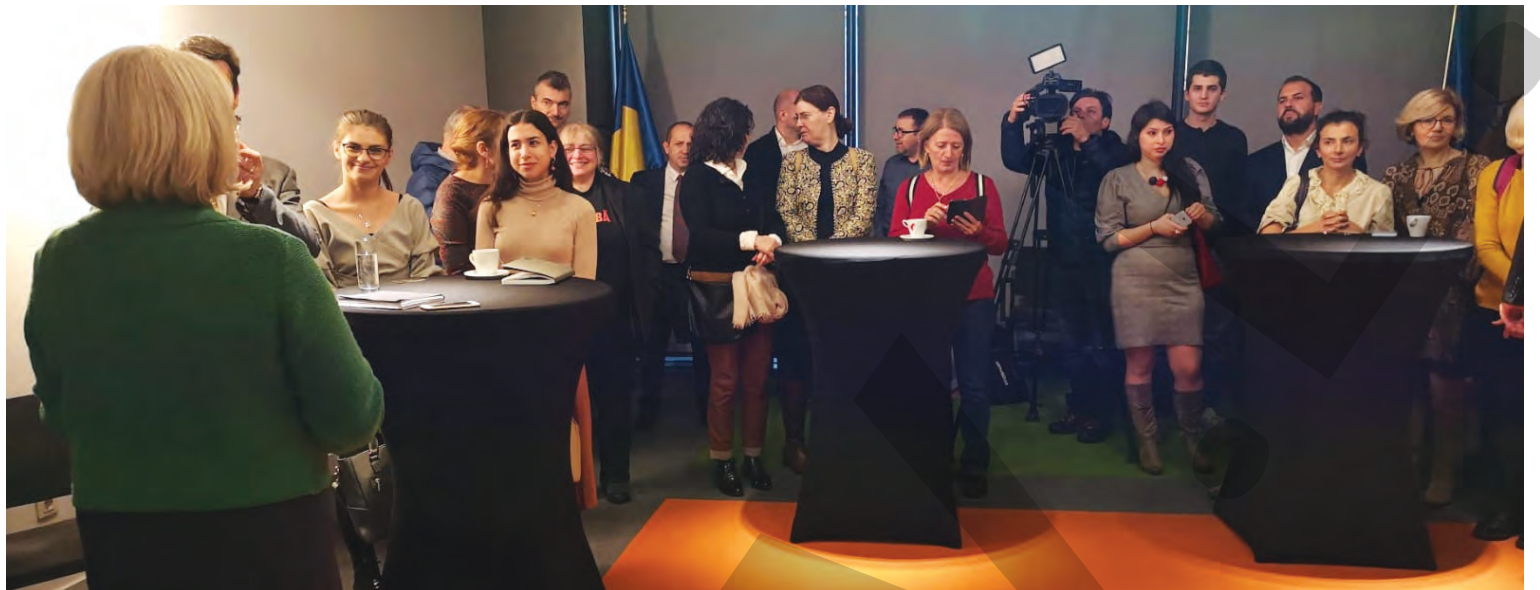
● Lansarea platformei a avut loc joi trecută, la București

PREMIERĂ ABSOLUTĂ ÎN PRESA AUTOHTONĂ ● PROIECT