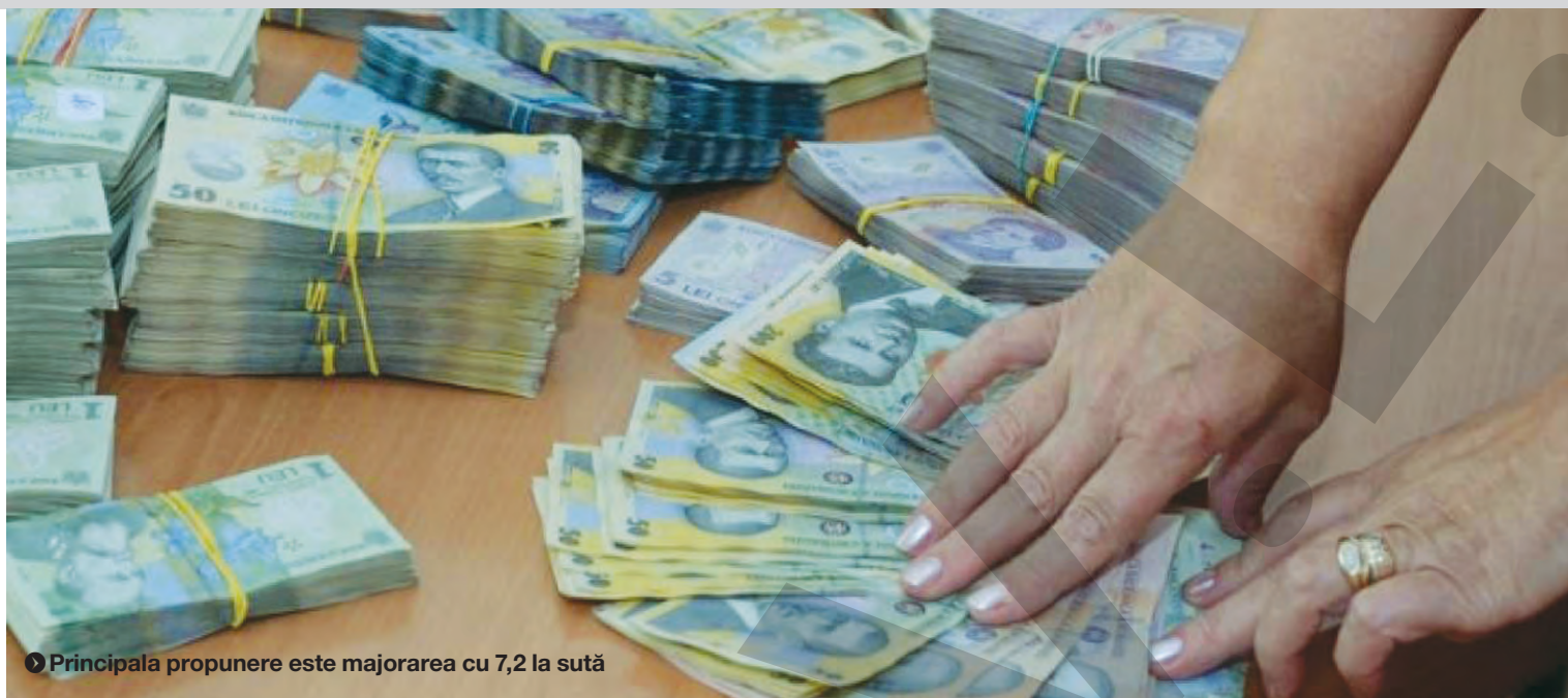
● Principala propunere este majorarea cu 7,2 la sută

PERCHEZIȚII. Polițiștii de frontieră și procurorii DIICOT din Botoșani au efectuat cinci percheziții la membrii unei grupări bănuite că în ultimul an a asigurat călăuzirea și cazarea a 49 de cetățeni din Bangladesh și Pakistan, care încercau să treacă ilegal frontiera pentru a ajunge în vestul Europei. Potrivit unui comunicat al Poliției de Frontieră, din grupare fac parte români și străini, care transportau cetățeni proveniți din Asia în țări din Occident. O persoană a fost reținută pentru 24 de ore, iar o alta a fost plasată sub control judiciar. ● T.M.