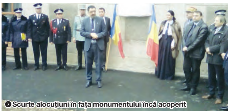
► Scurte alocuțiuni în fața monumentului încă acoperit

Ieri, la serbarea legată de înființarea, acum 152 de ani, adică la 26 noiembrie 1867, a Colegiului Național „Vasile Alecsandri”, printre alte manifestări, a fost dezvelit un basorelief al generalului Eremia Grigorescu, „Eroul de la Mărășești”, fost elev al acestei școli. Evenimentul face parte din programul intitulat „Drumul generalului Eremia Grigorescu”, proiect al Asociației „Galați, orașul meu”, în parteneriat cu Asociația Frontiera Gălățeană, I.J.S.U. Galați și Poliția Locală. Sculptorul Mugurel Vrânceanu, profesor la Liceul de Arte, este autorul matriței după care s-au turnat copii ale acestei lucrări de artă donate și puse în valoare pe clădiri din Galați – la ISJU și Poliția