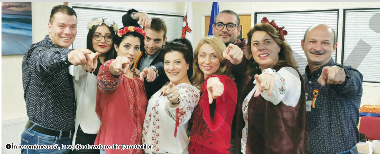
● În ie românească, la secția de votare din Țara Galilor

CUM ESTE SĂRBĂTORITĂ ZIUA NAȚIONALĂ ● 1 DECEMBRIE