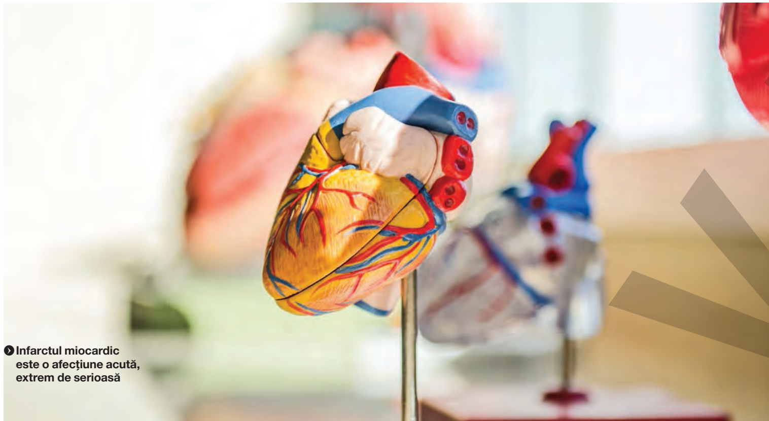
● Infarctul miocardic este o afecțiune acută, extrem de serioasă

LA INSTITUTUL INIMII DIN CLUJ-NAPOCA ● PROIECT