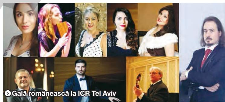
● Gală românească la ICR Tel Aviv

„Rapsodia română nr. 1 în La major”, de George Enescu, va ră-