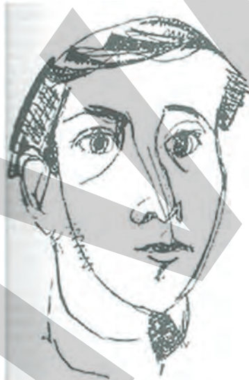
Dragoș Protopopescu desen de Marcel Iancu