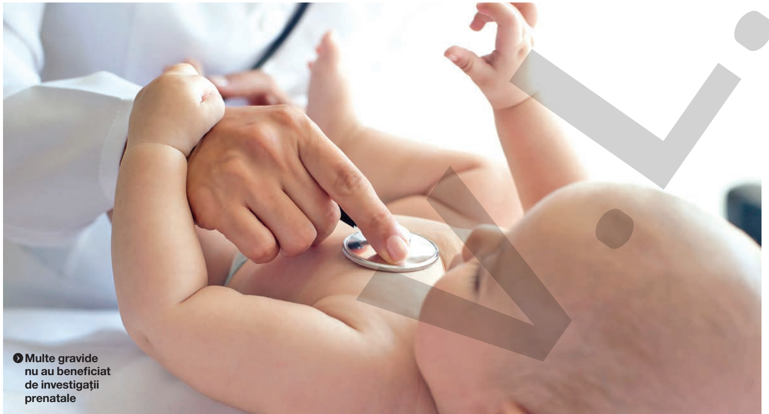
► Multe gravide nu au beneficiat de investigații prenatale

JUDEȚUL GALAȚI, PESTE MEDIA PE ȚARĂ ● FENOMEN