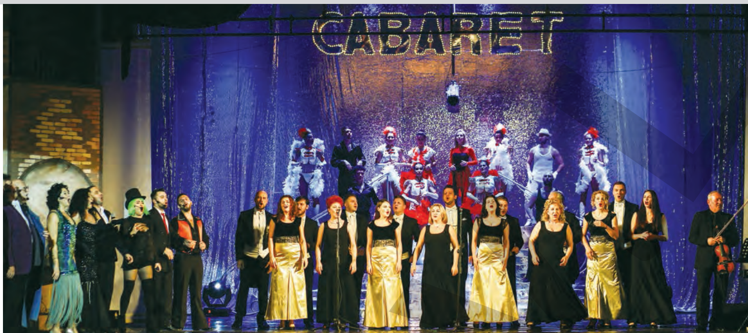
PRIMIT CU CĂLDURĂ DE PUBLIC ● RECENZIE